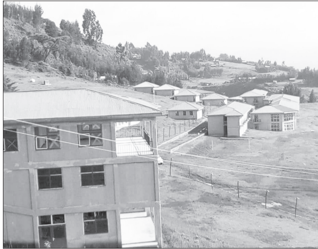
ደሴ ልዩ አዳሪ ትምህርት ቤት