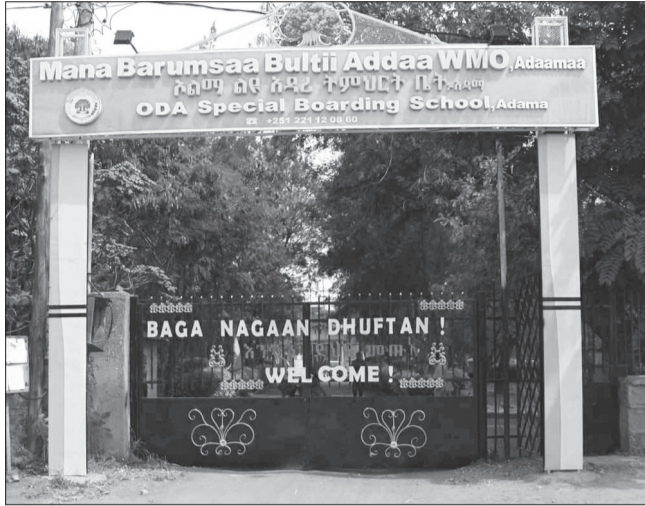
የሶርጫያ ልማት ማህበር ልዩ አዳሪ ትምህርት ቤት