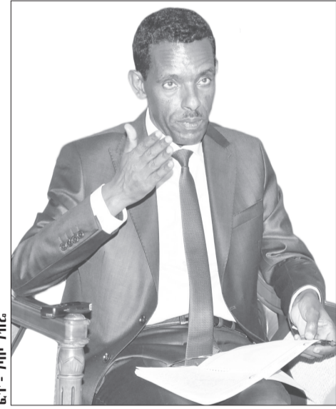
ኮሚሽኑ ደብሎ ቃበታ

አዲስ አበባ፡- የኮንትራባንድ ንግድን ለመቆጣጠር የሚደረገው ጥረት በከፍተኛ ደረጃ ቢጨምርም ችግሩ ሀገሪቱን ለከፍተኛ አደጋ በሚያጋለጥ ደረጃ መጨመሩን ጉምሩክ ኮሚሽን አስታወቀ። በኮንትራባንድ ሳቢያ ከጣዕድን የሚገኘው ገቢ 63 በመቶ መቀነሱም ታወቋል።