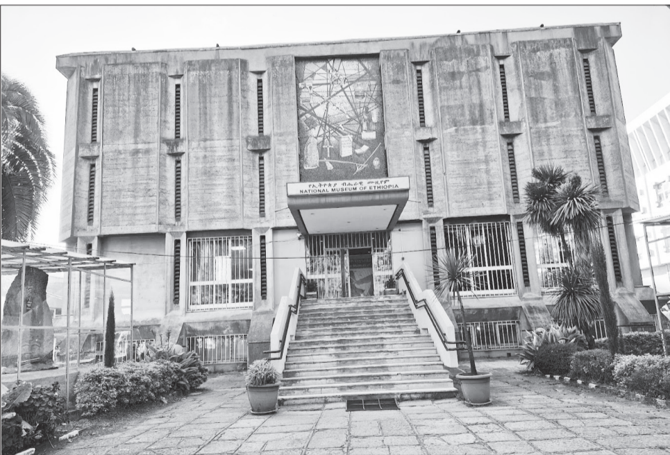
የኢትዮጵያ ብሔራዊ መዚያም