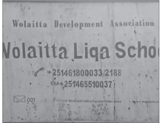
ወላይታ ሲቃ ልዩ አዳሪ ትምህርት ቤት