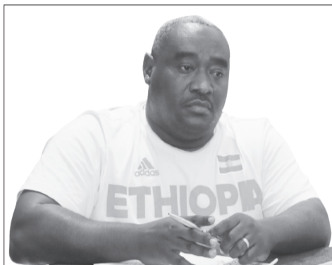
ሕገ ስብደት ጉጅ

አዲስ አበባ፡- ለአካል ጉዳተኞች ታሰቦ የወጣው የሕንፃ ተደራሽነት አዋጅ የአካል ጉዳተኞችን ችግር የሚቀርፍ ባለመሆኑ መስተካከል እንዳለበት የኢትዮጵያ አካል ጉዳተኞች ማኅበራት ፌዴሬሽን አሳሰበ። የከተማ ልማትና ኮንስትራክሽን ሚኒስቴር በበኩሉ ችግሩ የሕንፃ ክፍተት ሳይሆን የአፈጻጸም ችግር መሆኑን አስታውቋል።