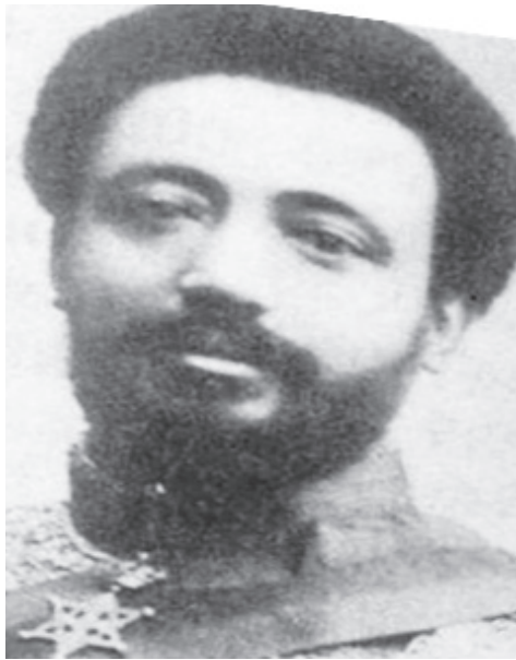
ራስ ደስታ ዳምጠው