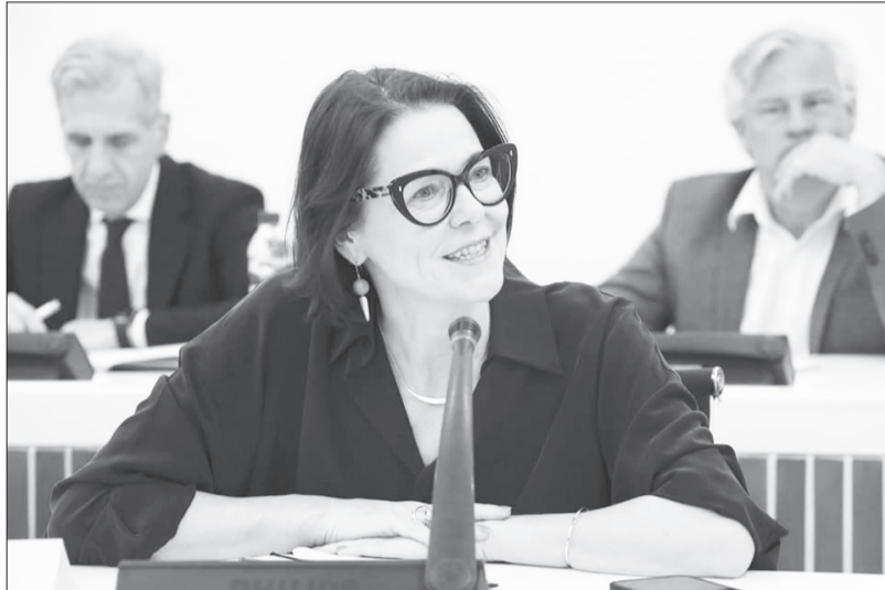
ካትሊን ቫን ብሬምት

ግጭት፣ ድርቅና፣ የአየር ንብረት ለውጥ የጤና ስርዓቶችን እየጎዱ ይገኛል። በመሆኑም ችግሮችን በቅንጅት መፍታት በሚቻልባቸው መንገዶች ላይ የልምድ ልውውጥ በማድረግ በጋራ ትብብር መንፈስ ከአጫጫሪ የሕዝብ ተወካዮች ምክር ቤት ጋር ጠንካራ ግንኙነት መመስረት እንፈልጋለን ብለዋል።