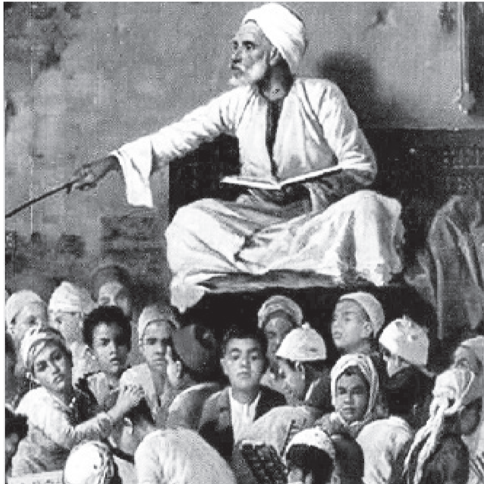
የአሸር ቤት ወይም መደረሳ

ቤታችን እንሄዳለን። አረፍት ስለምንሆን ጊዜውን በደስታ እንራገጥበታለን። በቁስ ትምህርት ቤት፣ የትምህርት ጅምር ጉዞ እንዲህ አሃዱ ብሎ ህግና ሥርዓት ማክበር ነው። የኔታ! እንደ ጨረቃ ያድምቆ፣ እንደ ሰርዶ ያለምልምም፣ ብሎ መመረቅና ጉልበት መሳም የተለመደ ነበር። እየተማርን የኔታ የሚገቡ ከሆነ ሁላችንም ብድግ ብለን እንሳኝ ነበር። ሌሎች አንግዶችም ቢመጡ ታላላቆችን አክብሮ መነሳት ሥርዓት ነበር። ቁጭ በሉ ስንባል አንቀመጣለን።