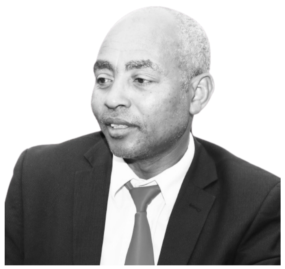
ትኩረት ተደርጎ እየተሰራ መሆኑን ገልፀዋል።

ከዚህም በተጨማሪ ቅድሚያ ተሰጥቷቸው ዝርያቸውን የማብዛት ስራ እየተሰራባቸው ያሉ የቦረና፤ የሸኮ፤ ቤጋይት፤ ፎገራ፤ ቤጋይ ዳልጋ ከብቶችን ሲሆን፤ ይህ የቦረና ዳልጋ ከብት ቀደም ሲል የመጥፋት ስጋት ነበረበት። አሁን በተከሰተው የድርቅ አደጋ ምክንያት ዝርያው የመመናመን ሁኔታ ታይቶበታል። በረና አካባቢ ያለው ይህ ዝርያ እንዳይጠፋ ተቋም ወደ አንድ ሚሊየን