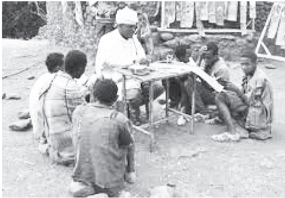
የቁስ ትምህርት ቤት

ትምህርታችን በመደዳ ተቀምጠን ተቃቅሬን እንደነገሩት እየተወዘዘን ፊደላችንን ይዘን በዜማ እንለው ነበር። ፊደሉን ስንጨርስ « የኔታ ጥሮ ጠጅ ይንቀቀር፣ በጠላት ጥሮ አጥንት ይሰንቀር » ስንል ይታወቅናል። ወር በገባ በ21 ማርያም ይባልና 10 ሳንቲም ከቤት አምጥተን አምባሻ ተገዝቶ ተቆሮ በልተን ወደ