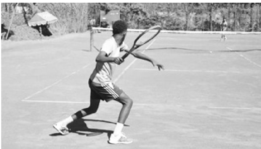
በቻምፒዮናው 14 ኢትዮጵያውያን ወጣቶች የቴኒስ ተጫዋቾች ተሳትፈዋል።

መሰል የውድድር አይነቶች በአገር ውስጥ መዘጋጀታቸው ለአገር ውስጥ ተጫዋቾችና ለቴኒስ ተመልካቾች ጥሩ ልምድ ከመሆኑ ባሻገር ስፖርቱ በሌላው ዓለም የደረሰበትን ደረጃ ለመከተል መልካም አጋጣሚ