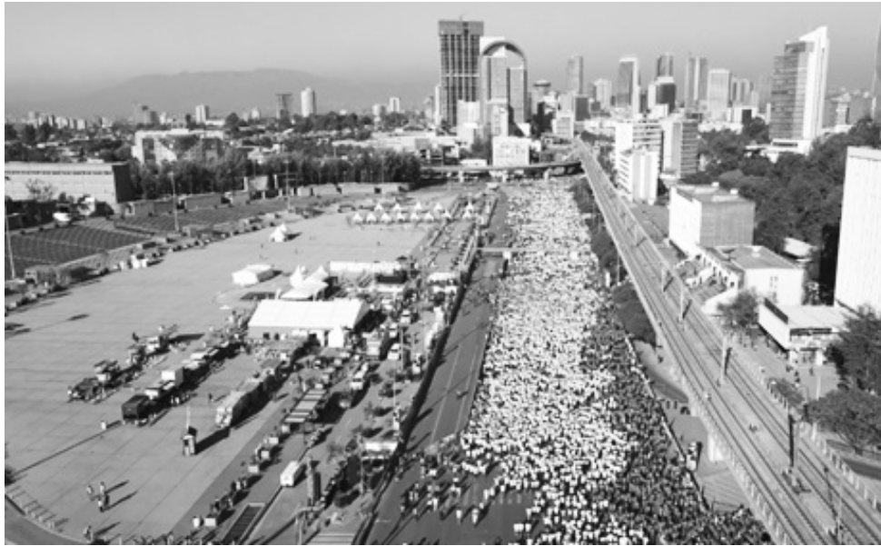
ኢትዮጵያ በዓለም ላይ ከሚካሄዱት ምርጥ የ10 ኪሎ ሜትር ውድድሮችን በማዘጋጀት ስህተት ተከታታይ ጊዜ ቀዳሚ ሆናለች

ይህ ስኬት የኢትዮጵያ ስኬት መሆኑን የተናገሩት ወይዘሮ ዳግማዊት፣ በተለይም ከመጀመሪያ አንስቶ ለውድድሩ ድጋፍ ያደረጉ አትሌቶች የዚህ ስኬት ሚስጥሮች መሆናቸውን ገልጸዋል። በተጨማሪም ለተገኘው ስኬት