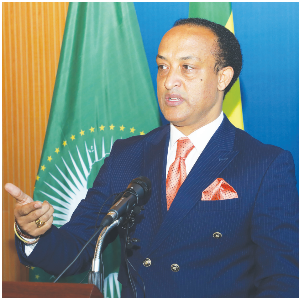
አምባሳደር መለስ አለም