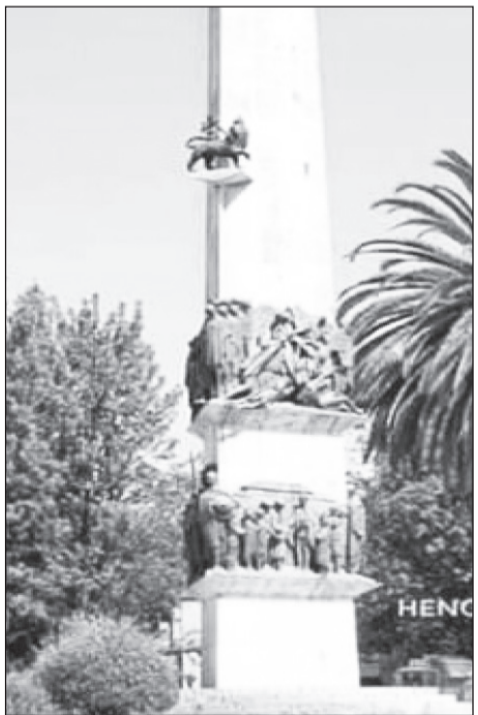
(League of Nations) ተመስርቶ የነበረበት ነበርና ኢትዮጵያ ለዚህ ድርጅት ወረራው ተገቢ አይደለም ብላ አቤት ብትልም አጋርነት ካላቸው ጥቂት ሀገራት ውጭ ሰሚ ማግኘት አልቻለችም።

በ1928 ዓ.ም በአዚያ ዘመን በተፈፀሙት የወረራ ታሪኮች ታይቶና ተሰምቶ በማይታወቅ ሁኔታ ጣልያን ግዙፍ ኃይሏን አሰልፋ ኢትዮጵያን ድጋሚ ወረረች። ከመሬት በታንክ፣ በመድፍና በመትረየስ፣ ከአየር በምብ በሚጥሉ እና የመርዝ ጋዝ በሚያዘነቡ አውሮፕላኖች የኢትዮጵያን ሕዝብ ጨፈጨፉ። ጊዜው የዓለም መንግሥታት ማህበር