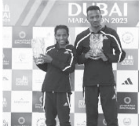
ኢትዮጵያዊ አትሌቶች ዴራ ዲዳና አብዲሳ ቶላ ከአንድ ቤተሰብ የ2023 የዳባይ ማራቶንን አሸንፈዋል።

ወይም የተለየ ነገር ቢኖር ውድድሩ በአንድ ቤተሰብ የበላይነት መጠናቀቅ ነው። ሃያ ሁለተኛውን የዳባይ ማራቶን በወንዶች የሃያ ሁለት አመቱ አትሌት አብዲሳ ቶላ በ2:05:42 ሰአት ሲያሸንፍ፣ በሴቶች ዴራ ዲዳ 2:21:11 በመግባት አሸናፊ ሆናለች። ማራቶንን ለመጀመሪያ ጊዜ ሮጦ አሸናፊ የሆነው አብዲሳ ቶላ የወቅቱ የማራቶን የአለም ቻምፒዮን አትሌት ታምራት ቶላ ታናሽ ወንድም ሲሆን፣ በሴቶች መካከል የተካሄደውን ውድድር በበላይ ታክቲክ ከወለደ ተመልሶ ማሸነፍ የቻለችው ዴራ ዲዳም የታምራት ቶላ ባለቤት ናት። ይህም በውድድሩ የታዩ አንድ አዲስ ነገር ሆኖ በአለም መገናኛ ብዙሃን ተዘግቧል። ወጣቱ አትሌት አብዲሳ ቶላ ከዘንድሮው የዳባይ ማራቶን በፊት አርባ ሁለት ኪሎ ሜትር ተወዳድሮ ባያውቅም በግማሽ ማራቶን 59:54 የሆነ የራሱ ፈጣን ሰአት አለው። በዚህም ዳባይ ላይ በማራቶን የተሻለ ልምድ ያላቸውን አትሌቶች በድንቅ የአጨራረስ ብቃት ለማሸነፍ አልከበደውም። ያምሆኖ ከታላቅ ወንድሙ የተሻለ ፈጣን ሰአት ማስመዘገብ አልቻለም። ታላቅ ወንድሙና የአለም የርቀቱ ቻምፒዮን ታምራት ቶላ በዳባይ ማራቶን እኤአ 2017 ላይ 2:04:11 በሆነ ሰአት ማሸነፉ ይታወቃል። አዲሱን የዳባይ ማራቶን ቻምፒዮን ተከትሎ ሌላኛው ኢትዮጵያዊ አትሌት ደሬሳ ኡልፋታ