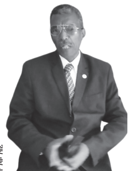
የሕግ ባለሙያ ተሾመ አሸቱ