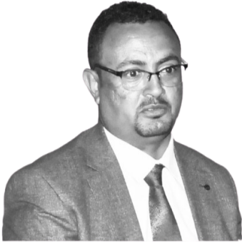
የግብርና ሚኒስቴር ሚኒስትር ዴቤታ ዶክተር መለስ መኮንን

ለእነዚህ አካባቢዎች አትዮጵያ ሜትሮሎጂ ኢንስቲትዩት አካባቢዎቹ የዘናብ ክስተቶችን መሠረት በማድረግ የ2015 ዓ.ም የበልግ ወቅት ዝናብ ስርጭት ከመደበኛው ጊዜ ትንሽ ዘግይቶ እንደሚጀምር መተንበዩንና በአጠቃላይ የዝናብ ስርጭት ዘግይቶ የሚጀምር ቢሆንም ከመደበኛ የዝናብ ስርጭት ጋር ተቀራራቢ ሆኖ ሲወጣም በመደበኛ ጊዜው እንደሚወጣ አክለው ገልጸዋል።