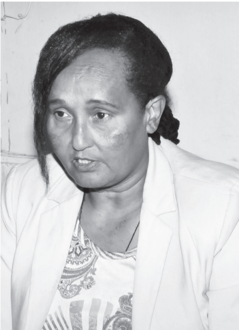
ምክትል ኮሚሽነር ዓለም ጥላሁን

ቢሆንም ከወንጀል ሕግ አንጻር እንዲህ በዋዛ ምላሽ የሚያገኙ አለመሆኑን ያነሳሉ። እንደ ባለሙያው ማህበራሪያ ታዲያ ሕጎች ሲወጡ ተልኳቸው ምንድነው? ምን ያክል የኅብረተሰቡን ችግር ይፈታሉ? የሚለው ይታያል። የወንጀል ሕግ በባሕርይው ዋና ዓላማው ሰዎችን ማስተማር ሲሆን ሁለተኛው ዓላማው የተረጋጋ ኅብረተሰብ እንዲኖር ማድረግ ነው። ለምን ቢባል አንድ ወንጀል ሲፈፀም ወንጀሉ በተፈጸመበት አካባቢ ያለ ኅብረተሰብ ይረበሻልና ነው። ይህ ማለት የተለያዩ እንቅስቃሴዎቹ ይስተጓጎላሉ። የተለያዩ ማኅበራዊ መስተጋብሮቹም ይደነቃቀሳሉ። በንብረት ላይ የተለያዩ ጉዳት ይደርሳል። ሰዎች ሊፈናቀሉ ይችላሉ። ሕጉ ታዲያ ይህን ተጎጂ ኅብረተሰብ ከጉዳት ይከላከላል። በሌላ በኩል ሕጉ ጎጂው አካል በፈፀመው ጥፋት እንዲሆን ማኅበራዊ መስተጋብሮቹ ማሰጠት ይኖረዋል። የመብት ጉዳይም ቢሆን ሴቲቱ ወንጀል ስትፈጸም ገና በዕዳ አሲዛዎችና ከምግብና መጠጥ እንዲሁም መጠለያ ውጪ መነሳቱ በፍፁም አይታሰብም። የመውሰድ መብት ቢሆን በዚህ ረገድ እንደሰብዓዊ ጥያቄ ይቅረብ እንጂ