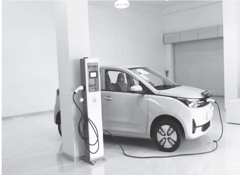
የማይበክሉ መሆናቸውና በሌሎችም መመዘኛዎች ነዳጅ ከሚጠቀሙ ተሽከርካሪዎች የበለጠ ተመራጭ መሆናቸውን ተናግረዋል።

በኤሌክትሪክ ኃይል የሚሠሩ ተሽከርካሪዎች በአንድ ጊዜ በአነስተኛ ወጪ በሚሞሉ ባትሪ ከ200 እስከ 450 ኪሎ ሜትር መጓዝ ይችላሉ ያሉት ሚኒስትር ዴኤታው፤ የጥገና እና መለዋወጫ ዋጋቸውም አነስተኛ ነው፤ ድምፅ