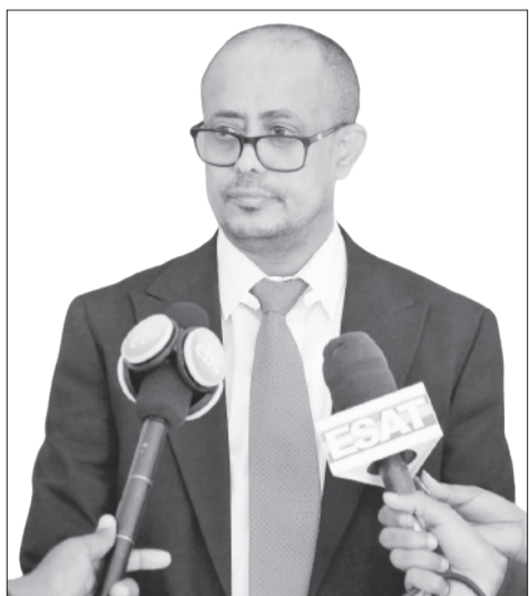
ስት ሙሴ ጌታ አያሌው

ቴክኖሎጂ ሁሉም መሻሻልን የሚፈልግ እንደመሆኑ ሚኒስቴር መሥሪያ ቤቱ በአሁኑ ወቅት ለግብር አሰባሰብ እየተጠቀመበት ያለውን «ሲክታክስ» የተሰኘውን መተግበሪያ በቀጣይ አሻሽሎ ይበልጥ አገልግሎቱን ቀልጣፋ፣ ተደራሽ፣ አስተማማኝና አርኪ ለማድረግ እየሠራ እንደሚገኝ ሚኒስትሩ አመልክተዋል።