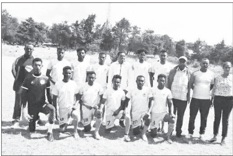
አሰላ ከተማ በትልቅ ደረጃ የሚወዳደር ክለብ እንዲኖራት ጥረት እየተደረገ ነው።

ክለቡ በትልቅ ደረጃ ተፈካካሪ ለመሆን ብዙ ተጫዋቾችን ማስፈረምና ደመወዝ መክፈል ይኖርበታል። ለዚህ ደግሞ ጠንካራ መሠረት ያለው በጀት ያስፈልጋል። ለዚህ ደግሞ ከከተማዋ ከንቲባና ከሚመለከታቸው አካላት ጋር በመሆን ክለቡን ሕዝባዊ መሠረትና ድጋፍ እንዲኖረው ከወዲሁ በርካታ ሥራዎችን ማከናወን ያስፈልጋል። በዚህ ረገድ አሁን የተጀመረው እንቅስቃሴም ተስፋ ሰጪ እንደሆነ የቢሮው ኃላፊ አብራራተዋል።