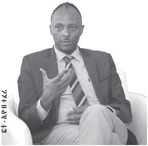
ፎቶ - ኢ.ዩ.ዋ.ተ.ፈ.ሪ

ኢንስቲትዩቱ ሀብታሙን ማማኔት ችግሮች ከመድረሳቸው በፊት አስፈላጊውን ቅድመ ዝግጅት ለማድረግ ያግዛል። ሚኒስትር መስሪያ ቤቱ በትንቢያው መሰረት የዝናብ አጥረት በሚከሰትባቸው አካባቢዎች ውሃ ለማድረስ ዝግጅት ላይ ነው። መካከለኛ እና ለመደበኛው ተቀራራቢ ዝናብ መጠን የሚያገኙ የተገኘውን ውሃ