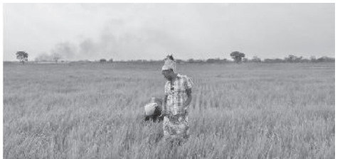
የተወሰኑ ባለሀብቶችም በመከራ ደረጃ ማልማታቸውን ተናግረዋል።

በዚህ ዓመት 480 ሄክታር መሬት በበጋ መስኖ ለማልማት የታቀደ ሲሆን በሦስት ወረዳዎች 139 ሄክታር መሬት በኩታ ገጠም እየለማ እንደሚገኝና