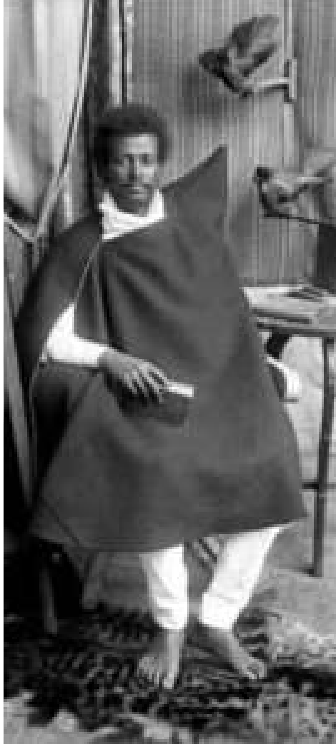
ይህ ቦታ ጠመንጃን ሸገጥ አድርጎ ለመያዝ የሚያገለግል ምስጢራዊ ክፍል ነው። በዚህ መልኩ በርኖስን የሚለብሱ ሰዎች መሣሪያ ይያዙ አይያዙ ማንም ሰው

በርኖስ ማለት ከበግ ጸጉር ተሸልቶ የሚዘጋጅ በተለይ ድሮ ድሮ በሰሜን ሸዋ ደጋማ አካባቢዎች እና በተወሰኑ የጎጃም ክፍሎች የሚለበስ ወፍራምና ጥቁር ካባ መሳይ ልብስ ነው። በርኖስ ዝም ተብሎ ለብርድ ወይም ለፋሽን ያህል ብቻ የሚለበስ አይደለም። የራሱ የሆኑ የአለባበስ ሥርዓትና ጊዜ ያለው የክብር ልብስ ነው። ቀደም ሲል በነገሥታቱና በመኳንንቱ ዘንድ የሚዘወተር የጀግንነትና የልዩነት ማሳያ ነበር። ከዚያም ማኅበረሰቡ በደስታና ከብረብአላት ወቅት በክብር ይለበሳል። በደስታ ብቻም ሳይሆን በጎዘን ጊዜም ይጠቀሙት ነበር። የሚገርመው ነገር ደግሞ በርኖስ ለሁለት ተቃራኒ ማለትም ለደስታና ጎዘን እንዲያገለግል ተደርጎ በልዩ ዲዛይንና የፈጠራ ሃሳብ የሚሠራ መሆኑ ነው። ከትኩሻ አስከ ጉልበት፣ ቁርጭምጭሚት የሚደርሰው ይህ በርኖስ ከላይ ወደታች፣ አሊያም ከተፈለገ ዘቅዝቆ መልብስ እንዲቻል ተደርጎ ነው የሚሠራው። አንድ በርኖስ ሁለት ዓይነት አለባበስና ሁለት ትርጉም አለው። ተዘቅዝቆ የሚለበሰው በጎዘን ወቅት ብቻ ነው። ሌላኛው ልዩ የዲዛይን ፈጠራ ደግሞ በበርኖሱ በአንደኛው የትኩሻ ትይዩ በቀንድ ቅርጽ የተሠራ ወደላይ ሾጠጥ ያለ የጌጥ ክፍል መኖሩ ነው።