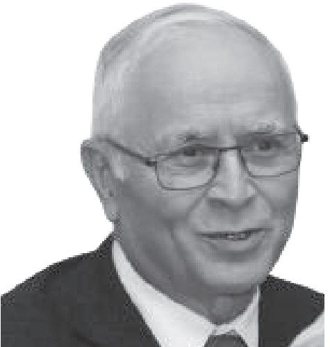
ፕሮግራም መሥሪያ ቤቅ

በአፍሪካ 250 ሚሊዮን ህጻናት የትምህርት ዕድል አግኝተዋል። ይህ ዕድል የተሰጠው በአፍሪካ ህብረት የትምህርት፣ ሳይንስ፣ ቴክኖሎጂ እና ፈጠራ ኮሚሽን ፕሮግራም መሰረት ነው።