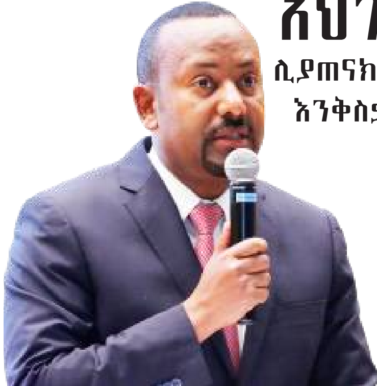
ጠቅላይ ሚኒስትር ዶክተር ዐቢይ ስሕመድ

ሰኞ 82ኛ ዓመት ቀጥር 163 የካቲት 13 ቀን 2015 ዓ.ም ምጋ 10.00 ብዕራችን ለኢትዮጵያ ህዳሴ ይተጋል!