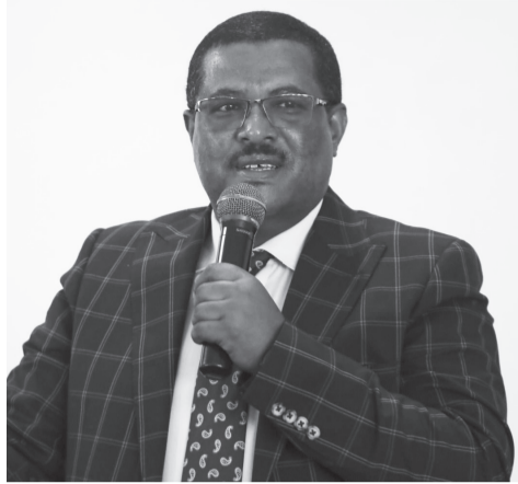
አት ንጉሱ ጥላሁን