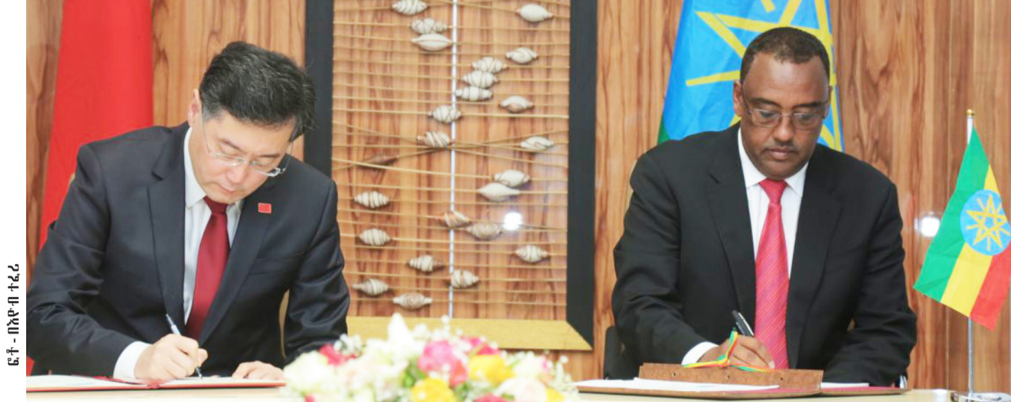
ፎቶ - በአዲስ ተራራ