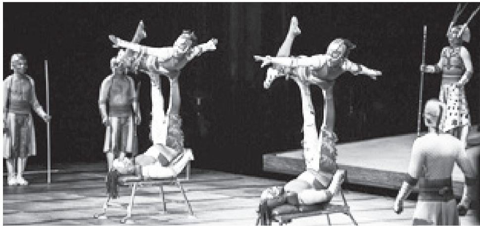
አዲስ አፍሪካ የሰርከስ ማህበር በተለያዩ ዓለም አቀፍ መድረኮች ኢትዮጵያን እየስተዋወቀ ይገኛል።