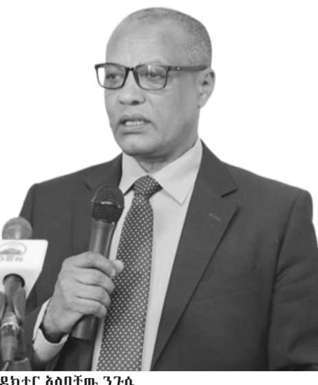
ዶክተር አለባቸው ንጉሴ

የኢትዮጵያ ኢንተርፕራይዞች ልማት ባለፉት ስድስት ወራት ባከናወናቸው ሥራዎችም 140 ሺህ 667 ዜጎች የሥራ እድል እንደፈጠረም ዋና ዳይሬክተሩ ገልጸዋል።