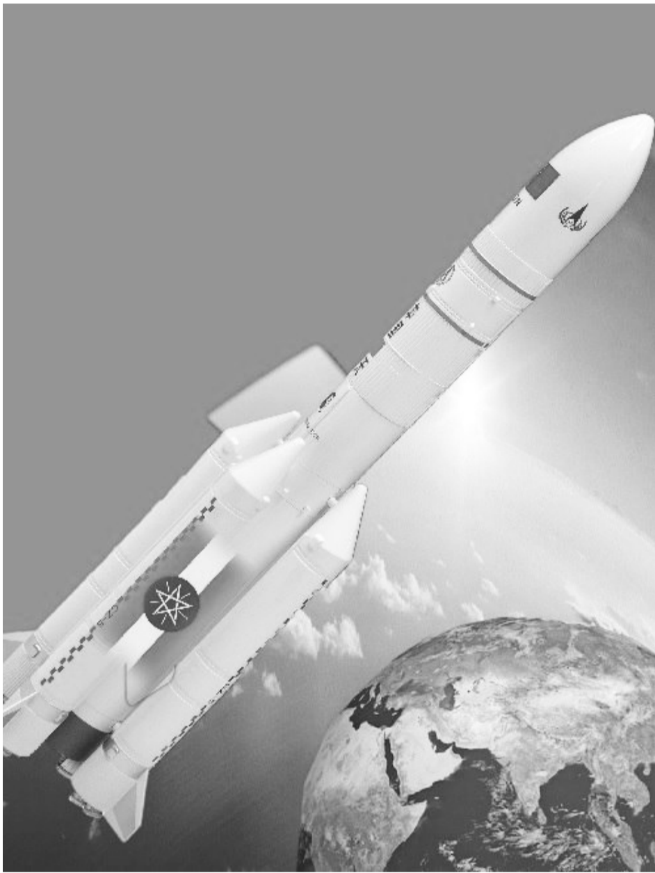
በሳተላይት አማካይነት ከሦስት ሺ በላይ የመረጃ ቅጠብቶች ተደርጓል።

ሳተላይቷ በኢትዮጵያ ሕዝብ ሳይንስ ስራ ስለፈጠረችው መነቃቃት፣ ስለሰጠችው መረጃ፣ ሳተላይትን ዲዛይን በማድረግ፣ በመፈተሽ፣ በመቆጣጠርና በመጠገን የቴክኖሎጂ አቅም በመፍጠር ረገድ ያበረከተችው አስተዋጽኦ ከፍተኛ መሆኑን አቶ አብዱሳል ጠቅሰው፣ ሳተላይትን ከመጠቀሙ አገራት ጎራ እንድንሰለፍ በማድረግ በገጽታ ግንባታ ላይ ስለደረገችው በጎ አስተዋጽኦም ተናግረዋል። በተውልዱ ላይ ስለጠራቸው ተስፋና ስለፈጠረችው መነሳሳት እንዲሁም የ«ETRSS-2»