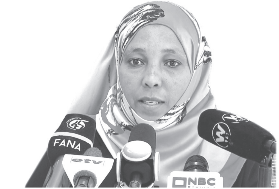
የግብርና ኢንቨስትመንትና ግብዓት ዘርፍ ሚኒስትር ዶኔታ ሶፊያ ካሳ

በባለፈው ዓመት የማዳበሪያ ዋጋ ከነበረበት ከአንድ ሺህ 800 ብር እስከ ሁለት ሺህ 200 ብር ጭማሪ አሳይቶ በ4 ሺህ 600 ብር ዋጋ ለአርሶ አደሩ በመቅረቡ ትልቅ መደናገጥ መፍጠሩን አውስተው፤