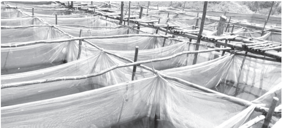
ዘመናዊ የዓሣ ማራቢያ ማዕከል