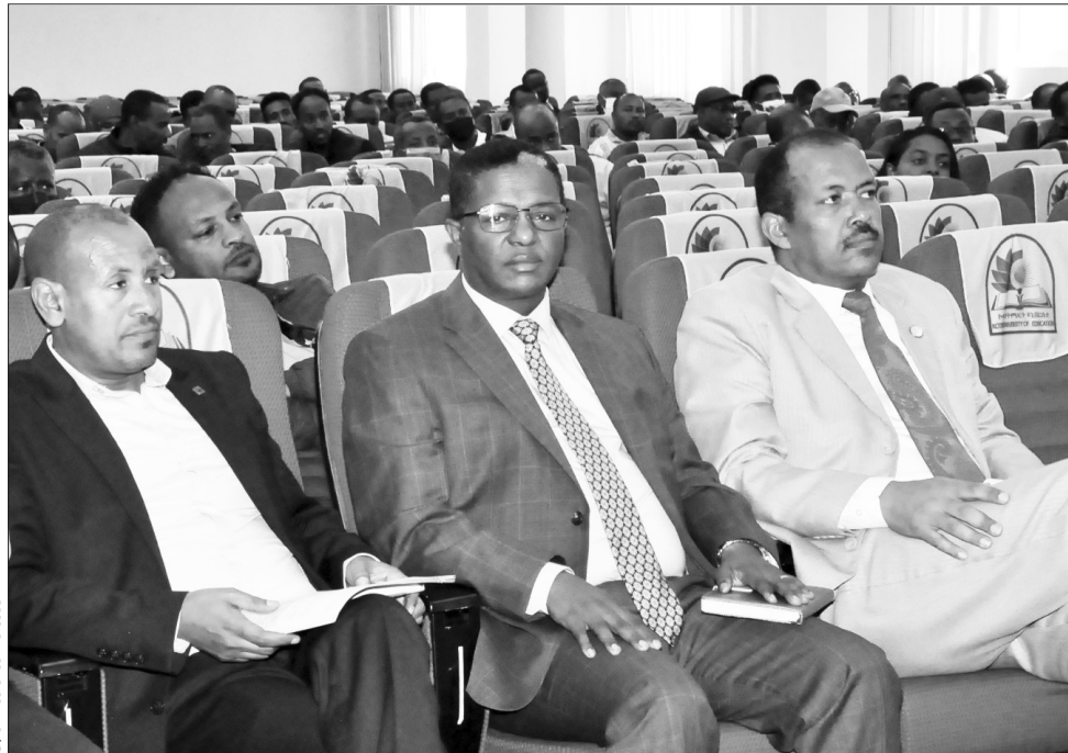
የውይይት መድረኩ በኩብዬ የኔቨርሲቲ በተካሄደበት ወቅት

«ሰው የባርነት ምቹትን ከመረጠ ለውሻ አሟሟት መፈረሙ የተረጋገጠ ነገር ነው። በባርነት ምቹት የኖረ ኑሮው ያሳማ ነው ሞቱም የውሻ። ተንገላቶ ያለው ደግሞ ኑሮው የጀግና ሲሆን፤ ሞቱ የሰማዕት ነው።» የሚሉት ፕሮግራም ምንጭታለው፤ የሰው ልጅ የተፈጠረው እንዲያስብ ነው። ነገር ግን ማሰብን በሆዱ ተከቶ ከኖረ ሁሉን ነገር ይሸጣል። ፈጣሪውን ጨምሮ።