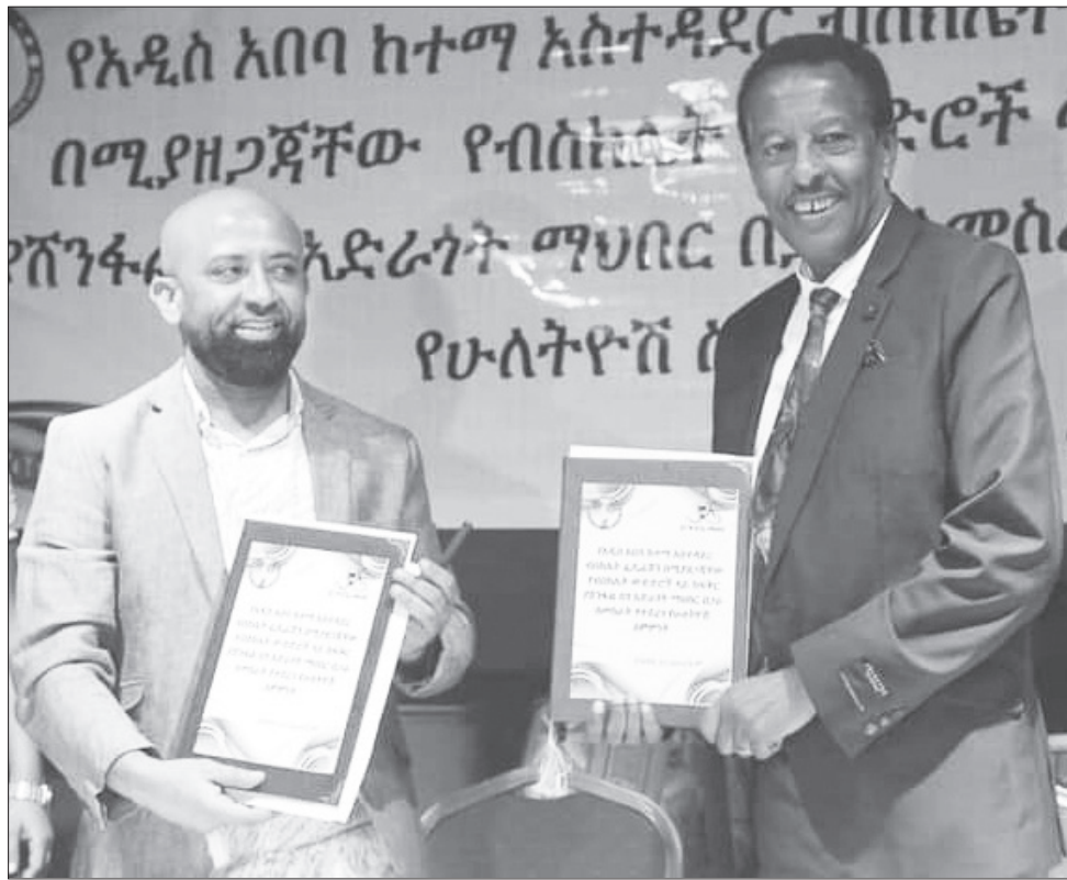
ስምምነቱ ለከተማዋ የብስክሌት ስፖርትና ስታዲየም ስራዎች ወሳኝ በመሆኑ ተጠቅሟል።

ይሁን እንጂ የአዲስ አበባ ብስክሌት ፌዴሬሽን ብስክሌቱን በከፍተኛ በጀት እያንቀሳቀሱ ከሚገኙት የትግራይና የአማራ ክልሎች አንጻር ይህ ነው የሚባል ጠንካራ የበጀት ድጋፍ የለውም። በዚህ ረገድ