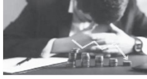
ቢሊዮን ዶላር በመክሰር ቀዳሚ ሲሆኑ የቻይና ባለጸጋዎች ደግሞ 620 ቢሊዮን ዶላር ኪሳራ በማስመዘገብ በሁለተኛነት መቀመጣቸው ተጠቅሷል።

ከዩክሬን ጋር ጦርነት ውስጥ ያለችው ሩሲያ ደግሞ በባለሀብቶቿ ላይ በተጣለባት ማዕቀብ ምክንያት 150 ቢሊዮን ዶላር ኪሳራ ማስመዘገቧ ተገልጿል። ይህ በዚህ አንዳለ ግን የአስያ ባለሀብቶች በአንጻራዊነት የተጠናቀቀው 2022 ዓመት