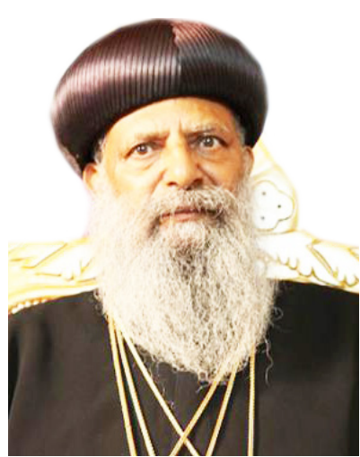
አቡነ ማቴዎስ ቀዳማዊ ፓትሪያርክ