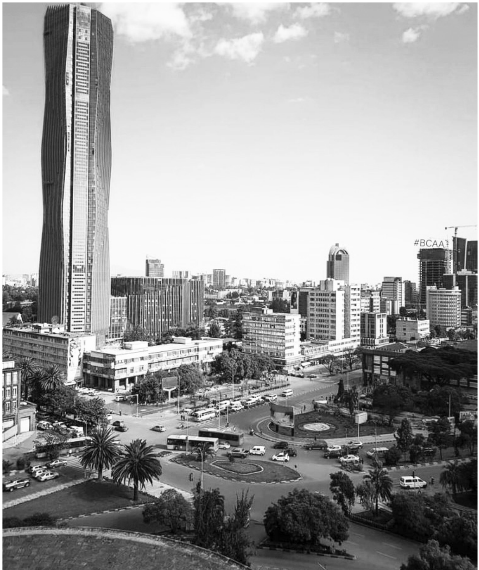
አገልግሎት ለመስጠት የማይጋብዙ ናቸው።

ምቹ የሆኑ ህንጻዎችን መከራየት ብዙ ወጪ ስለሚያስወጣ አብዛኛዎቹ ተቋማት ወጪ ለመቀነስ በሚል ምቹ ያልሆኑ ህንጻዎች ተከራይተው ለመስራት እንደሚገደዱም አመልክተዋል። አብዛኛዎቹ ህንጻዎች ለተገልጋዩም ለአገልጋዩም አስቸጋሪና ቀልጣፋና ፈጣን