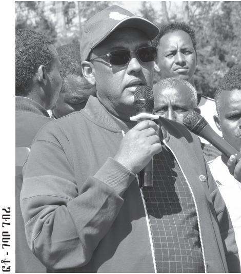
የውጭ ጉዳይ ሚኒስትር ደመቀ መኮንን