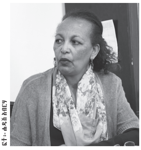
ፍት - ሕፃናት ክብር

ልጆች ሲታሙ የሚታሙት፤ ሲጎላቁሉ የሚጎላቁሉ ወላጅ ነው። ህመም በበረታ ጊዜ፤ ያኔ ቤትን ጭንቅ ወርሶት፤ ታዘን ውድሃ ይረጋገጥታል። ህመም በተለይ ደግሞ አሁን የምናወራለት ህመም ምህረትን እያውቅም። በክፍለዘመኑ የሰው ልጅን ሕይወት በመቅጠፍ የሚቀድመው የለም። የብዙዎችን ሕይወት ጨካኝ ጎራዴውን ከአፎቱ መዝዞ እየሰደደ አልፎት ወደ ጥልቁ ልኳል። የበሽታው ትልቁ ክፋት