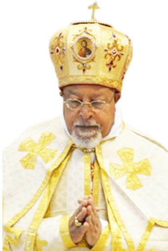
ብጹኅ ካርዲናል አቡነ ብርሃኑኒየሱስ