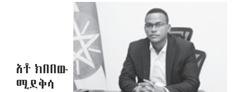
ክቶ ከበበው ሚደቅሳ