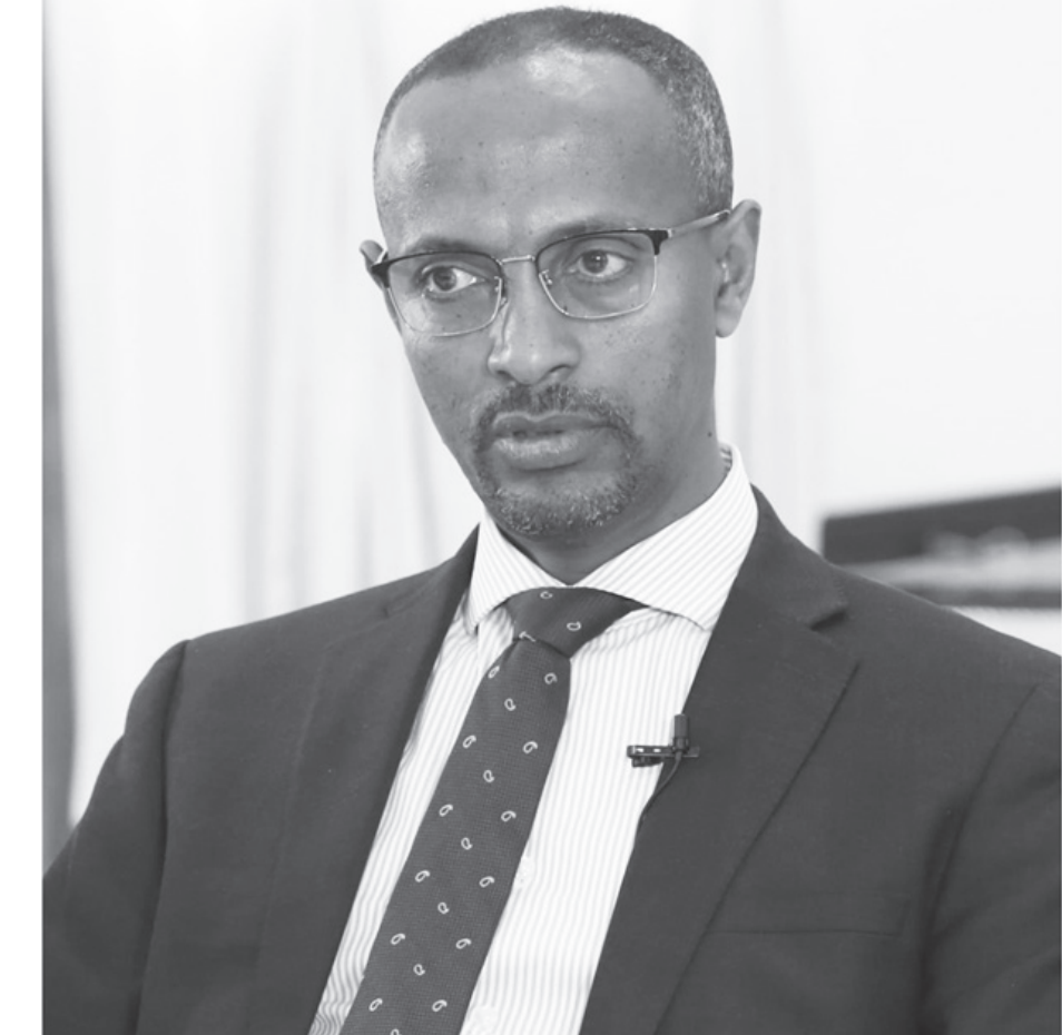
የኢንዱስትሪ ሚኒስትሩ መላኩ አለበል

ዘርፉ ትልልቅ ግቦችን ማሳካት የሚችለው በጠንካራ የምርምርና የጥናት ሥራዎች መደገፍ ሲቻል መሆኑን