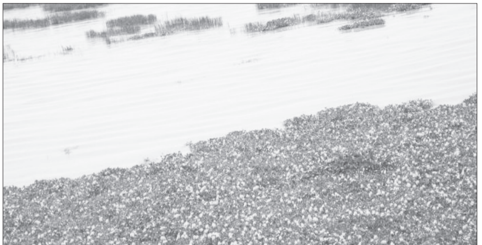
እንጦጭን ስመከላከል ብዙ ጥረት ቢደረግም እስካሁን ማጥፋት አልተቻለም

ከግብርና ስራው ጋር ተያይዞ አርሶአደሩ የበጋ መስኖ እንቅስቃሴ ላይ በመግባቱ ከማህበረሰቡ በኩል