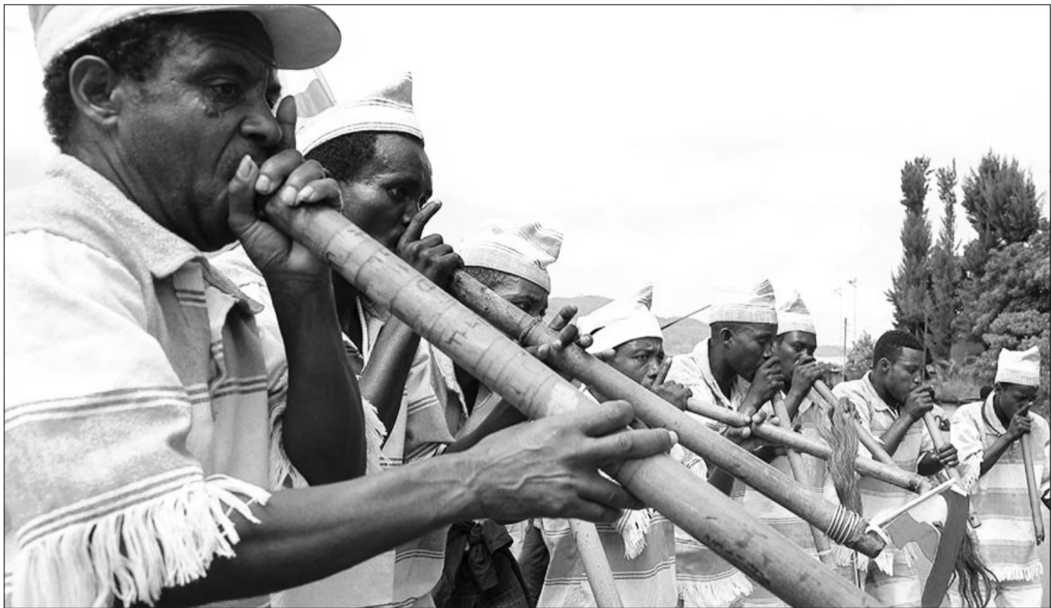
የፊል ጨዋታ ከጥምቀት ሰዎች ጀምሮ ባሉት ሳምንታት ይከናወናል።

እነዚህ 24 የፊል የሙዚቃ ድምጾች በሦስት ዋና ዋና ደረጃዎች (በባለሙያዎች ቋንቋ ቤዞች) ይመደባሉ። ይህም ካሳንታ (ወፍራም ድምጽ) ፣ አታንትያ (መካከለኛ ድምጽ) እና ፍት ፍታ (ቀጫጭን ድምጽ) በመባል ይመደባሉ። መሳሪያዎቹም በዚህ መልክ የተዘጋጁ ናቸው። በጨዋታ ጊዜ እያንዳንዱ መሳሪያ የሚያወጣው ድምጽ ቀዳሚና ተከታይ በመሆን