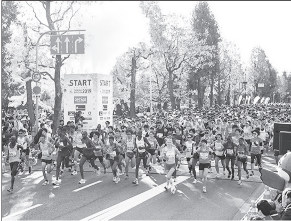
የፊታችን እሁድ በሥላሳ የሚካሄደው የሴቶች ማራቶን ኢትዮጵያውያን አትሌቶች እንደሚያሸንፉ ይጠበቃል።

ከቀናት በኋላ የሚካሄደው ይህ ውድድር ኢትዮጵያዊያን እና ኬንያዊያን የማራቶን አትሌቶች የሚካፈሉበት እንደመሆኑም ከፍተኛ ፍክክር ሊካሄድበትና የቦታው ፈጣን ሰዓት ሊመዘገቡበት