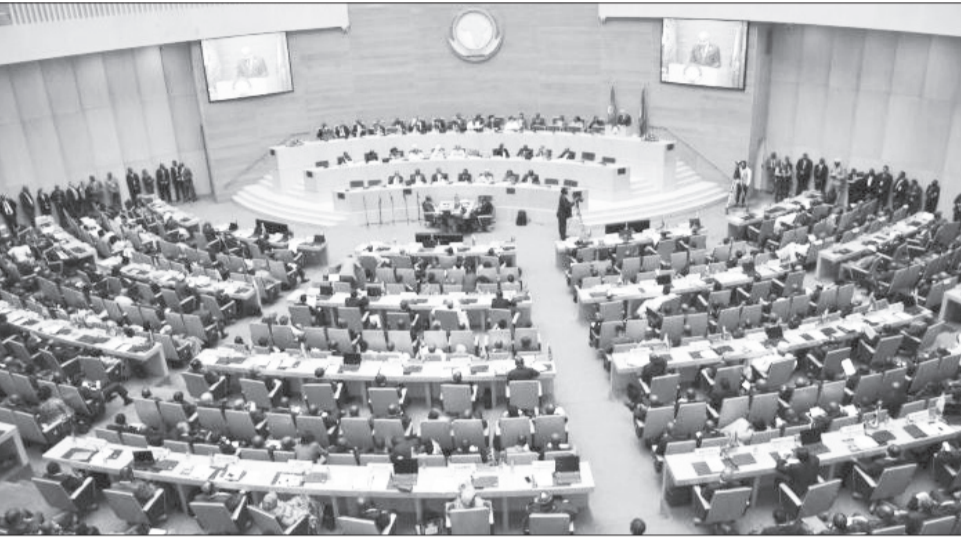
36ኛው የአፍሪካ ህብረት የመሪዎች ጉባኤ በቀጣዩ ወር በአዲስ አበባ ይካሄዳል

የህብረቱን ጉባኤ አምና ውጤታማ በሆነ መልኩ ማካሄድ መቻሉን አስታውሰው፤ የነበሩ ጉድለቶችን በማሻሻል በተሻለ ስኬት ዘንድ ማስተናገድ እንደሚገባ አመለካከተዋል። ለስኬቱም ባለድርሻ ተቋማት በተናበበ