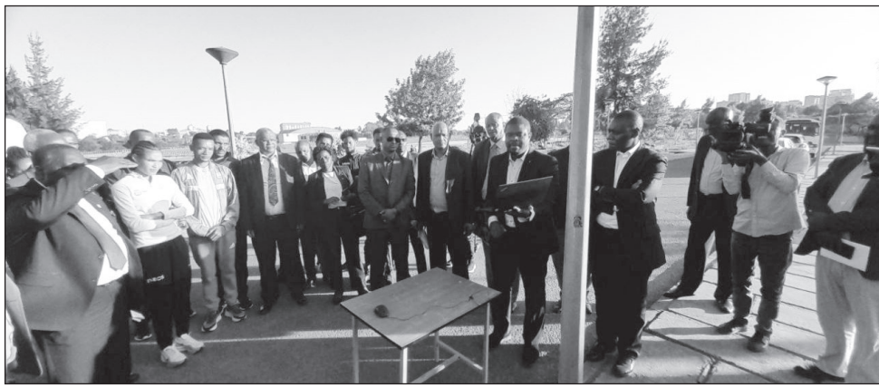
ቴክኖሎጂው ስፖርቱን ታላቢ ስድርገ ይሰራ እንጂ ስከተማውም ከፍተኛ አስተዋፅኦ እንደሚያበረክት ተጠቁሟል።

የአካባቢ ተጽእኖዎች በስፖርት እንቅስቃሴዎች ላይ በተለያዩ መንገድ አምንታዊና አሉታዊ አሻራ ሊያሳርፉ እንደሚችሉ ሳይንሳዊ ግኝቶች በተደጋጋሚ አረጋግጠዋል። በተለይም ከአተነፋፊ ስርአት ጋር በአጅጉ ቁርኝት ያላቸው እንደ አትሌቲክስ ያሉ ስፖርቶች በተበከለ አየርና ከፍተኛ ሙቀት የመታወክ እድላቸው ሰፊ በመሆኑ ልምዳዊ የውድድሮችን በተስማሚ የአየር ንብረት ማድረግ ግዴታ እየሆነ መጥቷል። ያደጉት አገራት ይህን በሰው ሰራሽና በተፈጥሮ ምክንያት የሚመጣን ፈተና ለመወጣት ቴክኖሎጂዎችን እንደ አንድ አማራጭ መጠቀም ከጀመሩ ሰነብተዋል። በኢትዮጵያም በተለይም አትሌቶችን አሰልጣኞች ቴክኖሎጂዎችን የመጠቀሙ እድል ባይኖራቸውም ምቹ የሆነ የአየር ጸባይ ያለበትን አካባቢ እየፈለጉ ከከተማ ውጪ ልምዳዊ ስራ ማየት የተለመደ ነው።