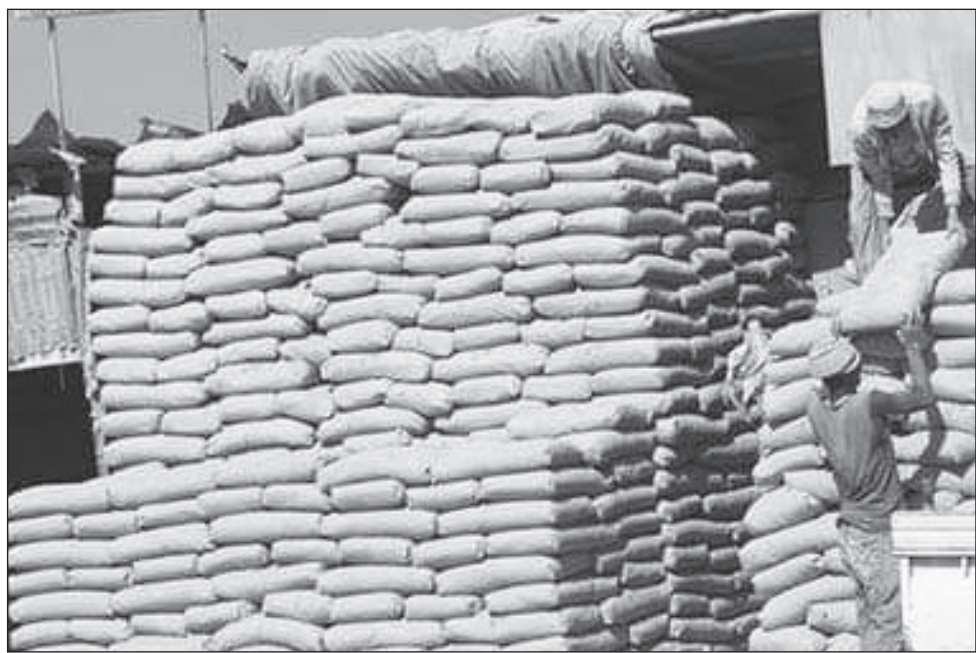
የሲሚንት ገብይትና ስርጭት መመሪያው በገብይት ላይ ሰውጥ እያመጣ ቢሆንም፣ የአቅርቦት ችግር እንዳለ እየተጠቀሰ ነው።

በቅርቡ መንግሥት ሲሚንት በነጻ ገበያ እንዲመራ በሚል ያስተላለፈውን መመሪያ ተከትሎ በሦስት