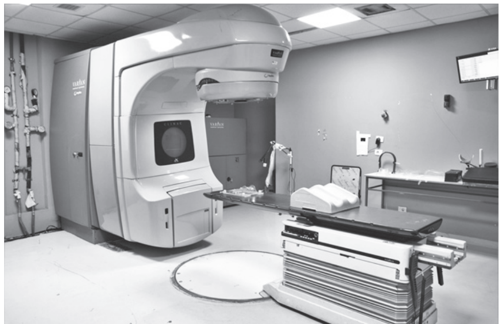
ዘመናዊ የካንሰር መመርመሪያ ማሽን