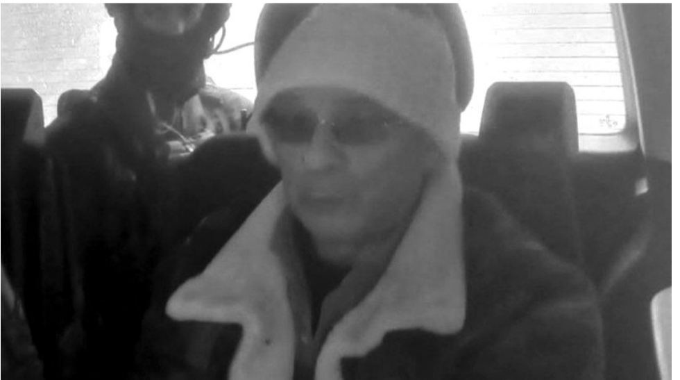
ማቴም ማሲኒ ዲናር

ዲሞክራቲክ ኮንጎ ውስጥ በሰንበት የጸሎት ሥነ-ሥርዓት ላይ በነበሩ ሰዎች ላይ በተፈጸመ የቡንብ ትቃት 10 ሰዎች ሲገደሉ 39 ደግሞ ቆሰለዋል። የአገሪቱ መንግሥት ካሲንዲ ተብሎ በሚጠራው እና በምሥራቃዊ የኮንጎ ክፍል ውስጥ በሚገኘው ቤተክርስቲያን ላይ የተፈጸመውን የቡንብ ጥቃት ከአይ ኤስ ጋር ግንኙነት ያለውን ቡድን አድርሶታል ሲል ወንጀሏል። በጥቃቱ በቤተክርስቲያኑ የዕሁድ ጸሎትን ሲታደሙ የነበሩ 10 ሰዎች እንደተገደሉ ባለሥልጣናት አስታውቀዋል። ከሚሾች በተጨማሪ 39 ሰዎች ለጉዳት የተዳረጉበትን ይህንን ጥቃት የአገሪቱ ወታደራዊ ተቋም “የሽብር ድርጊት” ነው ሲል የፈረጀው ሲሆን፤ ፈጻሚው ‘አላይድ ዲሞክራቲክ ፎርሰስ’ ወይም ‘ኤዲኤፍ’ ነው ሲል ከሷል። የተጠቀሰው ቡድን በምሥራቃዊ ዲሞክራቲክ ኮንጎ ውስጥ ሰፊ እንቅስቃሴ የሚያደርግ የአማጺ ቡድን መሆኑን ቢቢሲ ዘግቧል። የኮንጎ መንግሥት ባወጣው መግለጫ በ‘ኤዲኤፍ’ የተፈጸመ ነው ያለውን የቡንብ ጥቃት “አጥብቆ ያወግዛል።” በመግለጫው መንግሥት “በአዚህ አስቀያሚ የሽብር ጥቃት” ቤተሰቦቻቸውን ላጡ ሰዎች የተሰማውን “ጥልቅ ሐዘን” ገልጿል። በዲሞክራቲክ ኮንጎ የተሰማራው የተባበሩት መንግሥታት ድርጅት ተልዕኮ በካሲንዲ የተፈጸመውን “አስገዋሪ” ያለውን ጥቃት አውግዟል። “ይህ የሽብር ጥቃት በዲሞክራቲክ ሪፐብሊክ ኮንጎ ሠራዊት በተለያዩ የጦር ግንባሮች ሸንፈው በደረሰበት ኤዲኤፍ እንደተፈጸመ ግልጽ ነው” ሲል የአገሪቱ መንግሥት ቃል አቀባይ አንዳቱ ሙላሻይ ገልጸዋል። ቃል አቀባይ ጨምረውም ለጥቃቱ መደበኛ ያልሆነ ቡንብ ጥቃም ላይ መዋሉንም ተናግረዋል። ካሲንዲ የኤዲኤፍ እንቅስቃሴ ጠንክሮ ከሚታይበት ቢረ ከተባለ አካባቢ የ8 ኪሎ ሜትር ርቀት ያለው ነው። ባለፈው ወር የሀገሪቱ የተመድ ተወካይ በጸጥታው ምክር ቤት ቀርበው የጸጥታ ችግር ከዲኤር ኮንጎ ዋነኛ ፈተናዎች መካከል አንዱ ነው። በአውሮፓውያን 1990ዎቹ ብቅ ያለው ኤዲኤፍ የተፈጠረው በኢጋንዳ በተፈጠረ ውስጣዊ ቅሬታ የተፈጠረ ነው። ሆኖም በዲኤር ኮንጎ እንደአዲስ መታየት ከጀመረ በኋላ በኮንጎ ተከታታይ ጥቃት እየፈጸመ አለምአቀፋዊ የጀንዲሰቶች ገጽታ እየያዘ ይገኛል።