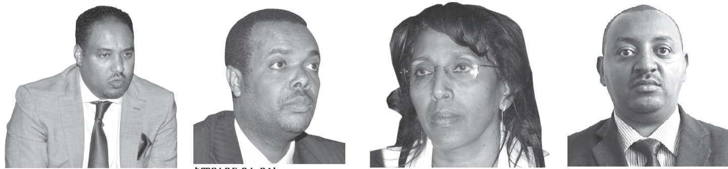
አምባሳደር ምስጋኑ አርጋ አምባሳደር ደሴ ዳልኪ አምባሳደር ደሚቱ ሐምቢሳ አምባሳደር ኢንጂነር መላኩ አዘዘው