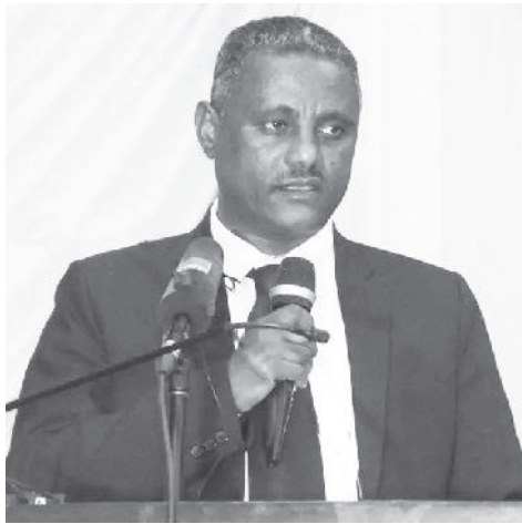
ዶክተር ፀጋ ጥበብ