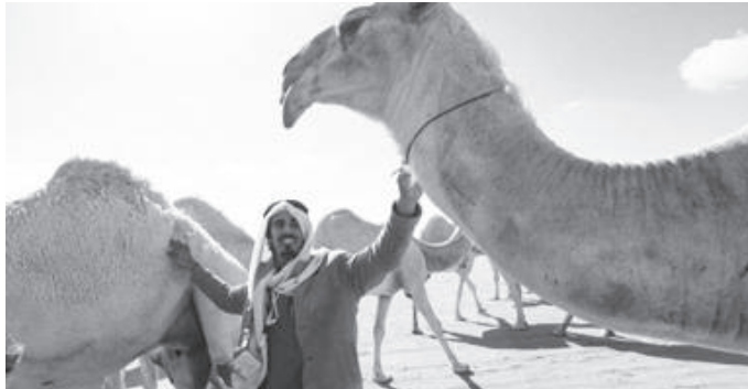
የሳሎንታ “የባር ማርክሶቶ” ስማቸውን የሚጠቀሙትን ትዕዛዝ በአገሪቱ መሰየብ ይችላሉ ተብሏል

በግሪክ አርባዎች “አልጌዳ” እየተባለ የሚጠራው ልዩ ቋንቋ ባለፈው ወር በመንግሥታዊ ድርጅት የሳይንስ እና ባህል ተቋም የኔስቲ በዓለም ቅርስነት ተመዝግቧል ሲል አልጌዳን ዘግቧል።