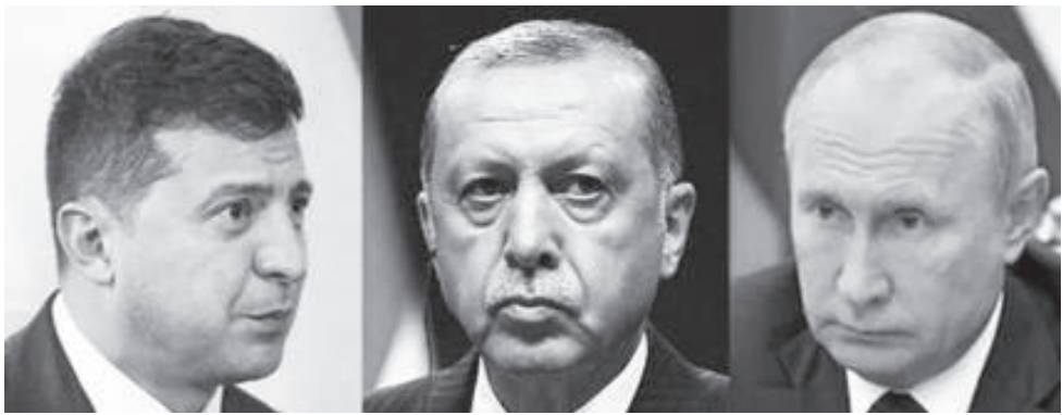
ፕሬዚዳንት ኤርዳን ከዩኔስኮ ስታፊው ጋር በስልክ ተወያይተዋል

ከ200 አመት በላይ እድሜ እንዳሰቆጠረ የሚገርሰት “አልጌዳ” በዩኔስኮ መመዝገብ ቋንቋው እንዲጠበቅና እንዲስፋፋ ያግዛል ተብሏል።