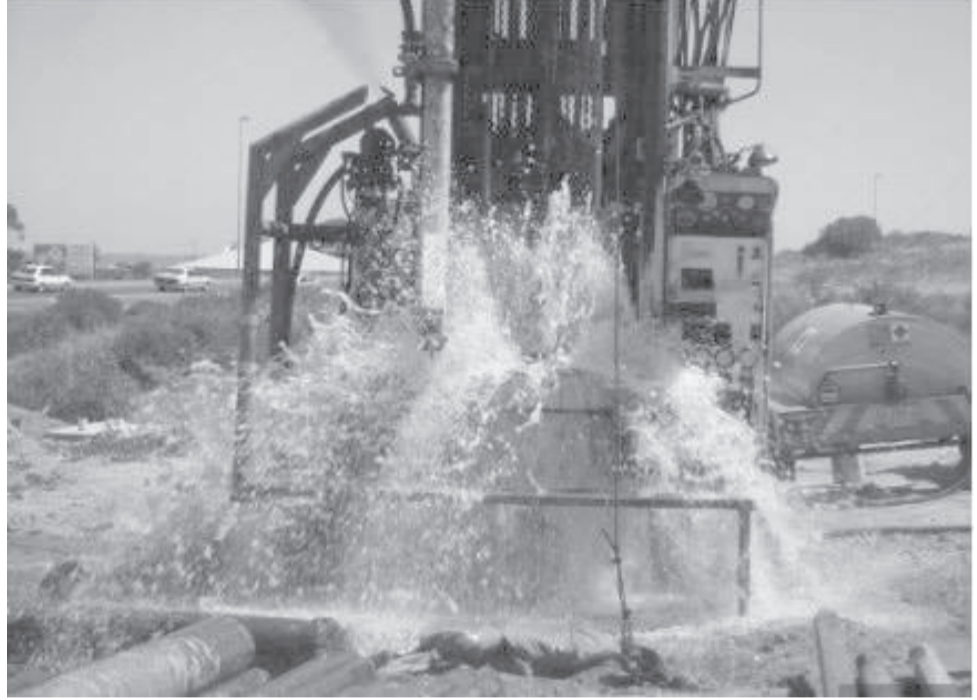
ይገኛል። የቁፋሮ ሥራው ከ300 ሜትር በላይ በመድረሱ ሂደቱ ጥናድ ደረጃ ላይ ይገኛል ሲሉ አስረድተዋል።

የፌዴራል መንግሥት በበኩሉ በአካባቢዎቹ ባለ 500 ሜትር ጥቅል የውሃ ጉድጓድ ቁፋሮ እያከናወነ