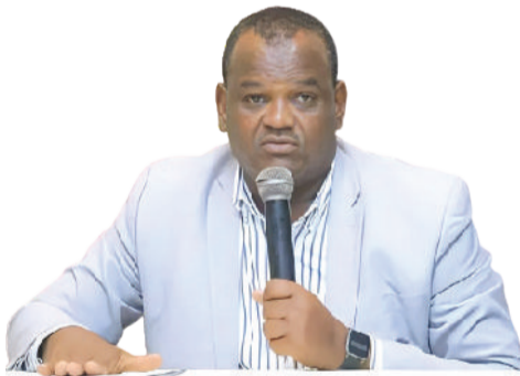
ክቶ ስላዩን ስላዩ

አዲስ አበባ፡- በክልሉ ለማልማት ከታቀደው 208ሺህ ሄክታር መሬት እስካሁን ድረስ 80 በመቶ በዘር መሸፈኑን የደቡብ ብሔሮች፣ ብሔረሰቦችና ሕዝቦች ክልል ግብርና ቢሮ አስታወቀ። 20ሺህ ሔክታር መሬትን በበጋ ስንዴ ለማልማት ከ748ሺህ ኩንታል በላይ ምርት ለመሰብሰብ እየተሠራ እንደሆነም ተገልጿል።