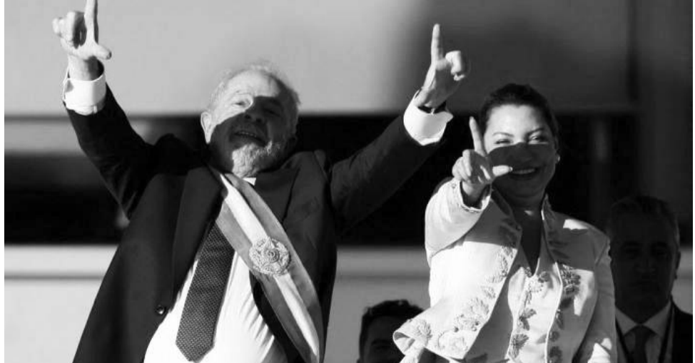
ሉላ ከዓለም ከፍተኛ የምግብ አምራቾች ልዕስ ኃይልነት መለወጥ እንደሚፈልጉ መናገራቸውን መካከል አንዱ የሆነችውን ብራዚልን ወደ አረንጓዴ አልዕይን ዘግቧል።

ምንም እንኳን የቦልሶናዊ የፍሎሪዳ ጉዞ ብራዚል ውስጥ ካሉ ከማንኛውም የህግ አደጋዎች የሚከላከል ቢሆንም፤ ከአረ-ዲሞክራሲያዊ ንግግራቸው እና ከወረርሽኝ አያያዝ ጋር በተያያዘ የፕሬዝዳንትነት ያለመከሰስ ሙብታቸውን ካጡ በኋላ የመከሰስ አደጋ ተጋርጦባቸዋል ተብሏል። የሉላ የመንግስት እቅድ ከቦልሶናዊ የአራት ዓመታት የስልጣን ዘመን ጋር ፍጹም ይለያል መባሉን ሮይተርስ ዘግቧል።