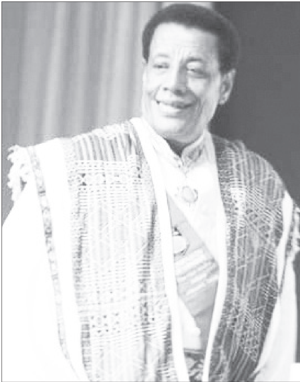
የዓለም ሎሬት ሜትር አርቲስት አፈወርቅ ተክሌ

በቅርጽ ቅርጽ እና በኪነ ህንጻ ጥናቶች ላይ በመስራት ተመርቀዋል። ትምህርታቸውን አጠናቀው ወደ ኢትዮጵያ እንደተመለሱ በተለያዩ ግዛቶች በመዘዋወር በአንዳንድ ቦታም እስከ ሦስት ወራት በመቀመጥ የኢትዮጵያን ታሪክ እና የብሔር ብሔረሰቦችን ባህልና ወግ ሲያጠኑ ቆይተዋል።