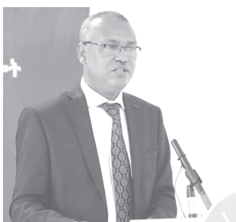
የመላ ሕዝባችን ተጠቃሚነት የሚረጋገጠው ከዘላቂ ሰላም ፣ ጎብኝተው ለሰፊው አጠቃላይ ይቀጥላል።

ይህን እኩይ ድርጊታቸውን የትምህርት ተቋማትን ማዕከል ባደረገ አግባብ ወደ አዲስ አበባም ለማስፋፋት ከሰሞኑ አልመው እየሠሩ እንደሚገኙ ጠቁመው፤ የእነዚህ የሽብርና የጽንፈኝነት ኃይሎች ዋና ዓላማ መንግሥት በሌዎች ላይ የከፈተው ዘመቻና በሰሜን የተጀመረው የሰላም ጥረት ከዳር እንዲታይ ለማድረግ ያለመ ነው ብለዋል ሚኒስትሩ።