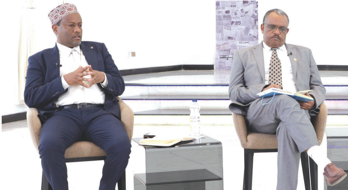
ሺህ ስብዕና ስራ ስራ

እሁድ 82ኛ ዓመት ቁጥር 092 ታኅሣሥ 2 ቀን 2015 ዓ.ም ጥጋ 10.00 ብዕራችን ለኢትዮጵያ ህዳሴ ይተጋል!