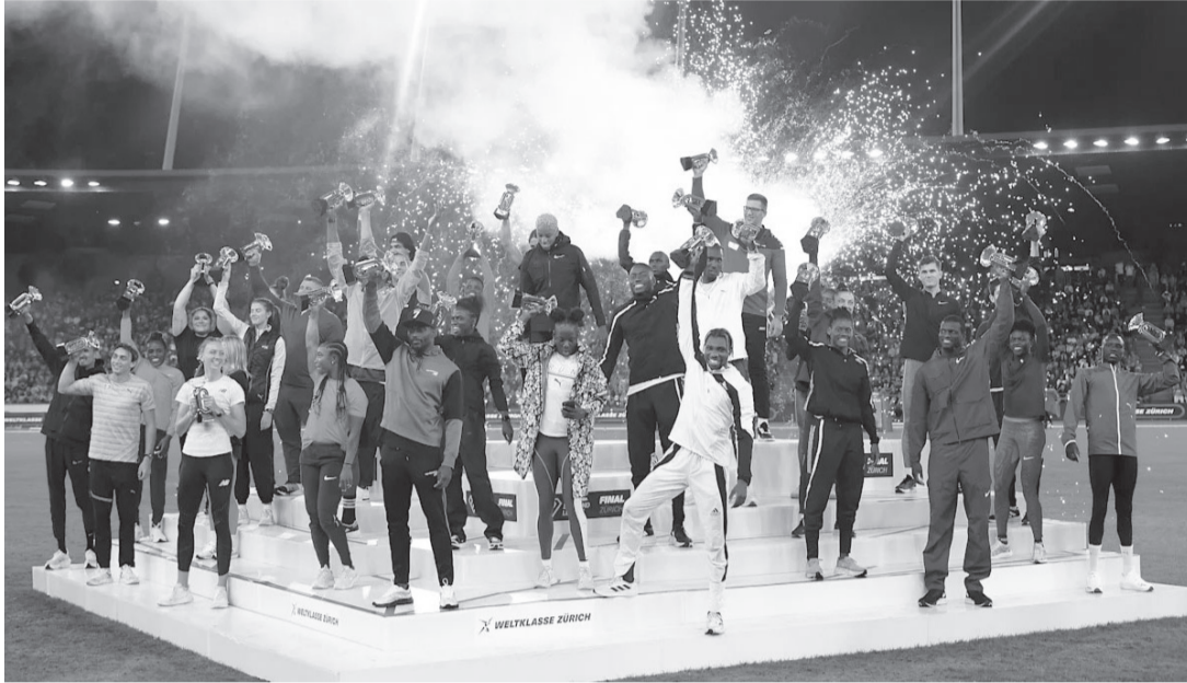
የ2023 ዳይመንድ ሊግ ውድድር የዳይመንድ ሊግ ታላቅ አትሌቶች አንደኛው ደብዳቤ

የዳይመንድ ሊግ አትሌቲክስ ከሚያዘጋጅባቸው ትልልቅ ዓመታዊ ውድድሮች መካከል አንዱ በመምሩ ሩጫዎችና በሚዳ ተግባራት የውድድር ዓይነቶችን የዳይመንድ ሊግ የሚፈጸሙበት ዳይመንድ ሊግ ነው። እነዚህ ሊግ ውድድርን ተክቶ እነዚህ ከ2010 ጀምሮ እየተከናወነ የሚገኘው ይህ ውድድር ዙሪያ ያሉት ሲሆን፤ በተለያዩ የዳይመንድ ሊግ በመዘዋወር ይካሄዳል። አትሌቲክስ ወጣትና በስፖርቱ ትልቅ ስኬት ላይ አትሌቶችን ጨምሮ በመላው ዓለም አትሌቶች የሚከፈሉበት የዳይመንድ ሊግ የተለያዩ የዳይመንድ ክብረት ለሰጠው ሰዓቶች የሚመዘገቡበትና ከፍተኛ ፍህረት የሚስተዋልበት በመሆኑ ትልቅ ይሰጠዋል።