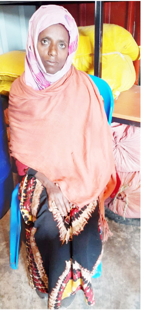
የታሰበላቸው ተሳካ። ባለቁጠማዋ ከአንድ ቦታ በትራቆች ከዘበኛው ቤት አጠገብ እንዲያድሩ ተወሰነ። ሁለቱም ሀሰቡን በምስጋና ተቀብለው የንዳናውን ጥግ ለቀቁ። ከተዘጋጀላቸው ስፍራ አይደሩም የዕጣን ቁጤማ ስራቸውን ቀጠሉ።

አንድ ቀን ግን ከዚህ ያልተመቸ ህይወት የሚታደጉ በጎ ዓይኖች አረፉት። አንዲት ሴት ድንገት ቀርባ አሷንና ቁጤማ ሻጭዋን ሴት አዋየቻቸው። እነሱ ውጭ ከሚያድሩ በእሷ ምግብ አካባቢ ቢጠጉ እንደሚሻል ነገሯቸው። ሴትዬዋ ለበትራቆች ስሜት አልከበደችም። ያለችውን ስምታ ፈጥሶ ተሰማማች።