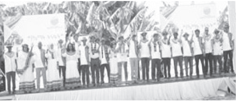
ጠቅላይ ሚኒስትር ዐቢይ አሕመድ የሌማት ትሩፋት ፕሮግራም ባስጀመሩበት ወቅት

አንጻር የኛ በጣም አነስተኛ በመሆኑ አሁን ያለውን ምርት በትንሹ በአምስት እጥፍ መጨመር ይጠይቃል። በሀገራችን 7 ሚሊዮን የሚጠጋ የጎብ መንጋ ይገኛል። ይህም ከብዙ አፍሪካ ሀገራት በቁጥር የሚበልጥ ቢሆንም 96 በመቶ በባህላዊ ቀፎ የሚነባ በመሆኑ ምርቱ ዝቅተኛ ነው። በአመት 13 ሺህ ቶን ማር ቢመረትም ካለን ንብ መንጋ ቁጥር አንጻር በቂ አይደለም። የእንስሳት ዘርፉ ለብዙ አመታት ትኩረት ተነፍሶ ቢቆይም ከአራት አመታት ወዲህ ግን ግብርና ሚኒስቴር ዘርፉን ተጠትቦው ከያዙት ችግሮች አላቆ የእንስሳት ምርትና ምርታማነትን ለማሳደግ በትኩረት እየሠራ ይገኛል። የግብርናና የገጠር ልማት ፖሊሲን በማሻሻል የ10 ዓመት መሪ ዕቅድና ስትራቴጂያዎችን ቀርፆ ወደ ሥራ ገብቷል። ዘመናዊ የግብርና ተከፍሎችን በመጠቀምም አርሶ አደሮችና አርብቶ አደሮች ተጠቃሚ መሆን ጀምረዋል። በተለይ የከብት፣ የዶሮና የማር አርባታን በማዘመን ምርታቸውን በሚፈለገው ደረጃ ማሳደግ ያስፈልጋል። በመሆኑም ሀገራዊ የሌማት ትሩፋት ፕሮግራም ተቀርፆ በሀገር ደረጃ ጥቅምት 24 ቀን 2015 ዓ.ም በአርባ ምንጭ ከተማ በከብር አፌዴሪ ጠቅላይ ሚኒስትር ዐቢይ አሕመድ