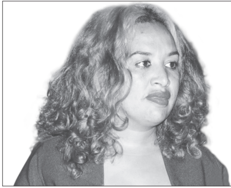
ወይዘሪት ሓዳስ ኪዳ