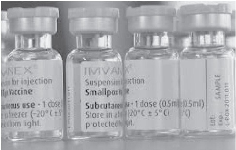
የዝንጀሮ ፈንጣጣ ክትባት