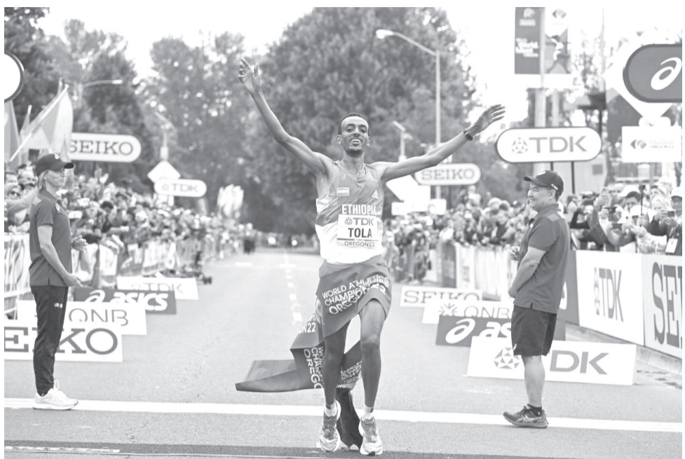
የዓለም ቻምፒዮን አትሌት ታምራት ቶላ በቫሌንሲያ ማራቶን ፈጣን ሰዓት ያስመዘገበው ተብሎ ይጠበቃል።

በተመሳሳይ በሴቶች መካከል በሚካሄደው ውድድርም ኢትዮጵያዊት የ10ሺ ሜትር የዓለም ቻምፒዮን በርቀቱ ለመጀመሪያ ጊዜ እንደምትወዳደር ቀደም ብሎ ተዘግቧል። በ5 ሺ እና 10ሺ ሜትር