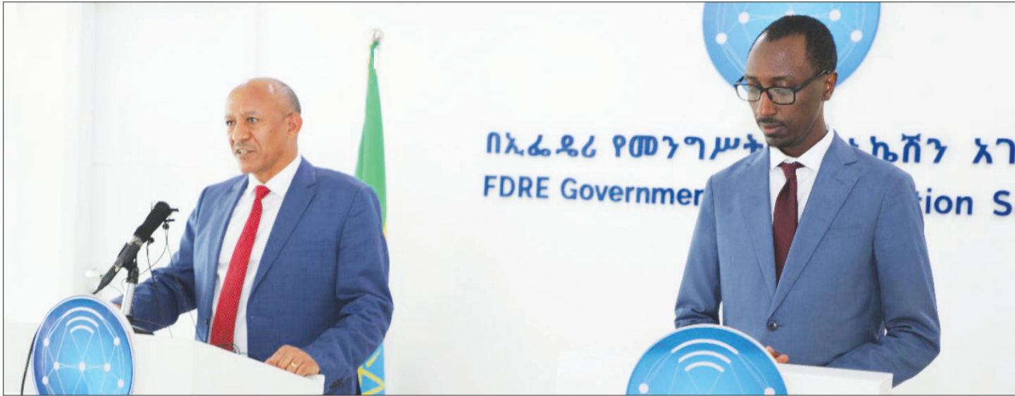
ሸንኮራ ገንቢ ገንቢ እና የክተር ገዢ የንግድ ጠቅላይ ለጠቃሚ