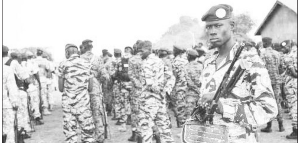
ፕሬዝዳንት ኪር በደቡብ ሱዳን ዋና ከተማ ጁባ ለሚገኘው የቀጣናው ኃይል ተናግረዋል።

“ከሰላማዊ ሰዎች ምንም ነገር አትውሰዱ፤ በምትኩ የዜጎችን ሕይወት ከአደጋ ጠብቁ” ሲሉ