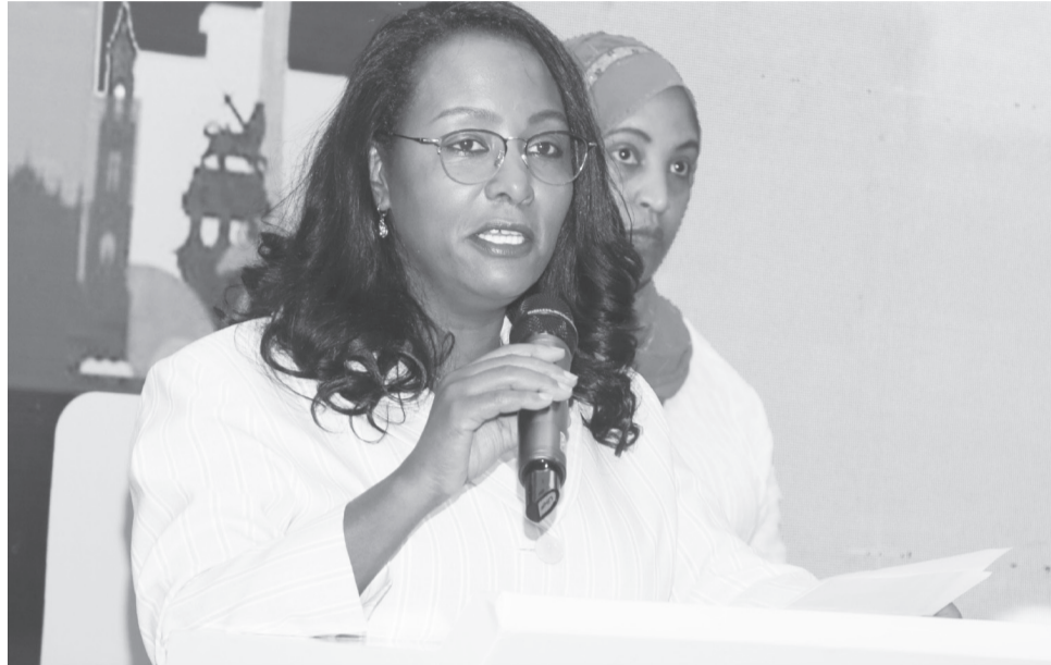
ፎቶ - አዲስ አበባ

«የሰማርት ሲቲ» ጽንሰ ሃሳብ በጥናት ተደግጎ የአተገባበር ሂደቱ ውጤታማ እንዲሆን እየተሰራ መሆኑን