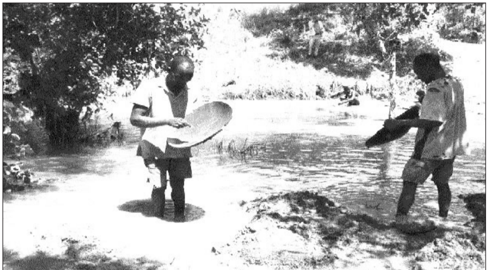
የሚመለከታቸውን ክፍሎች አገጋጣሚና።

እኛም በዚህ ረገድ የጋምቤላ ክልል ማእድን ልማት ቢሮና የጋምቤላ የኔፕሮሲቲ ይህን ኃላፊነታቸውን እንዴት እየተወጡ ስለመሆናቸው የአዚህን አካላት