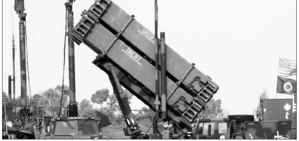
የክሬን ምዕራባውያን የላቁ የአየር መቃወሚያዎችን እንዲለግሱት ስትወተውት ቆይታለች። ‘ፓትሪየት’ የሚባለው ይህ መቃወሚያ አሜሪካ አላኝ ከምትላቸው እጅግ ዘመናዊ የአየር መቃወሚያዎች አንዱ ሲሆን ለዩክሬን የምትሰጠው ግን በተመጠነ መንገድ እንደሚሆን የጦር አዋቂዎች እየገለጹ ይገኛሉ። ለዚህ የአየር መቃወሚያ ሲባል የክሬንውያን ወታደሮች

አዲስ አበባ፡- የጆ ባይደን አስተዳደር እጅግ ዘመናዊ ናቸው የሚባሉትን የአየር መቃወሚያዎች ለዩክሬን እንደሚልክ አስታወቀ። ‘ፓትሪየት’ የሚል ስያሜ ያላቸው እነዚህ ውስብስብና የላቁ የአየር መቃወሚያዎች ለዩክሬን በዚህ ጊዜ ያስፈለጉት ሩሲያ በተከታታይ እየሰነዘረች ያለችውን የአየር ድብደባ ለመግታት ሲሆን ሩሲያ ከቅርብ ወራት ወዲህ በአራን ሠራሽ ‘ካሚካዚ’ ድርጅት እንዲሁም በተወንጫፊ ሚሳኤሎች እየሰነዘረች ባለችው ጥቃት ብዙ የዩክሬን ከተሞችን በጨለማ ከመዋጥ ለመታደግ ጭምር ነው። ሩሲያ በተለይም በዚህ የውርጭ ወራት የኃይል አቅርቦትን የሚያሳልጡ መሠረተ ልማቶች ላይ ለይታ ድብደባ ማድረግ የሚለዩን የክሬንውያን ቤቶች ያለማሞቅ አስቀርታቸዋለች። ባይደን ‘ፓትሪየት’ የአየር መቃወሚያዎች ለዩክሬን እንደሚሰጡ በእነዚህ ሁለት ሦስት ቀናት ውስጥ በይፋ መግለጫ ይሰጣሉ ተብሎ ይጠበቃል።