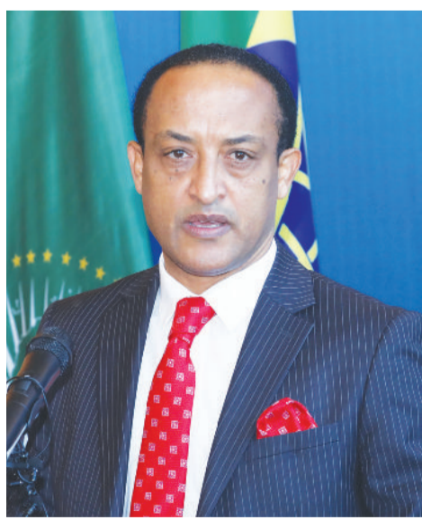
አምባሳደር መለስ አለም

እንደ ቃል አቀባይ ማብራሪያ፣ ጠቅላይ ሚኒስትር ኢትዮጵያ በዓለም ... ወደ ገጽ 4 ዞሯል