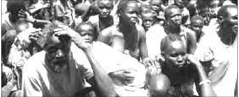
በደቡብ ሱዳን አንዳንድ አካባቢዎች በግጭት፣ በውሃ፣ በእርሻ መሬት እና በሌሎች ሁከቶች ምክንያት የሚነሱ ግጭቶች ይታወቃል።

ባንቡ ቡድኖቹ መካከል ያለውን ውጥረት ማርገብ አልቻሉ ደም መፋሰስ ከግዛቱ አልፎ ደስፋፋ የሚል ስጋት እንዳላቸውም የተናገሩት ኃላፊው፡ “የደቡብ ሱዳን መንግስት በሁከቱ ላይ ፈጣን፣ ጥልቅ እና ገለልተኛ ምርመራ ማካሄድ እና ተጠያቂ የሆኑትን ሁሉ በዓለም አቀፍ ህግ መሰረት ተጠያቂ ማድረግ አለበትም” ሲሉም አክለዋል። የተባበሩት መንግስታት ድርጅት የስደተኞች ኤጀንሲ (የኤን ኤች ሲአር) ግጭቱ በነሐሴ ወር በላይኛው ናይል መንደር ውስጥ ከጀመረው ጦርነት የቀጠለ ሲሆን ከዚያን ጊዜ ጀምሮ ወደ ሌሎች የጀንግሌዬ እና ወደ ሌሎች ግዛቶችና አካባቢዎች መዛመቱ ገልጿል። በግዛቱ የሚገኙ የሐይማኖት አባቶችም በተመሳሳይ በተቀናቃኝ ወጣቶች መካከል የተፈጠረው ግጭት ከቁጥጥር ውጭ እየሆነ መምጣቱን በመግለጽ፣ ተፈናቃዮች ወዳሉባቸው መጠለያ ጣቢያዎችም ጭምር መዛመቱንም አመልክተዋል።