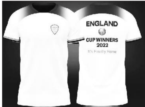
ተነግሯል። ነገር ግን እንግሊዝ በሩብ ፍጻሜው ፍልሚያ በፈረንሳይ 2 ለ 1 ተረታ ከዶሃ የተሰናበተች ሲሆን በ1966

ከሩብ ፍጻሜ ጨዋታዎች አስቀድሞም «እንግሊዝ የ2022 የዓለም ዋንጫ ሻምፒዮን በመጨረሻም ዋንጫው ቤታችንን ገብቷል» የሚል ጽሁፍ ያለባቸውን 18 ሺህ ቲሽርቶች አትሞ የሚያገኘውን ትርፍ ማስላት መጀመሩም