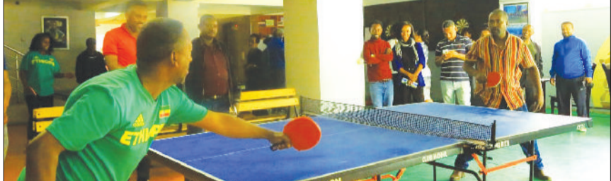
በበረከት ቴኒስ ፎታብ፣ በቡርካ፣ በክረምት፣ በቆይታ፣ በዳርገት፣ በዳርገት እና በጽ/ቤት ጩታዎች በሰራተኞች መካከል ውድድር እየተካሄደ ነው።