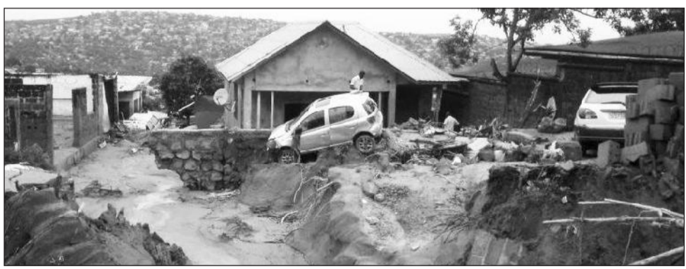
ዲሲ ቆይታቸውን በማሳጠር ወደ አገራቸው ሊመለሱ ይችላሉ ብለዋል። በአፍሪካ አሜሪካ ጉባኤ ላይ እየተሳተፉ የሚገኙት የዲሞክራቲክ ኮንጎ ፕሬዝዳንት፣ ከአሜሪካው አቻቸው ጋር ከተነጋገሩ በኋላ በአደጋው ምክንያት ሐሙስ ዕለት ወደ አገራቸው እንደሚመለሱ በትዊተር

ገጻቸው ላይ አስፍረዋል። በኮንጎ ወንዝ ዳርቻ የምትገኘው ኪንሻሳ በቅርብ ዓመታት ውስጥ የነዋሪዋ ቁጥር በከፍተኛ መጠን የጨመረ ሲሆን አሁን ላይ ከ15 ሚሊዮን በላይ ሕዝብ እየኖረ ይገኛል።