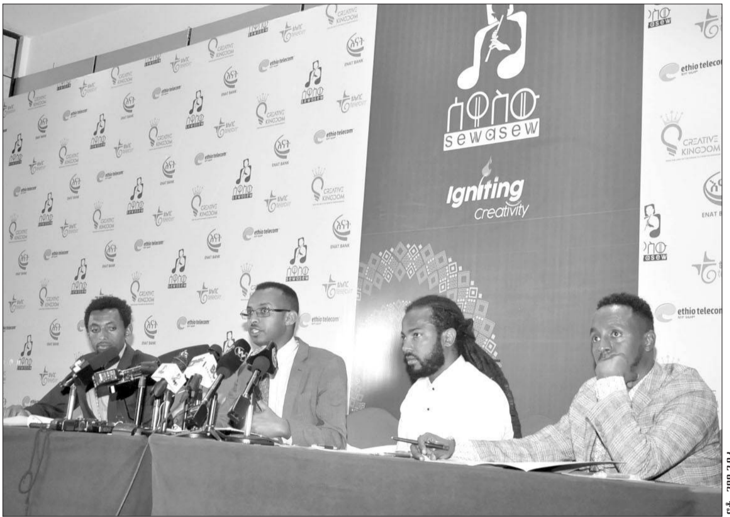
ቴክኖሎጂው በፈጠረው ዕድል በመዘቃ ሥራው ውስጥ ስተሳተፉ ሰዎች ዕውቅና ይሰጣል።

ሰዋሰው መልቲ ሚዲያ መዘቃን በቀላሉ በአንላይን ለመገበያየት የሚያስችል የመተግበሪያ ዘዴ