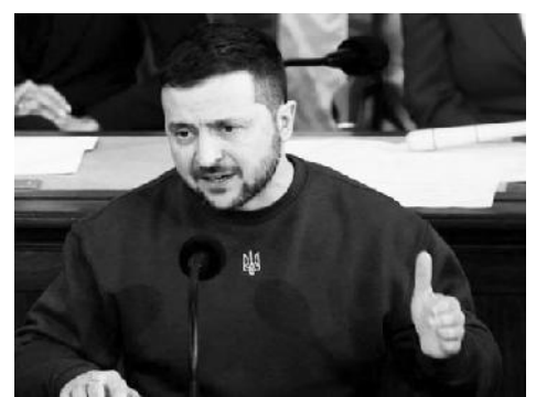
ዘሌንስኪ፣ የክሬን በአህጉሪቱ 30 ሀገራት እንድትወከል እናደርጋለን ማለታቸውን አል ዐይን ዘገባ ያመለክታል።

ግንኙነቱን ይበልጥ ለማጎልበት የክሬን በአህጉሪቱ ውስጥ ባሉ በርካታ ማዕከሎች ውስጥ የንግድ ተወካይ ጽህፈት ቤቶችን ማቋቋም እንደምትፈልግም ጭምር አስታውቀዋል። እነዚያ አዳዲስ ኤምባሲዎች ወይም የንግድ ቢሮዎች የት እንደሚገኙ ግልጽ ያላደረጉት