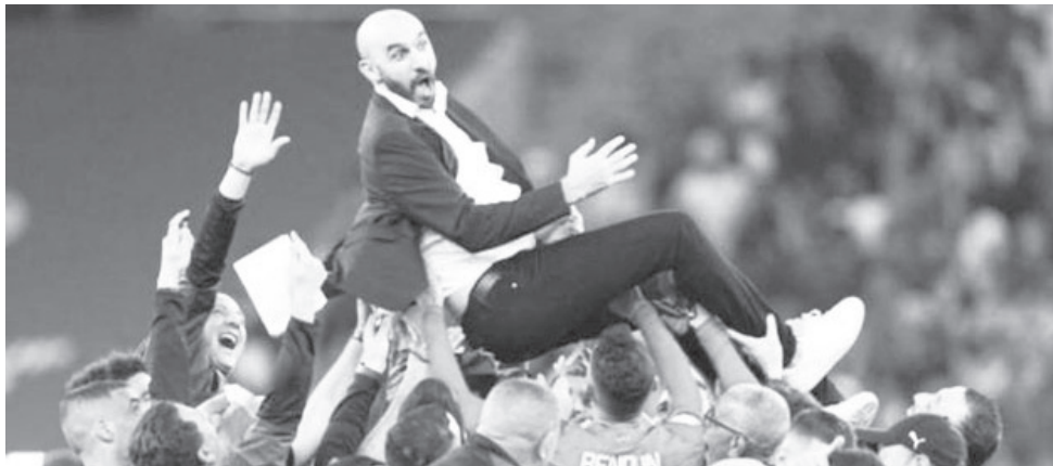
የሞሮኮ እግር ኳስ ብሄራዊ ቡድን ስሰጠውን የሞሮኮ ራግሬጉዊ በአለም ዋንጫ ታሪክ የማይረሳ ታሪክ መሰረት ችሏል።

የአትላስ አንበሳቶች አንበሳ ተብሎ የተወደሰው የዋሊድ ራግሬጉዊ ውልደት እኩል በ1975 በፓሪስ ደቡብ-ዊ ክፍል ኮርቢል-ኢሪኔስ ከተባለ ስፍራ ነው። እግር ኳስን