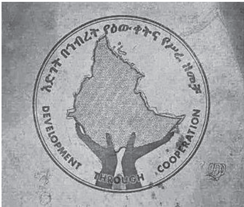
የህብረተሰባዊት ኢትዮጵያ ጊዜያዊ ወታደራዊ መንግሥት

ይህን አስደናቂ የደርግ የርዕዮተ ዓለም ጉዞ ካሰመረለት አንዱ የግራ ከንፍ ተከፋፍሎ ወደ አብዮቱ መድረክ መውጣት ነው። በተለይም ከሀገር ወጭ የሚገኘው የተማሪው ንቅናቄ አካል አብዮቱ ሲፈነዳ በሁለት አክራሪ ጎራዎች ተሰልፎ ነበር። ኋላ ገሀድ እንደ ወጣው እነዚህ ሁለት ጎራዎች የኢሕአፓና የመኢሶን ድርጅቶች ተከታዮች ነበሩ። እነዚህ ሁለት አንጋፋ የግራ ከንፍ ጎብፅ ድርጅቶች በተማሪ ድርጅቶች ሽፋን ይጋፈጃቸውን ማብዛትና ማጠናከር ተያይዘው ነበር። በአብዮቱ ዋዜማ ሁለቱ ጎራዎች በዓለም አቀፍ የተማሪዎች ድርጅት አወቃቀር ላይ ሳንጃ ቀረሽ ከርከር እያደረጉ ነበር። የኢሕአፓ ወገኖች በአዲስ መልክ የተዋቀረውን ዓለም አቀፍ የኢትዮጵያ ተማሪዎች ፌዴሬሽን ሲደግፉ፣ የመኢሶን ተከታዮች ደግሞ በቁጥጥራቸው ስር የነበረው ዓለም አቀፍ የኢትዮጵያ ተማሪዎች ማኅበር እንዲቀጥል