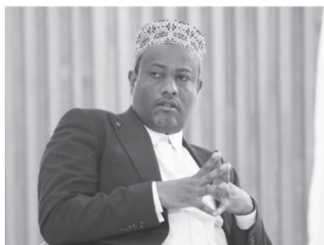
ሺህ ስብሰባ ላይ ያገኘው ስብሰባ