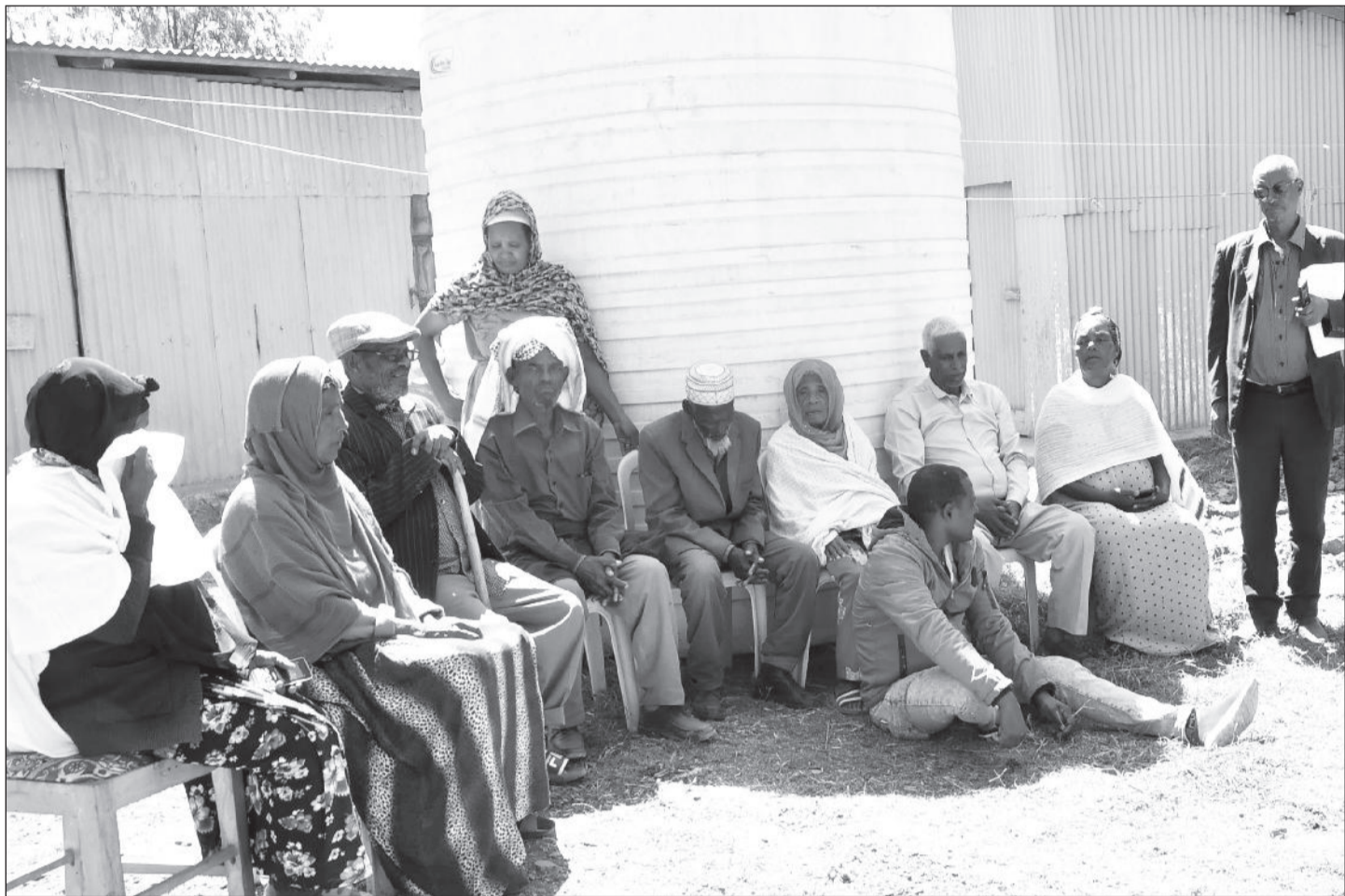
የሸቡ ጨፌ ስካባቢ ነዋሪዎች

እኔም የወረዳው ምክር ቤት አባል እንደመሆኔ መጠን ጉዳዩን ደጋግሜ ሳነሳው ተቀባይነት አጥቻለሁ። ስለጉዳዩ ደጋግሜ ማንሳት ለሌላ ችግር ዳርጎኛል። በተለይም ደግሞ ነዋሪዎች መብታቸውን እንዲጠይቁ ትግፋፊያለሽ፤ የልማት ተቃዋሚ ነሽ በሚልና በሌላ ሰብም በነገር ሽንቆጥ እንደሚያደርጓቸው ይጠቁማሉ። ይህም ብቻ ሳይሆን ይባስ ብሎ በገዛ ግቢያቸው ውስጥ ቤት ለመገንባት ፈቃድ ቢጠይቁም ተከልክለዋል። ሌላው ቀርቶ የመኖሪያ ቤታቸውን