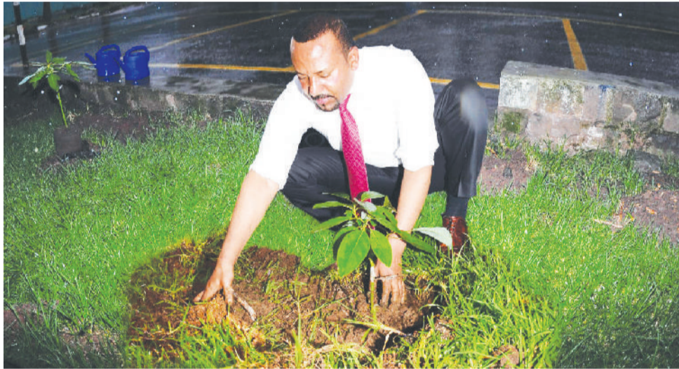
ኢትዮጵያ በአረንጓዴ አሻራ መርሃግብር 25 ቢሊዮን ችግኝትን መትከል ችላለች