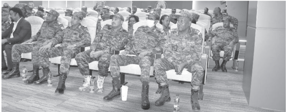
የሞራል ውድቀት ለሀገር እድገት ፀር መሆኑን ገልጸዋል።