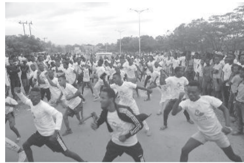
በጃንካ ከተማ በተካሄደው የ8ኪሎ ሜትር ሙድደር ሰላሳ ሺ ህዝብ መሳተፉ ተገልጿል።

የደቡብ አም ዞን በምስራቅ አፍሪካ በአጭር፣ በመካከለኛና በረጅም ርቀቶች በርካታ ስመ ጥር ተወዳዳሪዎች መፍለቂያ ከሆነው ሰሜን ኬይፕ ጋር የቅርብ ጎረቤት በመሆኑ “ትኩረት ሰጥተን ከሠራንበት በእኛም ሃገር በዘርፉ በዓለም አቀፍ ደረጃ ተወዳዳሪ የሆኑ እያሉ አትሌቶችን ለማፍራት የሚያስችል ዕድል አለ” ብለዋል። ዞኑ በተለይም የሰሜን ኬይፕ አገራቸው ከሆኑት