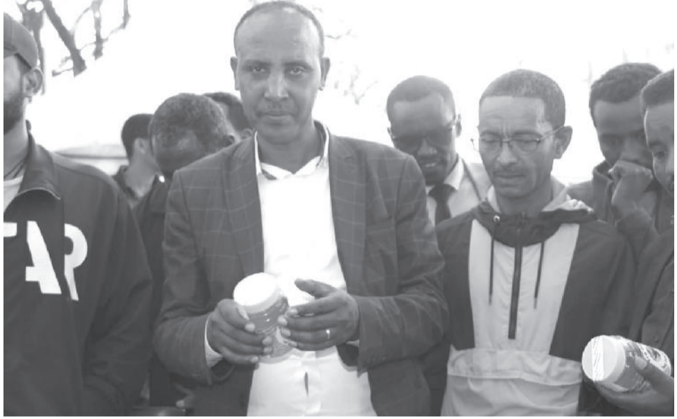
በወጣቶች የተመረቱት ማር ልማት ሲገበኝ፡