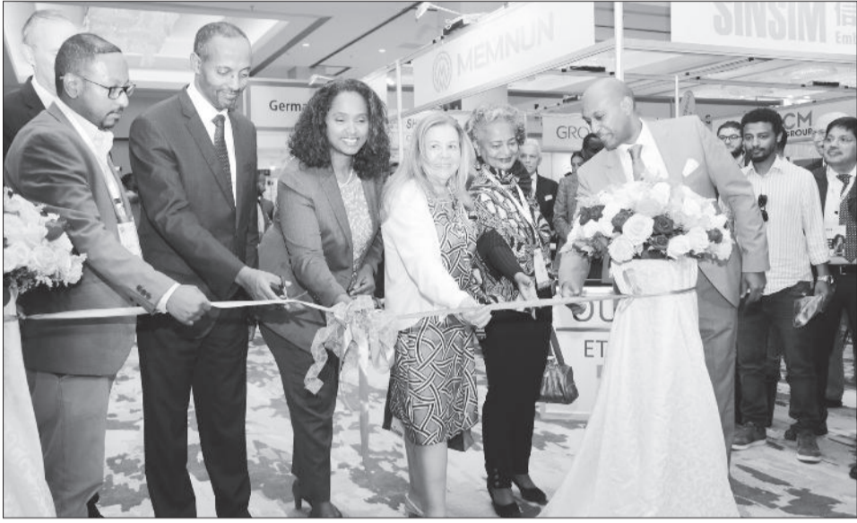
ፎቶ - አቶ መላኩ አበሬ

አዲስ አበባ ፡- አስካሁን ድረስ በአገራችን ከተፈጠሩ የሥራ እድሎች እና ኤክስፖርት በማድረግ ከሚገኘው ገቢ በአብዛኛው የሚገኘው ጨርቃጨርቅና አልባሳት ኢንዱስትሪ መሆኑን የኢንዱስትሪ ሚኒስቴር አስታዎቀ። ከ30 በላይ ዓለም አቀፍ ሀገራት የሚሳተፉበት 8ኛው የአፍሪካ ሶርሲንግና የፋሽን ሳምንት ዓለም አቀፍ ዐውደ ርዕይ ከተላኩት ጀምሮ በአዲስ አበባ ስካይላይት ሆቴል ተከናወኗል። ከጥቅምት 25 እስከ ጥቅምት 28 ቀን 2015 የሚቆየውን ይህን ዐውደ ርዕይ የከፈቱት የኢንዱስትሪ ሚኒስትሩ አቶ መላኩ አለበል እንደተናገሩት፣ አውደ ርዕይ ዓለም አቀፍ ተቋማት በኢትዮጵያ ያለውን እድል እንዲገነዘቡ የሚያደርግ እና ለሀገር ውስጥ አምራቾችም ሰፊ የገበያ ዕድል የሚፈጥር ነው። ዐውደ ርዕይ ለጋርመንት እና ቴክስታይል ኢንዱስትሪዎችን ትልቅ የምሥራች ነው ያሉት አቶ መላኩ፣ በኮቪድ እና በሀገር ውስጥ የሰላም እውቀት ምክንያት ከአንዚህ የኢንዱስትሪ ፓርኮች ማግኘት የሚገባውን ጥቅም ማግኘት ሳይቻል መቆየቱን አስታውሰዋል። በኢትዮጵያ በርካታ የኢንዱስትሪ ፓርኮች በከፍተኛ መሠረት ልማትና ወጪ ተገንብተው ሰፊ የሥራ ዕድል እና የኤክስፖርት ገቢ እንዲያስገኙ ታስበው እንደነበር ጠቅሰዋል። በመሆኑም ዐውደ ርዕይ የኢንዱስትሪ ፓርኮች ተገቢውን ጥቅም እንዲያገኙና ኢትዮጵያን ለማስተዋወቅ ያግዛልም ብለዋል። ከኮቪድ በኋላ የዚህ ዓይነት ሁኔታ ሲዘጋጅ የመጀመሪያ መሆኑን ገልጸው፣ ባለፉት ዓመታት ከኮቪድና ኮቪድን ተከትሎ በመጠት የገባው ሰንሰለቶችና አቅርቦቶች ችግር በተለይም በጋርመንት እና ቴክስታይል ኢንዱስትሪዎች ስር ተፅዕኖ አሳድሮ እንደነበር አስታውሰዋል። አፍሪካ ከሰው ሀብት ጀምሮ የተትረፈረፈ የተፈጥሮ ሀብት እና ጥሬ እቃዎች መገኛ በመሆኗ በዓለም አቀፍ