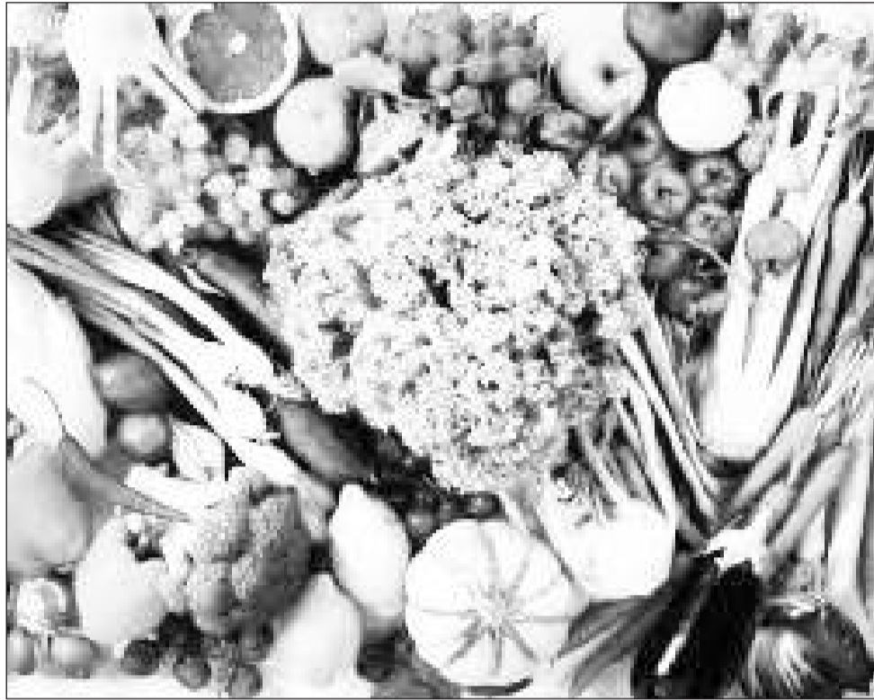
የመሆን ሂደታቸው ሰፊ ነው።

በፋብሪካ የተቀነባበሩ ምርቶች፣ የማምረቻ ሂደት ያላቸው ኬሚካሎች፣ ጣዕምን የሚያሻሽሉ ንጥረ ነገሮች፣ ማቅለሚያዎች ለጤና አደገኛ የሆኑ ሁሉንም አይነት ንጥረ ነገሮችን ያካትታሉ ይላሉ። እነዚህ ምግቦች ደግሞ በአጭርና በረጅም ጊዜ በጤና ላይ ከፍ ያለ ጉዳት ከማድረጋቸውም በላይ በተለይ በልጆች ዘንድ ሱስ