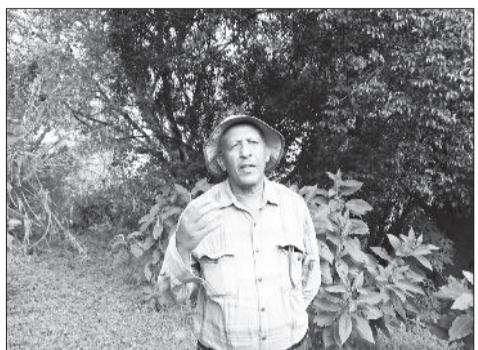
አት ወርታ ስበራ