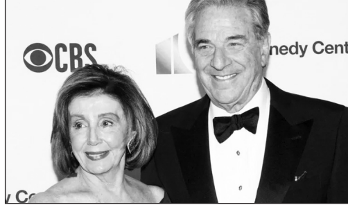
ናንሲ ፔሎሲ እና ባለቤታቸው ጎልጸዋል። ፖል ፔሎሲ በደረሰባቸው ጉዳት በራስ ቅላቸው

ዓርብ ጥቅምት 18/2015 ዓ.ም አንድ ጥቃት አድራሻ ግለሰብ ሳን ፍራንሲስኮ ውስጥ ወደ ሚገኘው የአፈ ጉባኤዎ እና ባለቤታቸው መኖሪያ ቤት ዘልቆ በመግባት የ82 ዓመቱ ጎልማሳ ፖል ፔሎሲን በመደገጥ መምታቱንና ፖል ከደረሰባቸው ጉዳት እያገገሙ መሆኑን ናንሲ ፔሎሲ