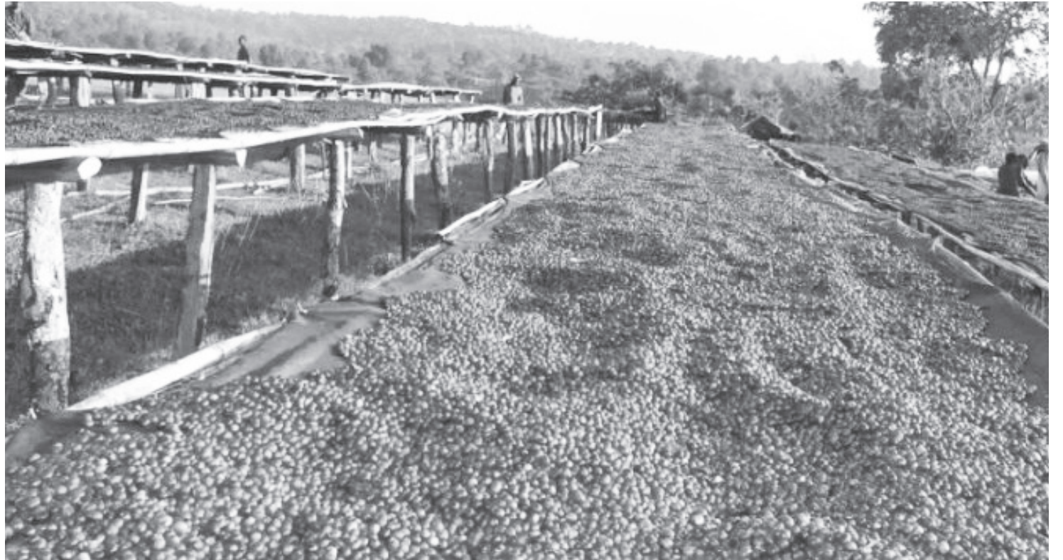
ሀገሪቱ ሰውጭ ገበያ የምታቀርበው ስፔሻሊቲ ቡና እየጨመረ እንዲሁ ጥራት ላይ በትኩረት መስራት መቀጠል አለበት

እንደ አሳቸው ገለጻ፣ የዛሬ ሶስትና አራት አመታት ስፔሻሊቲ ቡና ወደ ውጭ የሚልኩ ነጋዴዎች