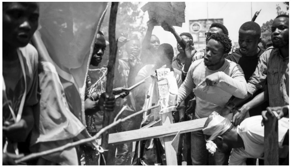
ህዝቡ በገዳና ላይ ተቃውሞውን ሲገልጽ በጥቅሉ ኮንጎ ዲሞክራቲክ ሪፐብሊክ የተረጋጋ አገር እንዳትሆን ሩዋንዳ ለኤም 23 አማራጭ ቡድን ድጋፍ እንደምታደርግ የተባበሩት መንግስታት ድርጅት ጭምር በበራራ ጽሑፎቹ ማረጋገጥን አልጀዚራ በዘገባው አመለካከቷል።

የዲሞክራቲክ ሪፐብሊክ ኮንጎ ይህን ይበልጥ እንጂ የሩዋንዳ መንግስት በበኩሉ ኮንጎ በሁለቱ አገራት መካከል የተፈጠሩ ወንጀያዎችን በማባባስ ላይ መሆኗን ገልጿ፤ በድንበር አካባቢ ያሉ ወታደሮቹ በተጠንቀቅ ላይ መሆናቸውን ጠቁማለች።