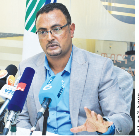
ፎቶ ማዲያ ጽ/ቤት