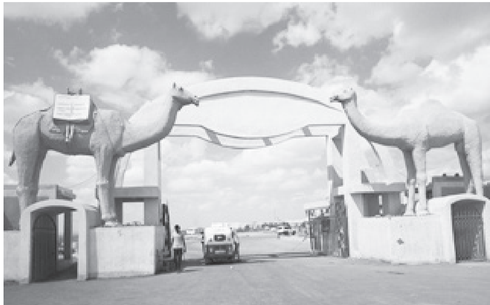
የሰሙራ ዩኒቨርሲቲ የአፋር ክልል ስፖርትን ወደ አዲስ ምዕራፍ ለማስገባት የተሰደደ ጥናቶችን እየሰራ ነው።