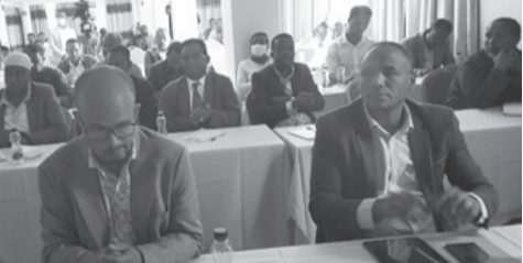
የምክክር መድረኩ ሲካሄድ

ንግድ ቢሮው ዋጋ ንረቱን ለመቀልበስ በየንዑሳችንና በሽማግሌት አማካኝነት ለሽማግሌት ማኅበረሰብ