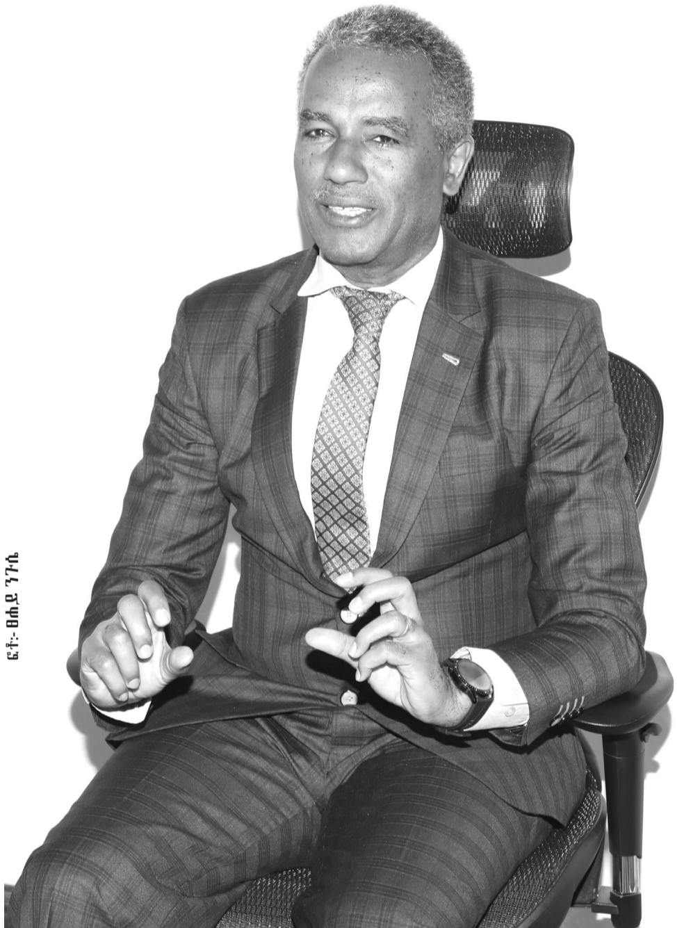
ፊት፡- ጠቅላይ ግንብ

በሌላ በኩል ደግሞ የጦር መሣሪያ ፋብሪካዎች አሉ፤ እነዚህ የጦር መሣሪያ ፋብሪካዎች ማትረፍ የሚችሉት እኛ ስንባላ ነው። በተመሳሳይ ደግሞ ውጭ አገር ሆነው ኢትዮጵያ ውስጥ ብሎም አፍሪካ ውስጥ የሚካሄደውን ነገር ከጉዳይ የማይቆጥሩም አሉ፤ እነርሱ የሚፈልጉት ምናልባትም ጦርነቱ የሚጠናከርበትን ሁኔታ ነው። ምክንያቱም ከጦርነት ማትረፍ ስለሚችሉ ነው። ጦርነት