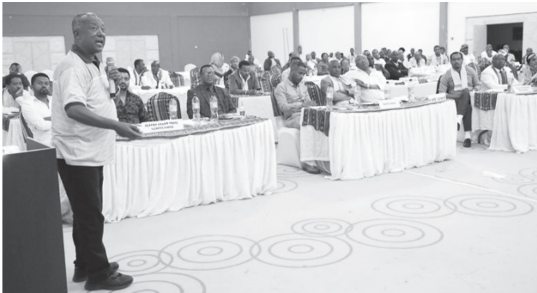
የዕድሜ ማጥቀሻ ችግር ስፖርቱን፣ ተተኪ ስፖርተኞችንና ስፖርቲንግ አደገዳ ያለ ችግር ሆኗል።

ኢትዮጵያን ጨምሮ በአብዛኛዎቹ የአፍሪካ አገራት ስፖርታዊ ውድድሮች ላይ እንደ ችግር ከሚነሱ ጉዳዮች መካከል አንዱ የዕድሜ ተገቢነት ነው። የዕድሜ ገደብ ባላቸው አህጉራዊም ሆነ ዓለም አቀፍ ውድድሮች ላይ የሚሰተዋል ችግርም በሳይንሳዊ መንገድ ተረጋግጦ በርካታ የአፍሪካ አገራትን ከጨዋታ ውጪ ሲያደርጋቸው በተደጋጋሚ ታይቷል። ኢትዮጵያም በዚህ ችግር ውስጥ የምትገኝ አገር ስትሆን በውድድሮች ላይ በትክክለኛ ዕድሜያቸው የማይሳተፉ አትሌቶች ቁጥር ከጊዜ ወደ ጊዜ እየተበራከተ፤ በጉዳዩ ላይ የሚደረገው ቁጥጥርም እንደሌለ ቀጥሏል። በዚህም በትክክለኛ ዕድሜያቸው የሚወዳደሩ አትሌቶች ተገኝቶች ሲሆኑ ስፖርቱም ተተኪ አልባ ሲሆን ተስተውሏል።