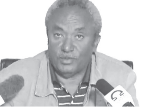
በጥቂት ቀናት የሚሠራ ይሆናል ብለዋል።

ከዚህ ቀጥሎ ታጣቂው ካለበት የውጊያ ቦታ ተንቀሳቅሶ ወደተዘጋጀለት ቦታ እንደሚሄድ የተናገሩት አዛዥ፤ ይህ የሎጅስቲክስ አቅም እስከ ፈቀደ ድረስ