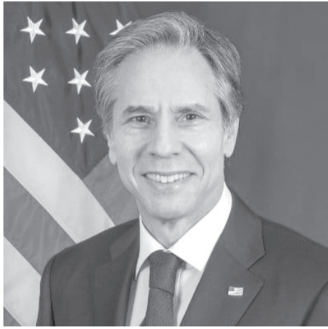
መጓዣው መገለጹ ይታወሳል።

ከፕሪቶሪያው የሰላም ስምምነት በኋላ ወደ ትግራይ በርካታ የሰብዓዊ ድጋፍ እየተላከ መሆኑ የሚታወቅ ሲሆን፤ ከአንድ ዓመት በፊት (ጎዳር 7 ቀን 2015 ዓ.ም) ኢ.ፕ.ድ ከኢትዮጵያ አዲጋ ሥጋት ሥራ አመራር ኮሚሽን ባገኘው መረጃ መሠረት በዚያን ዕለት ውስጥ ብቻ ሰብዓዊ ድጋፍ የጫኑ 67 ተሽከርካሪዎች ወደ ትግራይ