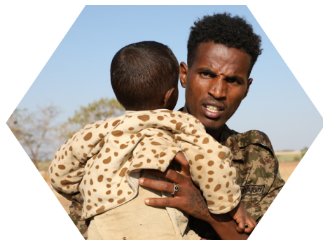
አሸባሪው ትህነግ የመከላከያ ሠራዊት አባላት ቤተሰቦችንም ለሠቆቃ ዳርጓል።