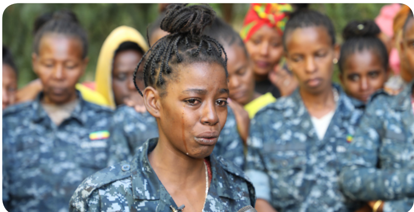
አሸባሪው ትህነግ ሴት የሠራዊቱ አባላት ላይ ታሪክ ይቅር የማይለው ግፍ ፈጽሟል