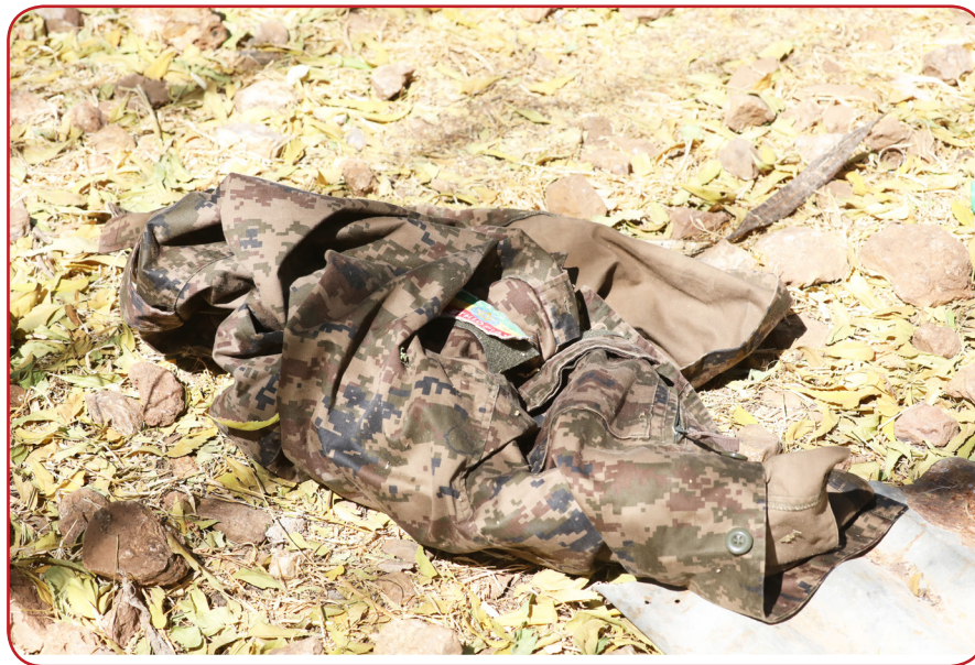
አሸባሪው ትህነግ ሠራዊቱ በተኛበት የግፍ ጭፍጨፋ ፈጽሞበታል