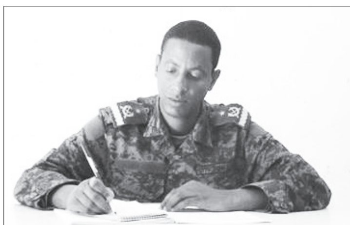
ብርጋዴር ጄኔራል ኑሩ መዘይን

ጓደኞቻችን ህዳር 30 ቀን 2013 ዓ.ም ላይ አጥፊነቸውን በብቃት በመፈጸም ነጻ አውጥተውናል። ለአንድ ወር ከሰድስት ቀን ታግተው በረሃብና በእንግልት የቆዩት የመከላከያ ሠራዊት መኮንኖችን ነፃ ለማድረግ ለተደረገው ጥንቃቄ የተሞላበት ጥረት በወቅት ምስጋና አቅርበዋል።