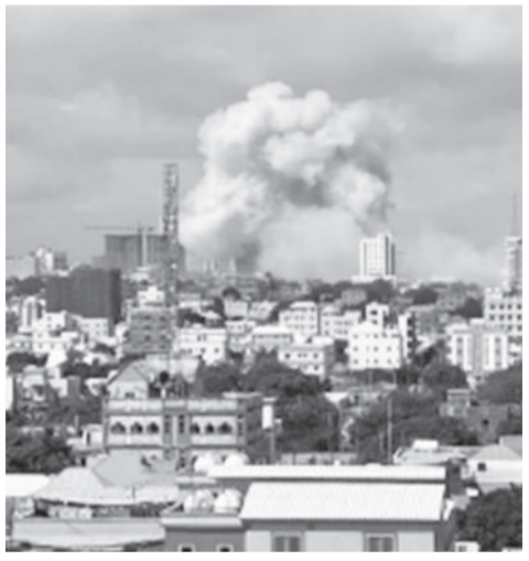
ጥቃቶች የተፈጸሙበት አካባቢ

የመጀመሪያው ፍንዳታ የትምህርት ሚኒስትርን የመታ ሲሆን ሁለተኛው ፍንዳታ ደግሞ የደረሰው የአደጋ