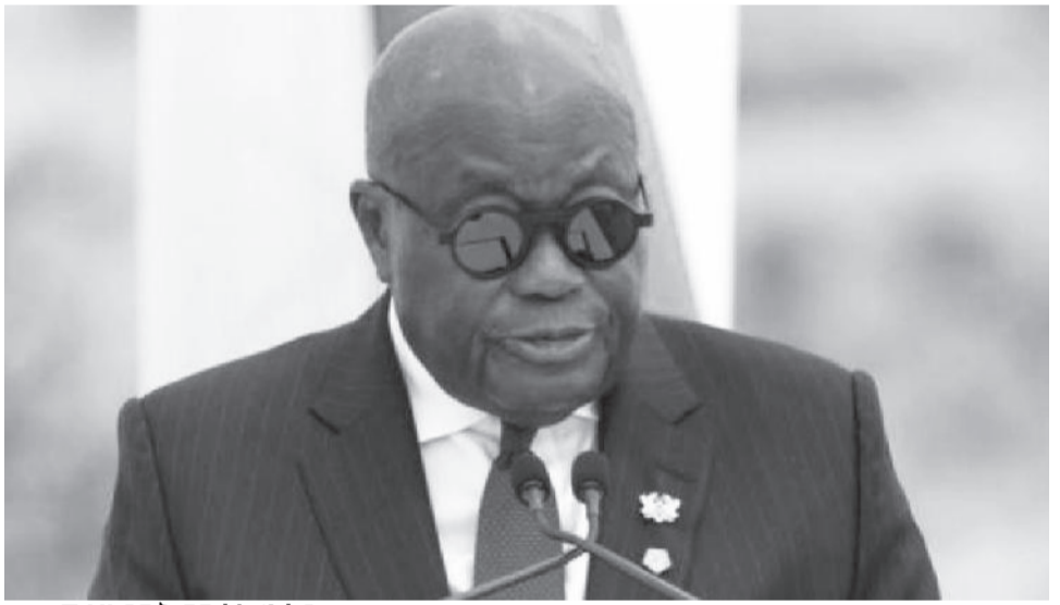
ፕሬዚዳንት ናና ስኩፎ-ሿዶ