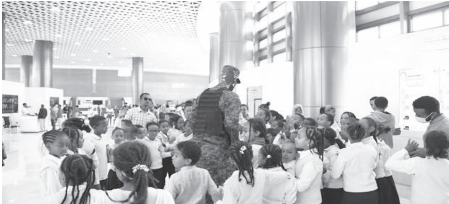
በሙዚየሙ የቀረቡ የሳይንስና ቴክኖሎጂ ግኝቶችን በየአስተዳደሩ በስፋት እየገቡ ጎብኚዎች የሚሰጡትን መረጃዎች በበርካታ ተማሪዎች ይገኙበታል።