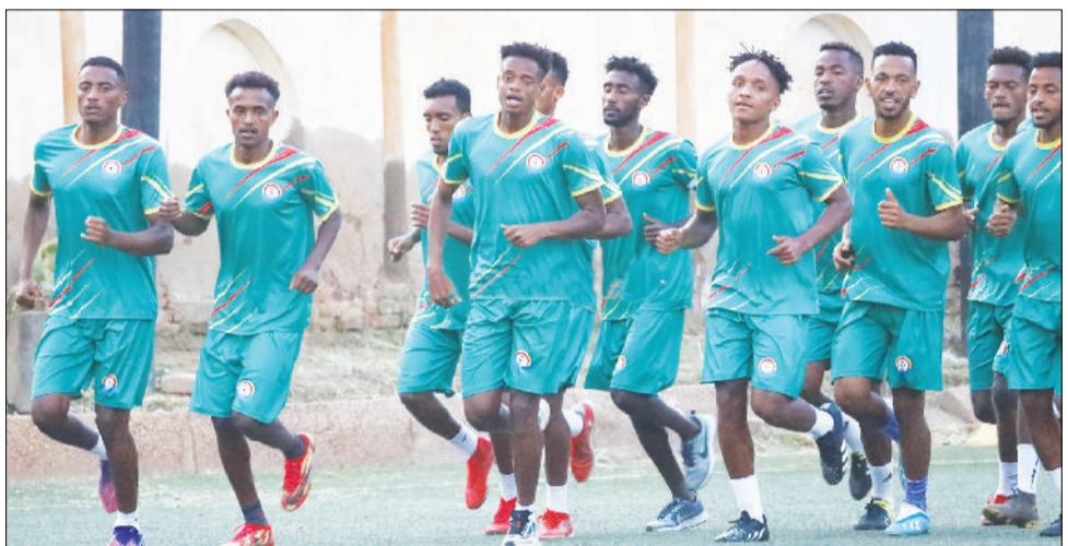
የኢትዮጵያ ከ20 ዓመት በታች ብሔራዊ ቡድን በሱዳን ዝግጅቱን አጠናክሮ ቀጥሏል።

በቀጣዩ የፈረንጅቹ ዓመት ለማካሄድ ከ20 ዓመት በታች የአፍሪካ ዋንጫ ተሳታፊ የሚሆኑ ቡድኖችን ለመለየት ከሚካሄዱ የማጣሪያ ጨዋታዎች መካከል አንዱ የምስራቅና መካከለኛው አፍሪካ አግር ኳስ ማህበር (ሴካፋ) የሚያሰናዳው ውድድር ነው። ዘንድሮም ይህ ውድድር ለ14ኛ ጊዜ በሱዳን አስተናጋጅነት ከቀናት በፊት መካሄድ መጀመሩ ይታወሳል። የዚህ ውድድር ተካፋይ ከሆኑ አገራት መካከል አንዱ የሆነው የኢትዮጵያ ከ20 ዓመት በታች ብሔራዊ ቡድንም ነገ የመጀመሪያ ጨዋታውን የሚያከናውን ይሆናል።