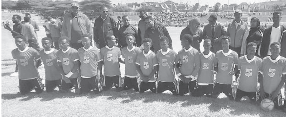
ከመላው የኦሮሚያ የተውጣጡ ትምህርት ቤቶች በውድድር እየተሳተፉ ይገኛሉ።