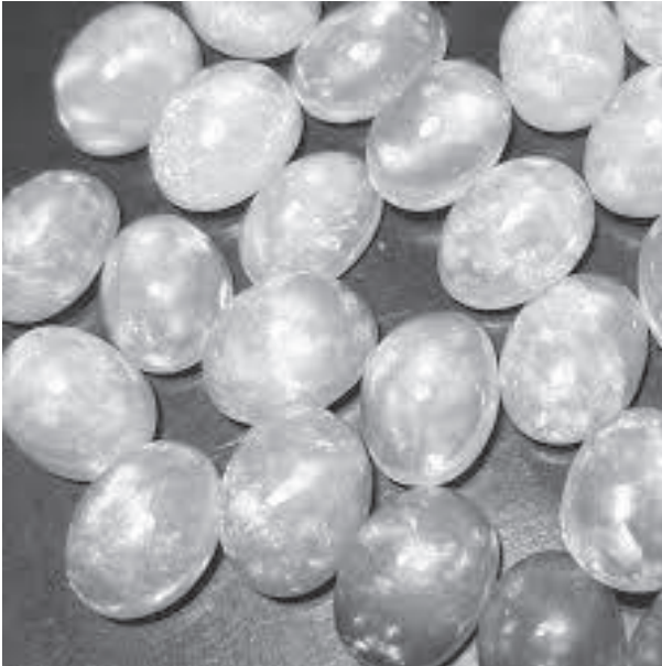
የምድርን ዘርፍ አሁን ላይ ለክፍለኢኮኖሚው እያበረከተ ካለው የአንድ በመቶ ድርሻ በሚቀጥሉት 14 እና 15 አመታት ከ17 በመቶ በላይ ድርሻ እንደሚያበረክት ይጠበቃል። ለስኬታማነቱም የፖሊሲ ማሻሻያ እርምጃዎችን ከመውሰድ ጀምሮ የተለያዩ ተግባራት ተከናውነዋል። በመከናወንም ላይ ይገኛል

ወይዘሮ ባንቻለም፣ ባባታቸው አግር ተተክተው ሥራው ውስጥ ቢገቡም የምድርን ዘርፍ መልካም ዕድሎችም፣ ተግዳሮቶችንም እንዳሉት በ15 አመት ተግባርአቸው አይተዋል። እርሳቸው እንዳሉት ስለማዕድን አይነቶች ማወቅና ዘርፉን በእውቅት መምራት እንዲሁ ከፍተኛ ወይንም ተግዳሮት ሲሆን፤ ገበያ መፈለግ ደግሞ ሌላው ችግር ነው። ተምሮ አራሰን ለማብቃት በሀገር ውስጥ በዘርፉ የሚሰጥ ትምህርት አለመኖርም ፈተና ነበር የሆነባቸው። ከቤተሰብ የወረሰትና በፍላጎትም የገቡበት ዘርፍ በመሆኑ በድረገጽ (አንዳይን) ትምህርት በመከታተል እራሳቸውን በማብቃት እስካሁን በዘርፉ ለመቆየት ችለዋል። እርሳቸውም ለልጆቻቸው አውቀት በማካፈልና ስለሥራው ግንዛቤ እንዲኖረው ጥረት እያደረጉ ይገኛሉ። መልካም እድል ብለው ከጠቀሷቸው መካከል ደግሞ የራሱን ሀብት (ካፒታል) ለመፍጠር የሚያስችል መሆኑን ነው። በተለያዩ የዓለም ሀገራት በሚካሄዱ የምድርን ኤክስፖርት ላይ በመሳተፍ በተገኘ ልምድ ሀብቱን ለገበያ ከማቅረብ ወደጌጣጌጥ በመቀየር የዓለም ገበያ ፍላጎትን ለማሟላት የሚደረገው ጥረትም ሌላው የአቅም ማሳደጊያ መንገድ እንደሆነ ይጠቅሳሉ። ወይዘሮ ባንቻለም «ከተኛነት እንንቃ» በማለት በዘርፉ ላይ የሚገኘውም አዲስ ለመስማራት ፍላጎት ያለውም በጋራ ተባብሮ ዘርፉን በማሳደግ እራሱንም ሀገርንም ተጠቃሚ እንዲያደረግ መልእክት አስተላልፏል። ኢትዮጵያ ወደ ሀብትነት የሚቀየርና ኢኮኖሚዋንም ከፍ ሊያደረግ የሚችል የምድር ውስጥ ፀጋ እያላት መጠቀም ባለመቻሏ