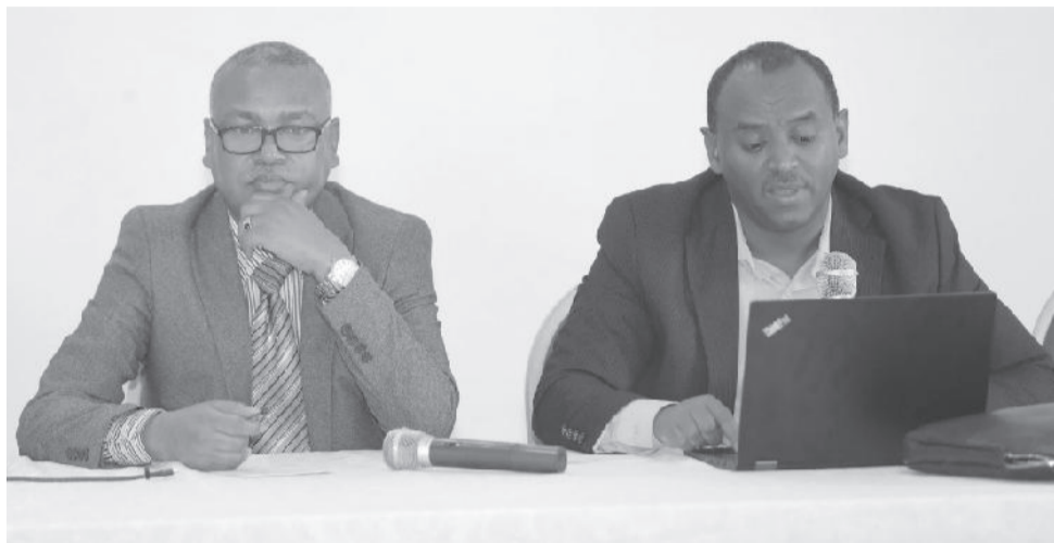
ሕዝቡ በወቅታዊ ጉዳዮች ላይ የመንግስት መረጃዎችን በፍጥነት እንዲያገኙ፤ የሕዝቦች አንድነትና ወንድማማችነት እንዲጎለብት፤ በግጭት ሳቢያ የተጎዱ አካባቢዎችን መልሶ በመገንባት ረገድ ወቅታዊ መረጃዎችን አግኝቶ ተሳትፎ እንዲያደርግ ለማድረግ

አይደለም የመንግስት የኮሙኒኬሽን ተቋማት የተጀመረውን ሀገራዊ የሰላም ሂደት ኅብረተሰቡ በአግባቡ እንዲደግፉ ለማድረግ መስራት እንዳለባቸውም አስገንዝበዋል፡፡