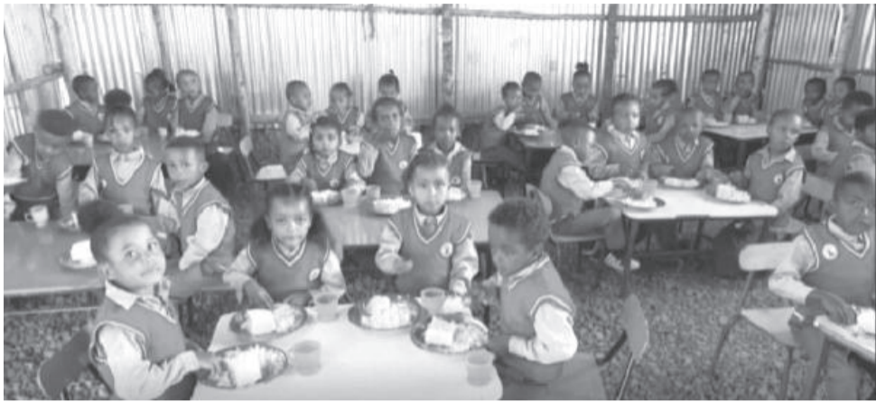
ቀን 2023 እንደሚቆይ ተገልጿል።

አሁን በከተማዋ ለህብረተሰቡ የጤና ጠንቅ እየሆነ ያለው የማይታወቁ ምርቶች የመጠቀም ሁኔታ ይስተዋል። ስለዚህ ይህንን ለህብረተሰቡ ለማሳወቅ ራሱን በጤና ለመጠበቅ የሚያስችሉ ሁኔታዎችን ለማመቻቸት እየሞከረ ነው። ለዚህም ይህንን የማስተማሪያ መድረክ አዘጋጅተናል ብለዋል።