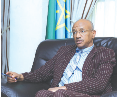
መረጋጋት በታየባቸው ተጨማሪ የትግራይ አካባቢዎች ላይም መንግሥት የሰብዓዊ ድጋፍን ለማከፋፈል ዝግጅት