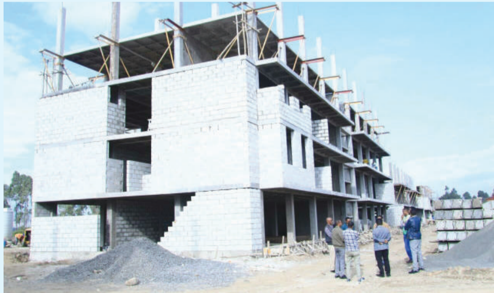
የአቃቂ ተገጣጣሚ ቤቶች ግንባታ የደረሰበት ደረጃ

የአዲስ አበባ ከተማ አስተዳደር በከተማዋ የሚስተዋለውን የኅብረተሰቡን የመኖሪያ ቤት ጥያቄ ለመፍታትና የሕዝብ ተጠቃሚነትን ለማረጋገጥ ከዘረጋቸው ሜጋ የልማት ፕሮጀክቶች አንዱ የጋራ መኖሪያ ቤቶችን በተለያዩ ፕሮግራሞች አካቶ በመሥራት በዘላቂነት የመኖሪያ ቤት ችግርን መቅረፍ አንዱና ዋናው ተግባር ነው። አስተዳደሩም የኅብረተሰቡን የመኖሪያ ቤት ጥያቄ እውን ለማድረግ የአዲስ አበባ ከተማ አስተዳደር ቤቶች ልማት ኮርፖሬሽንን በአዋጅ በማቋቋም ሲንቀሳቀስ ቆይቷል።