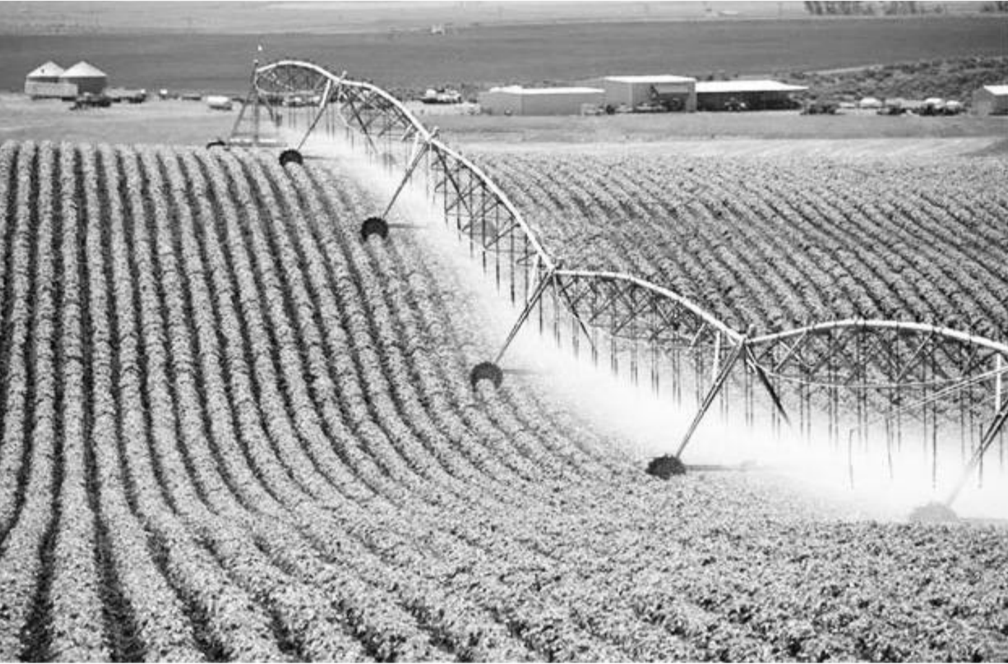
የመስኖ ምስራቅ የቴክኖሎጂ