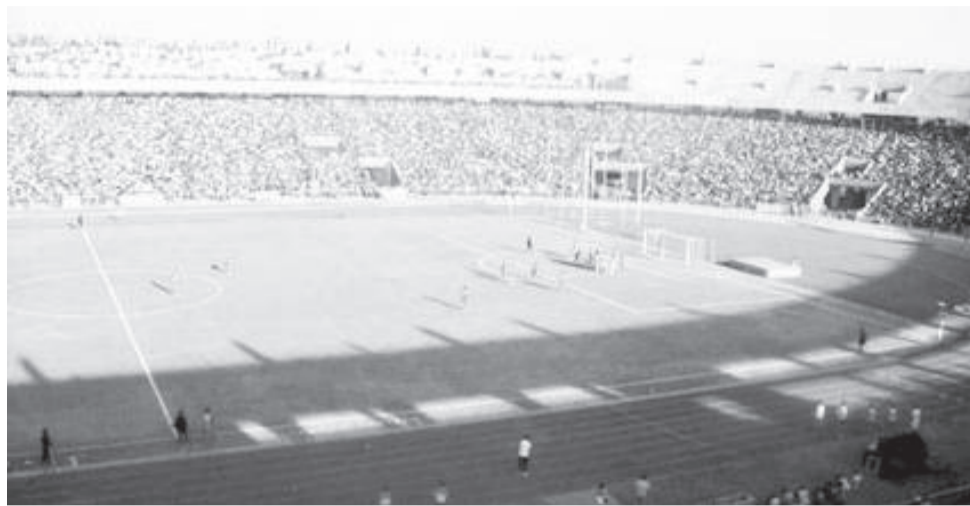
ሁለተኛውን የግንባታ ምዕራፍ ለማጠናቀቅ 1 ቢሊዮን 74 ሚሊዮን ብር እንደ ተሰበሰበ ታውቋል።

በክልሉ መንግሥት ተሳታፊነት የሁለተኛውን ዙር ቀሪ ሥራ ግንባታ ለማስጀመር ተወስኖ ወደ ስራ ተገብቷል። የዚህን ስቴድዮም የሁለተኛ ዙር ቀሪ ግንባታ ማስጀመሪያ መርሃግብርም ከቀናት በፊት ተካሂዷል። የባህርዳር ስቴድዮም ከጣራ ውጪ ያሉ ሥራዎችን ለማጠናቀቅ እና የካፍን 16 መሠረታዊ መስፈርቶች ለማሟላት የግንባታ ሥራው በይፋ የተጀመረ ሲሆን በአንድ ዓመት ጊዜ ውስጥ ለማጠናቀቅም ታስቧል። ኅዳር 2002 ላይ በ780 ሚሊዮን ብር በጀት 52 ሺ ተመልካቾችን እንዲይዝ ታስቦ ወደ ግንባታ የገባው የባህርዳር ስቴድዮም፣ ለግንባታው ማስጀመሪያ 389 ሚሊዮን ብር ተፈርሞ የነበር ሲሆን እስካሁንም 758 ሚሊዮን ብር ወጪ እንደተደረገበት ታውቋል። በ MH ኢንጅነሪንግ አማካሪነት እና በሚድሮክ ኮንስትራክሽን ለሚደረገው ግንባታ 1 ቢሊዮን 74 ሚሊዮን የተሰበሰበ ሲሆን ከጣራ ውጪ ያሉትን ሙሉ ሥራዎች የሚያጠቃልል እና በአንድ ዓመት የሚጠናቀቅ ይሆናል። የኢ.ፌ.ዴ.ሪ ባህል እና ስፖርት ሚኒስቴር ሚኒስትር አቶ ቀጆላ መርዳሳ የባህርዳር ዓለም አቀፍ ስቴድዮም ግንባታ ከሁሉ ስቴድዮሞች በፊት ይጠናቀቃል የሚል እምነት እንዳላቸው ገልጸው፣ በፍጥነት እንዲጠናቀቅ ያላቸውን ፍላጎት በማሳየት ድምጻቸውን ለማሰማት ባህርዳር እንደተገኘ ተናግረዋል። ግንባታውን ለማጠናቀቅ የቻሉትን ሁሉ እንደሚያደርጉም ቃል ገብተዋል። የሚድሮክ ኢንጅነሪንግ ግሩፕ ዋና ሥራ አስፈጻሚ አቶ ጆማል አህመድ በበኩላቸው፣ ብሔራዊ ቡድኖችን በስቴድዮም ዕጥረት ምክንያት ተሰዶ መጫወቱን ኮንንው ድርጅታቸው ስቴድዮም ግንባታዎች በመሥራት እንደሚታወቅ በማስታወስ ለባህርዳር ስቴድዮም