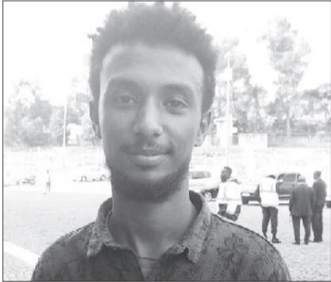
ወጣት ዘላለም የሐንሰ