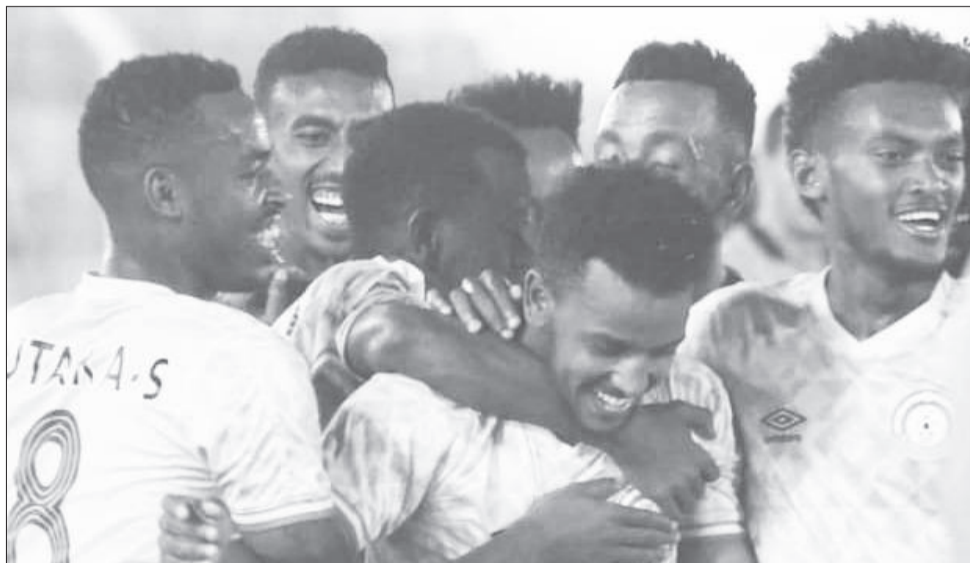
የኢትዮጵያ ከ20 ዓመት በታች ብሔራዊ ቡድን ወደ አፍሪካ ዋንጫ ስማሰፍ የ90 ደቂቃ ፍልሚያ ብቻ ቀርቶታል።

ጨዋታው ከዕረፍት ተመልሶ አራት ደቂቃዎች እንዳለፉ ከቅጣት ምት በተነሳ እና አቱማኒ ማካንቦ