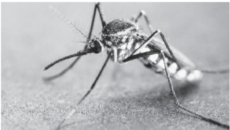
ለመቆጣጠር እንደሚያስችል ተናግረዋል።