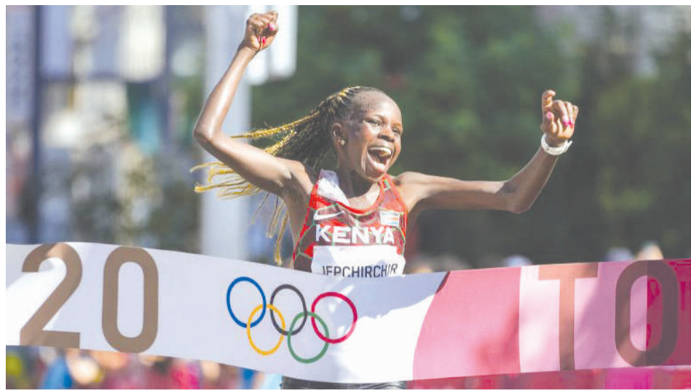
ኬንያዊት የአሊምፒክ ሻምፒዮን ከነ ቤተሰቧ በታላቁ ሩጫ በኢትዮጵያ ላይ ትገኛለች።

ከፔሪሲ ጄፕሮቸር ባለፈ ከኬንያ በዘንድሮው ወድድር ለመሳተፍ ከኬንያ የሚመጡ አትሌቶች መኖራቸውንም ከታላቁ ሩጫ በኢትዮጵያ የተገኘው መረጃ ይጠቁማል። ከእነዚህም መካከል ከአትሌት ሻለቃ ኃይሌ ገብረሥላሴ ጋር እክላ በ1993 የስቴት ጋርት የዓለም ቻምፒዮን ላይ ታሪካዊ የ10ኛ ሜትር ወድድር ያደረገው ኬንያዊው አትሌት ሞሰስ ታኑይም የሚገኝ ይሆናል። ሞሰስ ታኑይ የኤልዶሬት ከተማ ማራቶን ወድድር ዋና አዘጋጅ መሆኑ ይታወቃል። በተጨማሪም ከተለያዩ የኬንያ መገናኛ ብዙሃን የሚመጡ ጋዜጠኞችም እንደሚኖሩ ይጠበቃል።