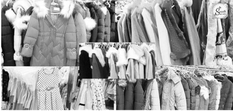
ሰልጣኛ ተብሎ የሚጠራው የልብስ ገበያ በሕገ-ወጥ የፋሽን ኢንዱስትሪ ላይ ፈተና እየሆነ ይገኛል።

በኢኮኖሚ ካደጉት ምዕራባውያን አገራት የሚነሱት ልባሽ ጨርቆች (ሰልጣኛ) መዳረሻቸው ከሰህራ በታች ያሉ የአፍሪካ አገራት ናቸው። የገቢያቸውን አብዛኛውን ድርሻ ለምግብ ወጪ የሚያውሉ ብዙ ዜጎች ላላቸው ድሃ አገራት ሰልጣኛ ዋነኛ የአልባሳት አቅርቦት ምንጭ ነው። ከዚህ በተጨማሪ በንግድ ሰንሰለቱ ላይ የሚገኙ እንደ ጫኝና አውራጅ፣ ቸርቻራ፣ አጣቢ፣ ጠጋኝ ያሉ የሥራ መስኮች ላይ የተሰማር ግለሰቦች በሂደቱ ተጠቃሚ ይሆናሉ።