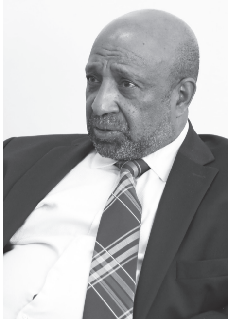
ፕሮፌሰር ብርሃኑ ነጋ

በሀዋሳ የኒቨርሲቲ ከትናንት በስተቀር ዋናውን ከቴክኖሎጂ ግቢ የሚያገናኝ የመሸጋገሪያ ድልድይ