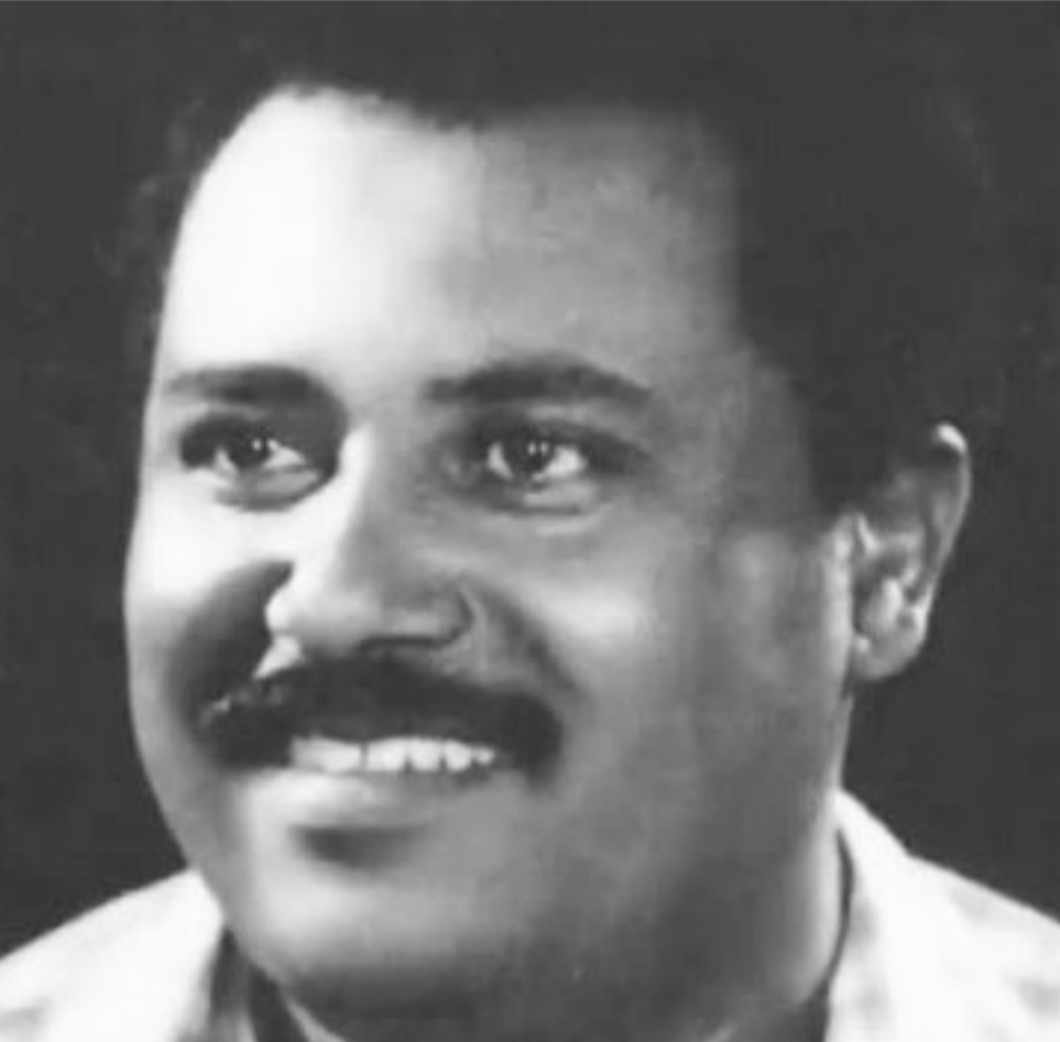
መኖር ሕልው ነው - በመንፈስ በአካል፤ ያለዩኝ ወገኖች ቢሉም ሞቷል አልፏል፤ ለሚፎክሩትም - ፀረ ሰብ ተንባላት! ግልጡ አካሌ ይኸው ነፍሴን ግን አይገሏት!!

ሀይወት በመርዘነት ስለመርዘ መመረዝ የመርዘን ለመርዘ በመርዘ ማስመረዝ!!! (ይህ ግጥም በበጎ ካልታላቂነትና ካሳሰሩት ስራዎቹ አንዱ ነው።) ***