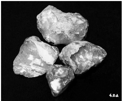
ኦፕራ በኢትዮጵያ ከሚገኙ ዋና ዋና የማዕድን አይነቶች፤