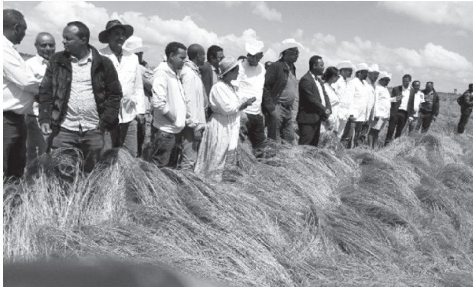
በሚያስችል ደረጃ ላይ ይገኛል” ብለዋል።

“አርሶ አደሩ የግብርና ቴክኖሎጂን እንዲጠቀም ከማድረግ ባለፈ በቂ ግብዓት እንዲቀርብ በመደረጉ የመኸር ሰብል ቁመና የታሰበውን ምርት ማግኘት