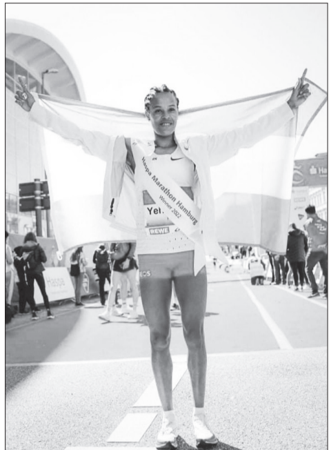
አትሌት ያለምዘርፍ የኋላው የሰንደን ማራቶንን በድንቅ ብቃት አሸነፈች።

በየአመቱ በተለያዩ የአለማችን ከተሞች ከሚካሄዱ ታላላቅ የማራቶን ውድድሮች ግንባር ቀደም በሆነው የሰንደን ማራቶን ኢትዮጵያዊቷ ወጣት አትሌት ያለምዘርፍ የኋላው ብቃቷን ደል ተቀዳጅታለች። በደመናማና ቀዝቃዛ የአየር ንብረት ታጅቦ ትኖት ውድድሩ ሲካሄድ ያለምዘርፍ በአስደናቂ ብቃት ተጨባጭነቷን በፍጹም የበላይነት መርታት ችላለች።