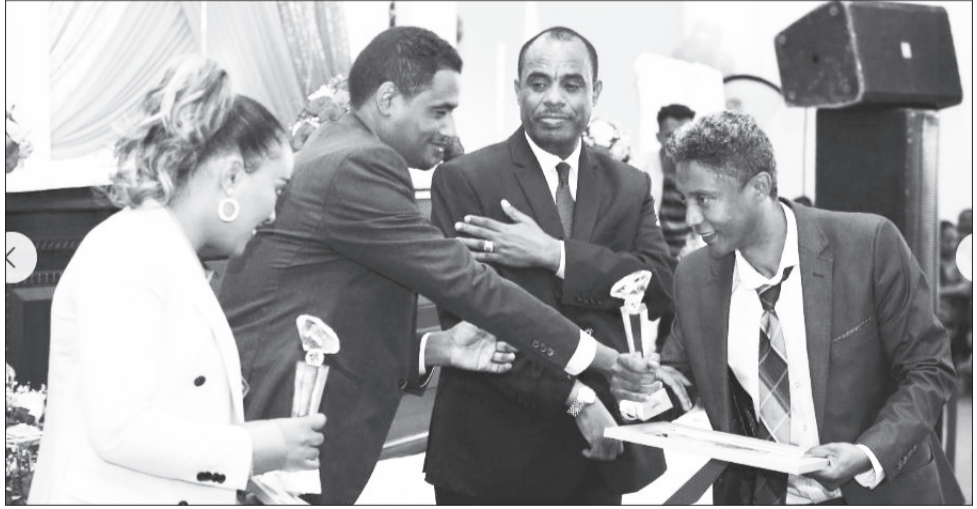
ሰቴክኖሎጂው እውቅና ተሰጥቷል።

ዘርፉ ዜጎች ያልረኩበት፣ የስነ-ምግባር ችግር በስፋት የሚስተዋልበትና የሚታማበት በመሆኑ ክፍተቶቹን በመቅረፍ ፍትህዊነትን ለማስፈን በቴክኖሎጂ መታገዝ ያስፈልጋል ያሉት የቢሮ ኃላፊው፤ ከዚህ አንጻር የአዲስ አበባ መሬት አስተዳደር በርካታ አገልግሎትን የሚያቀላጥፉ የቴክኖሎጂ ማልማት ስራዎች መሰራታቸውን ተናግረዋል። ሆኖም ቴክኖሎጂ ብቻውን መፍትሔ ስላልሆነ ከላይ እስከ ታች ያለውን የሰው ሀይል ማብቃት ያስፈልጋል ብለዋል።