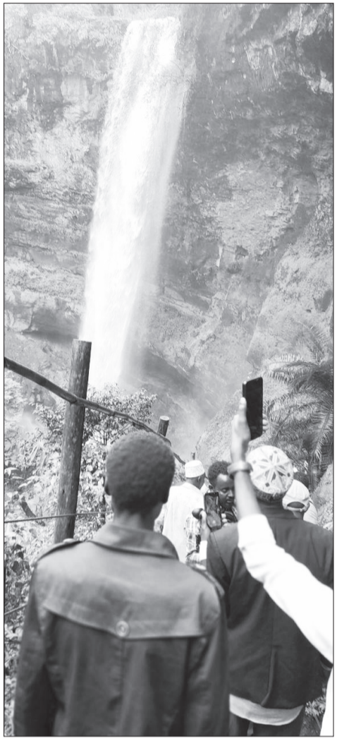
ሻንጋ ፍፋቱ (ከስላሳ 34 ኪ.ሜ ርቀት ላይ የሚገኝ) ጠቅላይ ሥራ

በተለይ ለቱሪስትና ለኢንቨስትመንት ፍላጎት ክፍተኛ አስተዋጽኦ የሚኖረው የዓባይ ግድብ ዙሪያ የግንዛቤ ማሰጫ በጫ ሥራዎች በስፋት መስራት እንደሚገባ