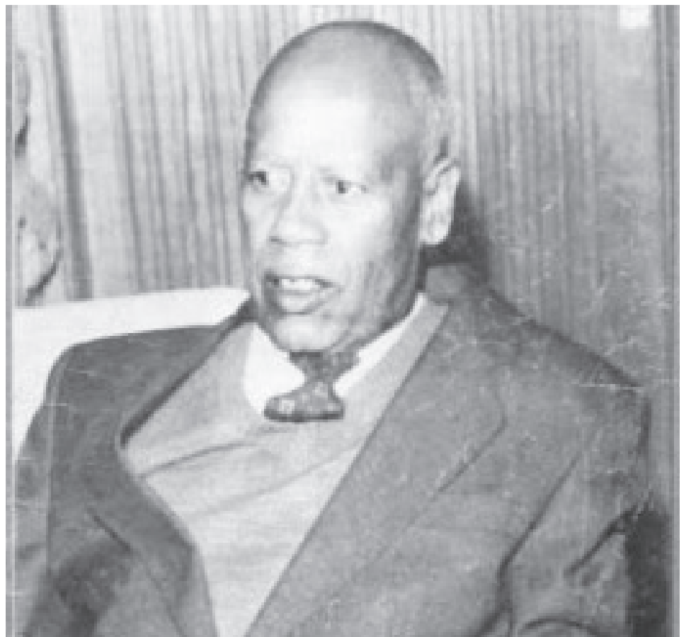
የክብር ደክተር ሀዲስ አለማየሁ

ከስደት መልስ ሀዲስ በተለያዩ ዘርፎች ያገለገሉ ሲሆን በተለይም በፖለቲካው ረገድ ሚኒስትር ዴኤታ እና ዲፕሎማት ሆነው አገራቸውን ብዙ አገልግለዋል። ይሁንና ሀዲስ በተለይ ዲፕሎማት ሆነው አዳዲስ ልምዶችን ቀስመው ከመጡ በኋላ ከንጉስ ነገስቱ ጋር የነበራቸው ግንኙነት ብዙም የሰመረ አልነበረም። በተለይም ለውጥን አስመልክተው ለንጉሱ የጻፉት መልእክት እስከፍቷቸው ነበር። በዚህ መልዕክታቸው በ1953 ዓ.ም የተሞከረው መፈንቅለ መንግሥት መንስዔና ወደፊትም የመንግስት አሰራር ካልተሻሻለ የከፋ ችግር ሊያጋጥም እንደሚችል በመጥቀስ ኋላ ቀር የሆነው የኢትዮጵያ ማኅበረ-ኢኮኖሚያዊና ፖለቲካዊ መዋቅር ሊሻሻል እንደሚገባ ገልጸዋል። ይህ መረጃ ያለ የሀዲስ ምክር ሃሳብ ስልጣናቸውንና ክብራቸውን እንደሳይናቸው ብለን ለሚጠብቁት ንጉስ ነገስቱ ምቹትን አልሰጠም። በዚህም ንጉስ ነገስቱ ሀዲስን ቢሯቸው አስጠርተው «ድፍረት ስለተሞላበት» ደብደቤያቸው ገሰጹቸው። ሀዲስ ግን በንጉስ ነገስቱ ሃሳብ ባለመስማማት በመልዕክታቸው ካሰፈሩት ሃሳብ በተጨማሪ ሌሎችንም ምክር ሃሳቦችን ለንጉስ ነገስቱ ተናገሩ። መልዕክቱ ለንጉሱ በደረሰባቸው በስምንተኛው ቀንም ሀዲስ የትምህርት ሚኒስትር ዴኤታ እንዲሆኑ ተደረገ። ንጉስ ነገስቱ ራሳቸው የትምህርት ሚኒስትር ስለነበሩ ሹመቱ ከፍተኛ ትችት የሰነዘሩባቸውን ደፋሩን፣ በግልፅ ተናጋሪውንና ትሁቱን ሀዲስን ከጎናቸው አድርገው ለመቆጣጠር እንደሆነ ግልጽ ነበር። በኋላ ላይ ሀዲስ በገዛ ፈቃዳቸው ከትምህርት ሚኒስቴርነት ሲነሱ ዲፕሎማት ተደርገው ከአገር ራቅ እንዲሉ ተደረገ