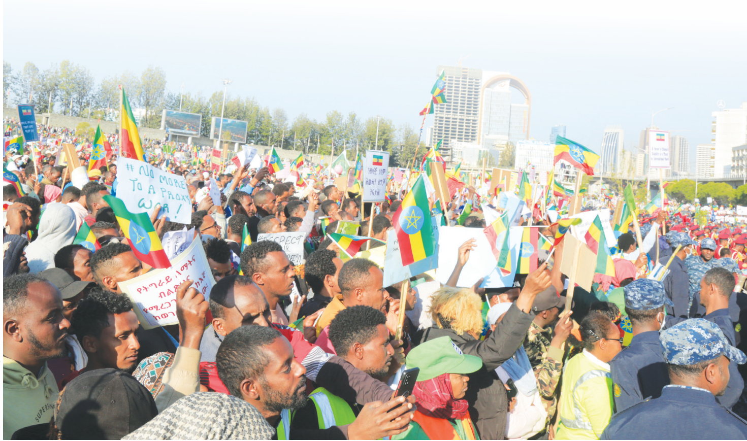
ፎቶ- ሐዲስ አበባ