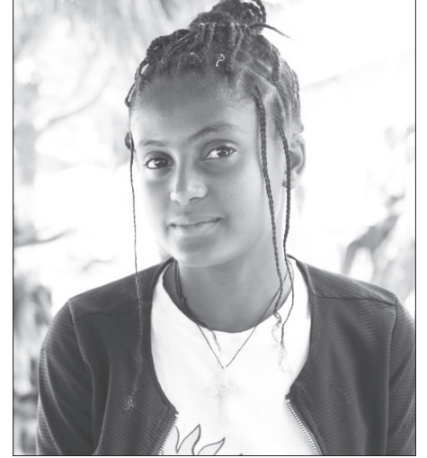
ተማሪ ደራርቱ ደራባ

ልጆች እንዴት ናችሁ፤ ትምህርት እንዴት ይዟችኋል? በደንብ እየነበሩት ነው አይደል? ከመጀመሪያው ጀምሮ ማንበብን ልምድ ካደረጋችሁ ውጤታማ ትሆናላችሁ። ስለዚህም ጎበዝ ተማሪ ለመሆን ከፈለጋችሁ ዛሬ የተማራችሁትን ዛሬውኑ አንብቡ። ተጨማሪ ነገሮችን በማክልም አቅማችሁን ማሳደስት አለባችሁ። ልጆች ዛሬ ይገዳላችሁ የመጣሁት በአዲሱ ስርዓት ትምህርት ሚኒስትሪ ተፈታኝ የሆኑትን የስምንተኛ ክፍል ተማሪዎችንና ዝግጅታቸውን ነው። ስለ አዲሱ ስርዓት ትምህርት ጥቅምም በደንብ ነግረውኛልና ከእነርሱ ተሞክሮ እንደምትወስዱ እምነት አለኝ።