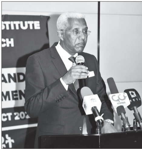
ክቶ ስላሴ ሰማ