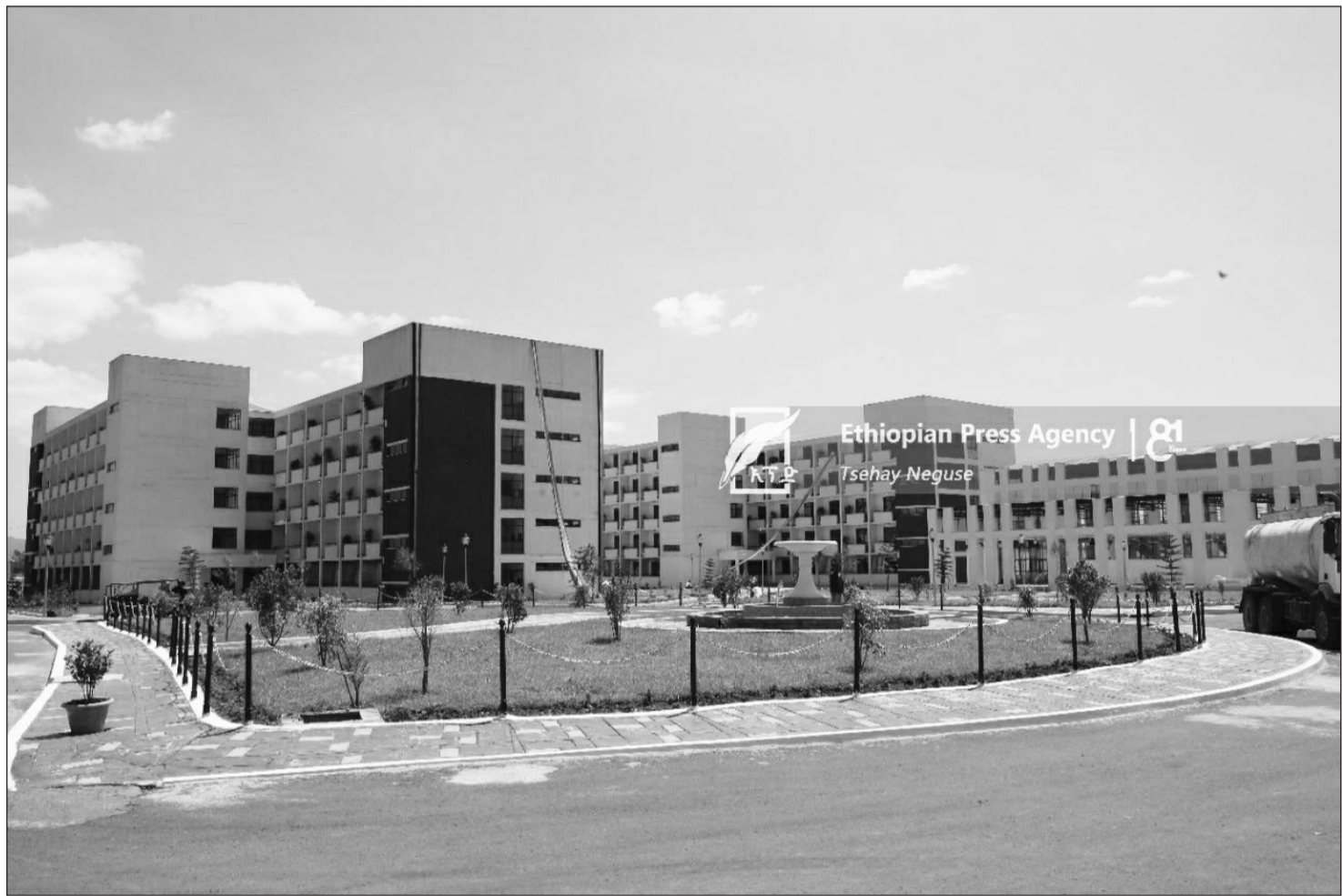
ትምህርት ቤቱ ስንድ ሺ በስተስጥኦ ወጣቶችን ተቀብሎ ማስተማር ያስችላል

ጠቅላይ ሚኒስትር ዶክተር ዐቢይ አሕመድ ይህን የልዩ ተስጥኦ ማበልፀጊያ ትምህርት ቤት መርቀው ሲከፍቱ “ኢትዮጵያ የብሩህ አቅምና ተስጥኦ ማበልፀጊያ ማቆም ማስፈጸም ማለት፣ ባለ ተስጥኦ ታዳጊዎችና ወጣቶች ክህሎታቸውን እየዳበሩ፣ አገራቸውን በቴክኖሎጂ ከበለጸጉ አገራት ተርታ እንዲያስልፉ፣ እንደ ቡራዩ የተስጥኦ ማበልፀጊያ ትምህርት ቤት ያሉ የተስጥኦ ማዕከላትን ማብዛት ይገባል” በማለት በትምህርት መሰረተ ልማት ግንባታ ዘርፍ በቀጣይ ሌሎች በርካታ ስራዎች መስራት እንደሚገባቸው መንግስትም ለዚያ ዝግጁ እንደሆነ ገልጿል።