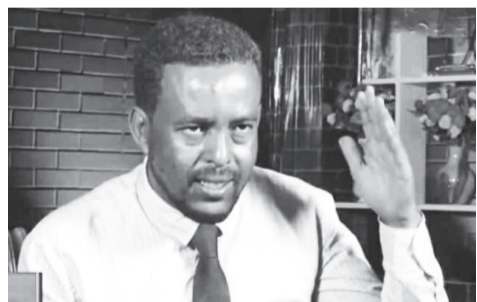
እየተሰራበት መሆኑን እንደማሳያ አንስተዋል።

ፕሬዚዳንቷ ከተቀመጡት አቅጣጫዎች መካከል ችግሮችን በምክክር ለመፍታት እንደ ሀገር ተቋቁሞ ስራ ላይ የሚገኘው ሀገራዊ ምክክር ኮሚሽን ዘላቂ ሰላም ለማስፈን ትልቁ መሳሪያ ተደርጎ በትኩረት