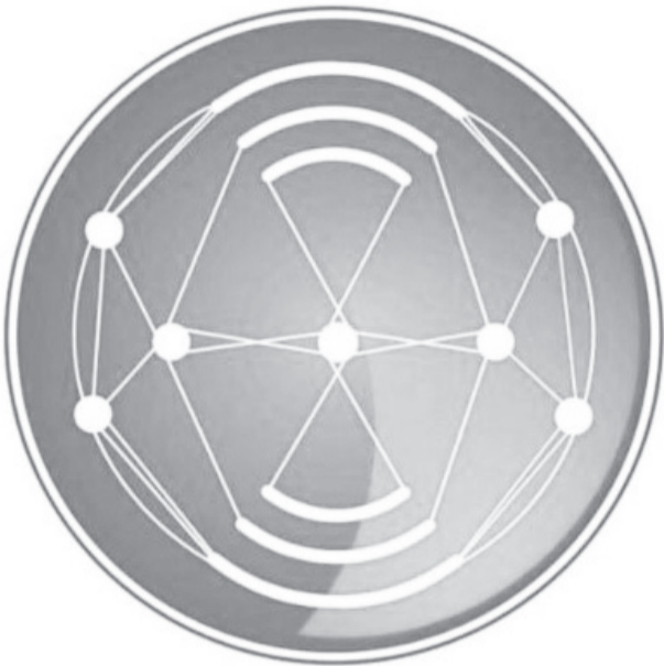
በኢ.ፌ.ዴ.ሪ የመንግሥት ኮሙኒኬሽን አገልግሎት FDRE Government Communication Service

የፈተና አሰጣጡ ስኬት በሌሎችም ሀገር አቀፍ ምዘናዎች ሊተገብሩ የሚችሉ የተሻሉ አሠራሮችን አስተምሮ ማለፉን የገለጸው አገልግሎቱ፤ በሁሉም ደረጃ ያሉ ተማሪዎች በራሳቸው ሥራ ብቻ ተማምነው መቆም