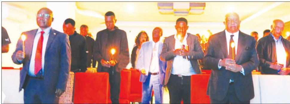
የኢትዮጵያ ስፖርት ጋዜጠኞች ማህበር ታላቁን የስፖርት ሰው ፍቅሩ ኪዳኔን ጣር በማብረት ዘክሯል።

ኢትዮጵያን በስፖርት ዘርፍ በዓለም አቀፍ ደረጃ ካስጠሩ ሰዎች መካከል አንዱ አንጋፋው የስፖርት ጋዜጠኛ ፍቅሩ ኪዳኔ ናቸው። እኚህ ታላቅ ሰው ከጋዜጠኝነት ሙያ ባለፈ በስፖርት ዘርፍ የተለያዩ አገልግሎቶችን በማበርከት የኢትዮጵያን ስፖርት ከምስረታው አንስቶ የደገፉ ናቸው። አቶ ፍቅሩ በዓለም አቀፍ የስፖርት ማህበራትም በአማካሪነትና ሌሎች ስራዎች ያገለገሉ ሰው ናቸው። የስፖርት ትምህርት ቤትና ማህበር የነበሩት አቶ ፍቅሩ ኪዳኔ ባላለፍነው ሳምንት በ88 ዓመታቸው ከዚህ ዓለም በሞት መለየታቸው ይታወቃል። የቀብር ስነስርዓታቸውም ረጅም ዓመታትን በኖሩበት ፈረንሳይ የተፈጸመ ሲሆን፤ በአገራቸው ኢትዮጵያም ስራዎቻቸውን የሚዘክሩ መሪ ግብደት ተከናውኗል።