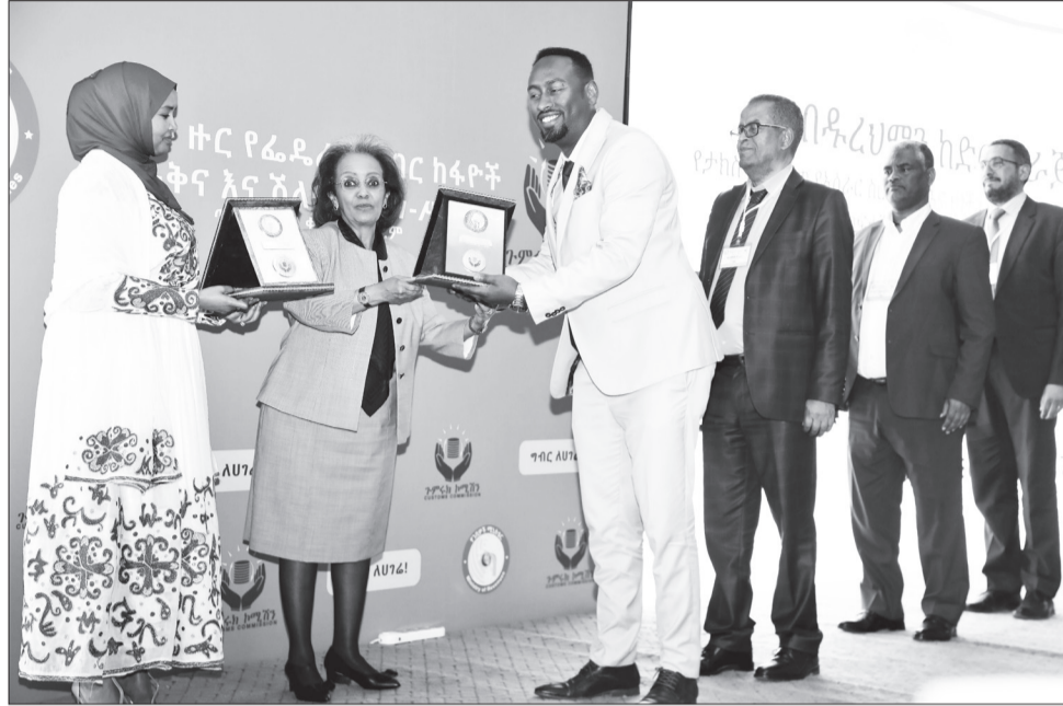
ግዴታ ይሆናል ሲሉም አብራርተዋል።

መንግሥት ከዜጎቹ ተገቢውን ግብር በተገቢው ወቅት ካላገኘ ለልማትና ለሰላም የሚያስፈልገውን ገቢ ለማግኘት የሀገራትን የልማት አጋሮችን በር ማንኳኳት