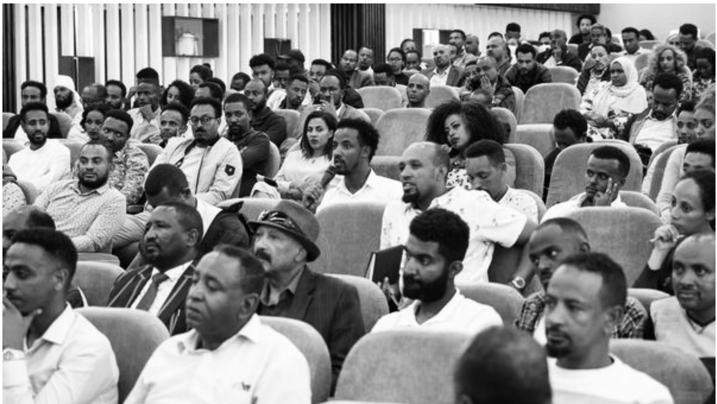
በጌጣጌጥ ማዕድን ግብይት ላይ በተደረገው የማሻሻያ ክስሳ ውይይት ሲካሄድ፤

የማሻሻያ እርምጃው ከተወሰደ ከሶስት ወር በኋላ ግን ሚኒስቴር መሥሪያ ቤቱ አሰራርን በመፈተሽ ግብይቱ በተደረገው ማሻሻያ መሠረት እንዲቀጥል ሳይሆን፣ ከማሻሻያው በፊት ይከናወን በነበረው የግብይት ሥርዓት የመሸጫ መነሻ ዋጋ እንዲቀመጥ ከለሳ አድርጓል። ሚኒስቴሩ ይህንን ውሳኔውን ከምክንያቶቹ ሰጥኑን በዘርፉ ላይ በተለያዩ ሥራ ከተሰማሩትና