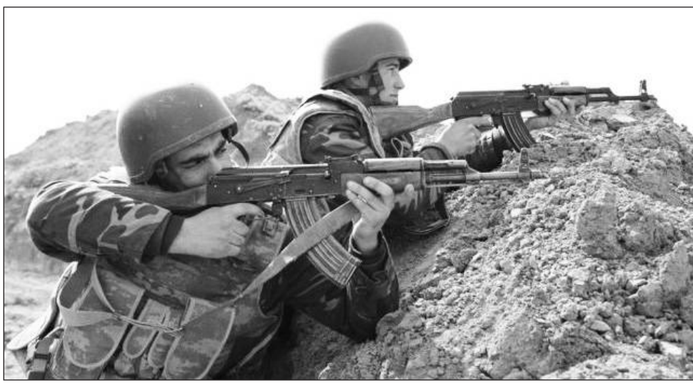
ሞስኮ ማክሰኞ ንጋት ላይ ግጭቱ በአስቸኳይ እንዲቆም ከማደራደሩ በፊት ሌሊቱን ሙሉ በሙሉ አገራት ወታደሮች መካከል የተከሰ ልውውጥ ሲካሄድ እንደነበረ ተገልጿል።

አዘርባጃን በበኩሏ ወታደራዊ እርምጃ የወሰደችው ጦሩ ላይ ጥቃት ከተሰነዘረ በኋላ መሆኑን ትናገራለች።