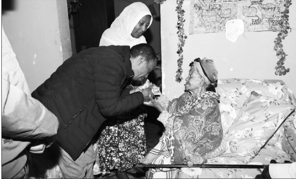
የፕሬዝዳንት ድርጅት በአዲስ ዓመት ዋዜማ እማማ ግምጃ ቤት ለአውሮጳ ዓመት የሚያስፈልጋቸውን ገዝቶ ለመምጣት ስላበቃው በቀለጠ አልልታ እያመሰገኑት ገንዘቡን ሰጥተው ላኩት።