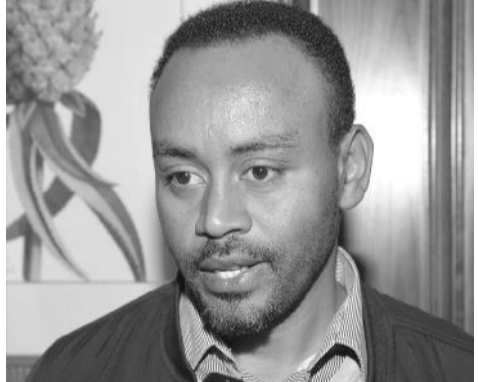
ጋዜጠኛ ውብሽት ሸበራ