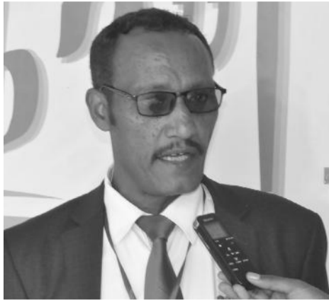
ድ.አብነት ለአገልግሎት አሰጣጥ

ለዜጎች የሚሰጠውን አገልግሎት ተገባዥ የማድረግ ኃላፊነት አለበት። የሚሰጡ አገልግሎቶች ለዜጎች ቀድመው መታወቅ አለባቸው። ደረጃቸውን የጠበቁ መሆን ይገባቸዋል። በጊዜ፤ በመጠን፤ በጥራትና በወጪ ደረጃ ወጥቶላቸው ዜጎች እንዲያውቁ ተደርጎ ጉድለት ሲያገጥም ዜጎች ቅሬታቸውን የሚገልጹበትና አገልጋዮችን ተጠያቂ የሚያደርጉበት ሥርዓት እየተዘረጋ ይገኛል።