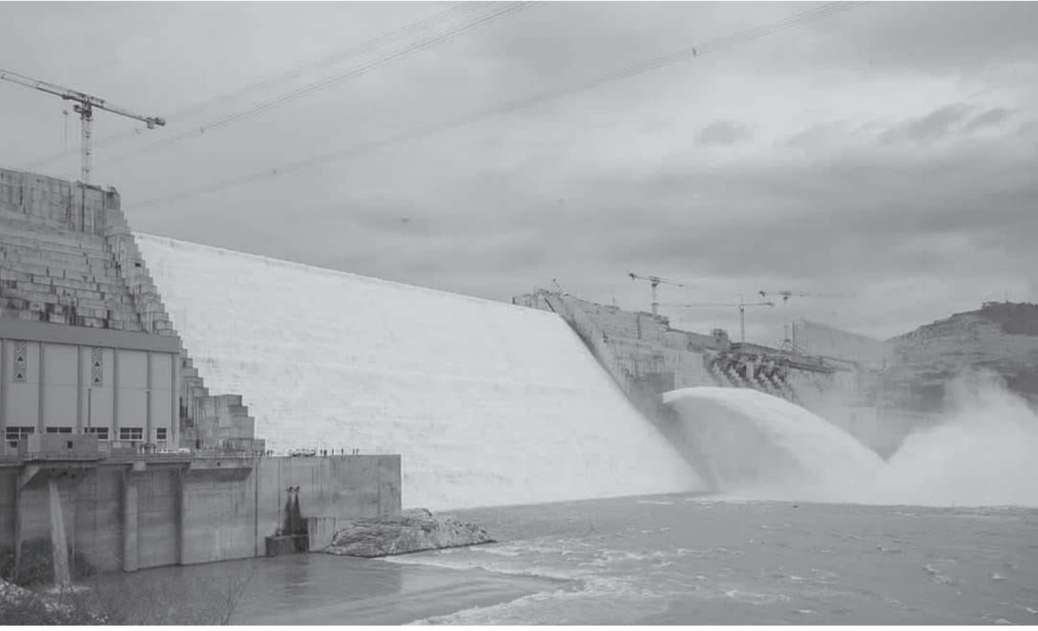
በአባይ ገድብ ሦስት ስኬቶች ተመዝግበዋል

ግድቡ በእነዚህ የኒዮቹ የኢትዮጵያውያንን በአባይ ወንዝ የመልማት ራዲዮ እውን መሆን እንዲሁም አባይ መብራትም ራትም መሆኑን መጀመሩን አብረዋል። የአባይ ግድብ ሰለተኛውን ዙር የውሃ ሙሉት ያደረገውም በእነዚህ ከረምት ነው። ይህም ሌላው የዓመቱ ታላቅ ስኬት ተደርጎ ይወሰዳል። ግድቡ በአሁኑ ወቅት ከ22 ቢሊዮን ሜትር ኩብ በላይ ውሃ መያዝ ችሏል። ገና ከአሁኑ በጉባ አንድ ትልቅ ሃይቅ ተፈጥሯል።