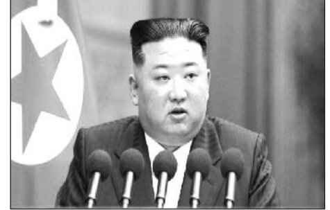
ኪም ጆንግ ኢን ፤ ቀጥላለች። የጦር አቅማን በማሳደግ ከጎረቤቶቿ በተጨማሪ አሜሪካን ማጥቃት ሚደሰችሉ መሣሪያዎችን

የተባበሩት መንግሥታት ድርጅት የፀጥታው ምክር ቤት ውሳኔዎችን በመጣስ ወታደራዊ አቅማን ማሳደጓን