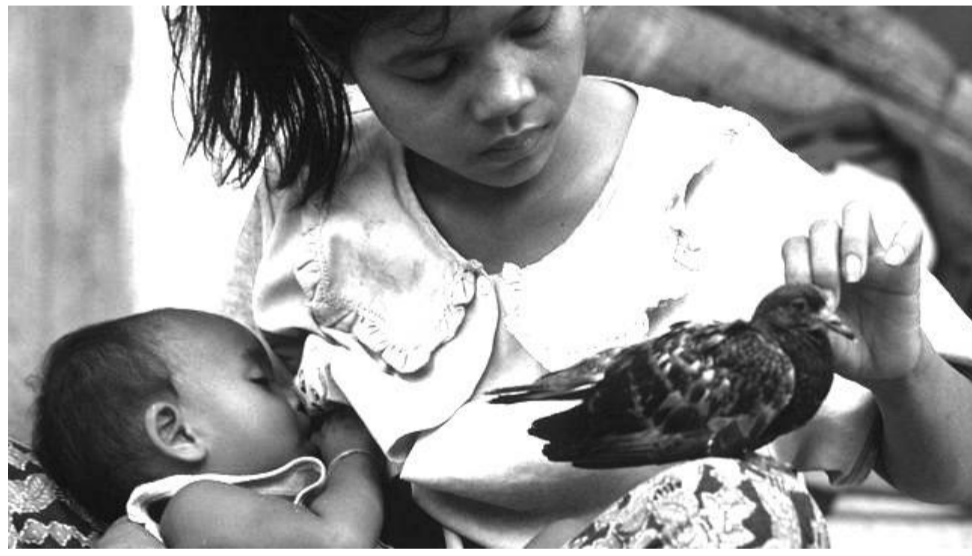
መረጃ መሆኑን የጠቀሱት ከአጥኝዎቹ አንዱ የሆኑት አቺም ስቴክን፣ ከ80 በላይ አገራት ብሔራዊ ብድራቸውን በመክፈል ችግር ላይ ናቸው ብለዋል። አቺም ስቴክን ከአንደዚህ

ዓይነት ቀውስ አንድ እርምጃ የራቁት ስምንት አገራት ብቻ መሆናቸውም ችግሩ ከባድ መሆኑን ያሳያል ማለታቸውን ቢቢሲ ጠቅሶ ዘግቧል።