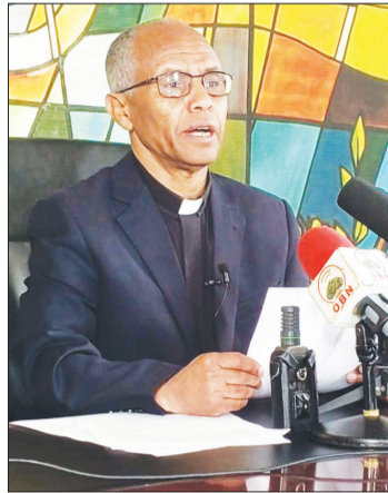
ቁስ ኪርስ ሳቀው