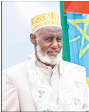
ሺህ ሱልጣን ስማን ሺባ