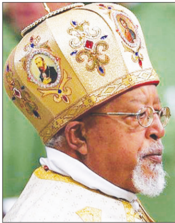
ካርድናል ብርሃኑኢየሱስ ሱራፌል