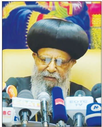
በፁሐ ወቅደስ ስብኃ ማት ያስ

እሁድ 82ኛ ዓመት ቁጥር 001 መስከረም 1 ቀን 2015 ዓ.ም ጠጋ 10.00 ብዕራችን ለኢትዮጵያ ህዳሴ ይተጋል!