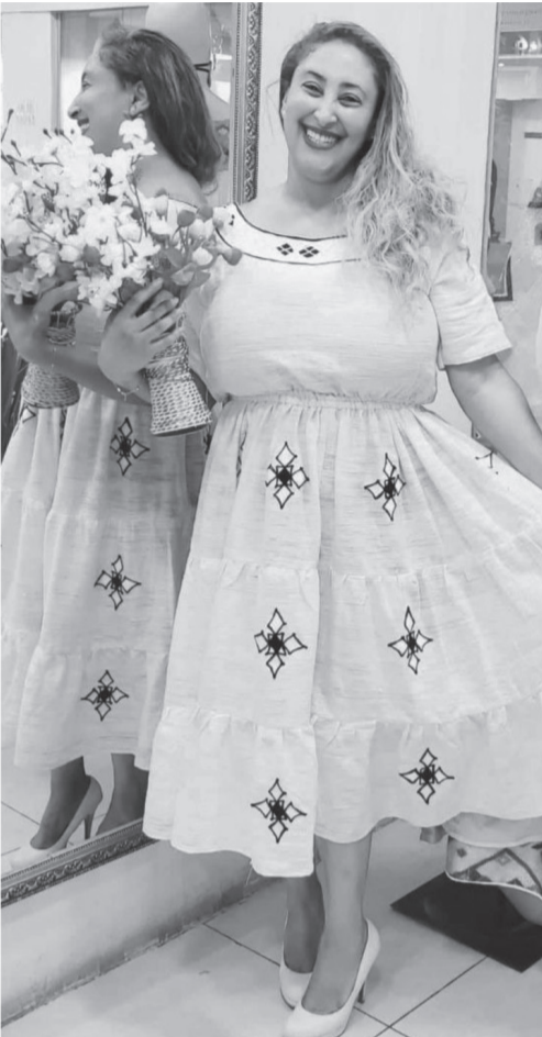
የባህል ስልጣን ተፈጻሚነት እየጨመረ መጥቷል።

ጨምበላላ፣ ጥምቀት፣ ጊፋታ እና ሌሎችም በርካታ የማህበረሰቡን ባህላዊና ሃይማኖታዊ ስርዓቶች የሚያሳዩ ተወዳጅ እሴቶች በድምቀት ይከበራሉ። አገሪቱ ከውጭ ሆኖ የሚመለከታቸውን በሚያስቀኑና “የኔ በሆኑ” በሚያሰኙ ኢትዮጵያዊ ህብር ማንነቶች የደመቀችና የተወደደች ነች።